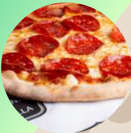
Pizza Personal Pepperoni