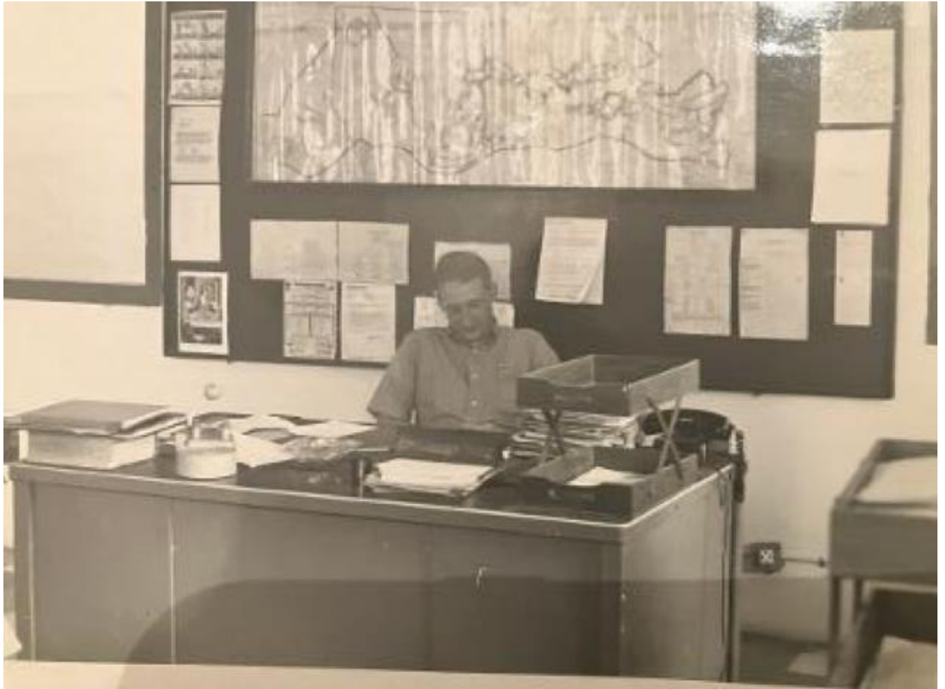
“Hard at work” in my office at the Dinh Tuong Province Headquarters in IV Corp. (approximately 100 km south of Saigon).