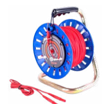
Cable 100 m rojo para medir la toma de tierra en carrete