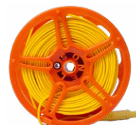
Cable 50 m amarillo para medir la toma de tierra en carrete (conectores tipo banana)