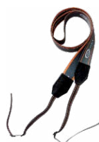
Arnés para el medidor (tipo M1)