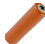
4 x pila alcalina 1,5 V AA, LR6