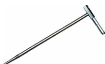
Sonda de medición para clavar en el suelo (30 cm)