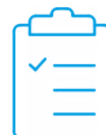
Certificado de calibración con acreditación