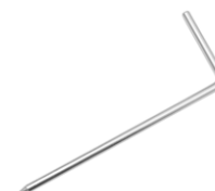
4 x sonda de medición para clavar en el suelo (25 cm)