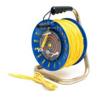
Cable 200 m amarillo para medir la toma de tierra en carrete