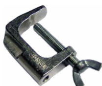
Mordaza (conector tipo banana)