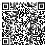
AHMAD SHARIFF BIN HAMBALI KETUA EKSEKUTIF CHIEF EXECUTIVE PIHAK BERKUASA PERANTI PERUBATAN MEDICAL DEVICE AUTHORITY

Lesen ini diberikan tertakluk kepada peruntukan-peruntukan di bawah Akta 737 dan peraturan-peraturan dibawahnya serta syarat-syarat seperti di Lampiran 1. This licence is granted subject to the provisions under Act 737 and its subsidiary legislations and the conditions as in Attachment 1.