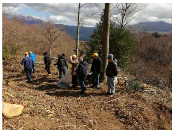
Giornata ecologica organizzata dal comune di Trecchina (PZ)