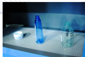
► Objetos de plástico

MÁXIMA VELOCIDAD 0-35 m/min (a solicitud)