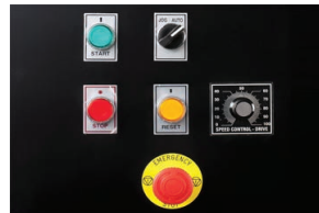
► Velocidad ajustable de la banda transportadora