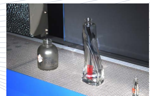
► Objetos de vidrio