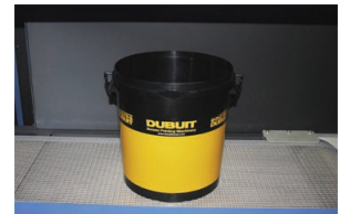
► Secado de objetos grandes