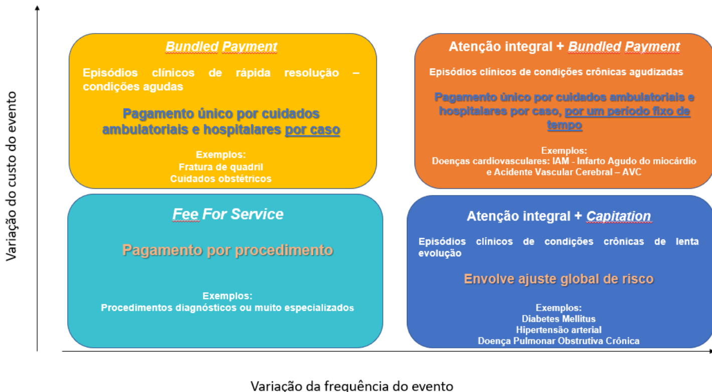
Figura 4 – Diferentes sistemas de pagamento equacionam diferentes problemas de custo e qualidade do cuidado em saúde:

Fonte: Adaptado de Center for Healthcare Quality and Payment Reform , em 2017 - http://www.chqpr.org/ Livre Tradução: Daniele Silveira – Especialista em Regulação - ANS