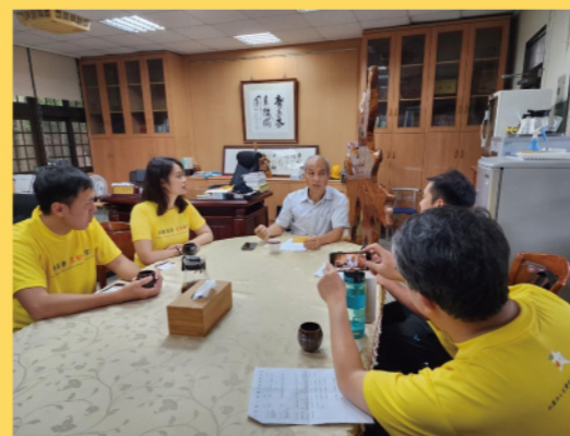
與校長對談，討論偏鄉運動推廣發展現況