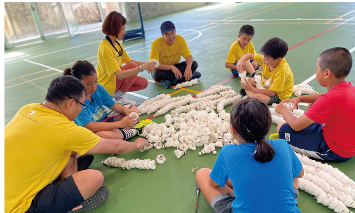
《圖/隨隊志工與小朋友一起，協助教練整理隊內的二手練習球，並汰舊換新。》

這位如師、如父，甚至有如全日安親的曾教練，絕對是無敵真心愛著孩子，也愛著羽球。當協會與他聯繫時，他興奮的與我們分享好多孩子們的事情、還有關於他對於羽球推廣、偏鄉教育的理想，其中好多部分與我們不謀而合，所以當他極力邀請我們前往綠島時，雖然會內因為草創資源及人力真的很有限(畢竟以本會落腳於新北市來說...綠島超級遠)，最後我們還是決定要排除萬難前往綠島。