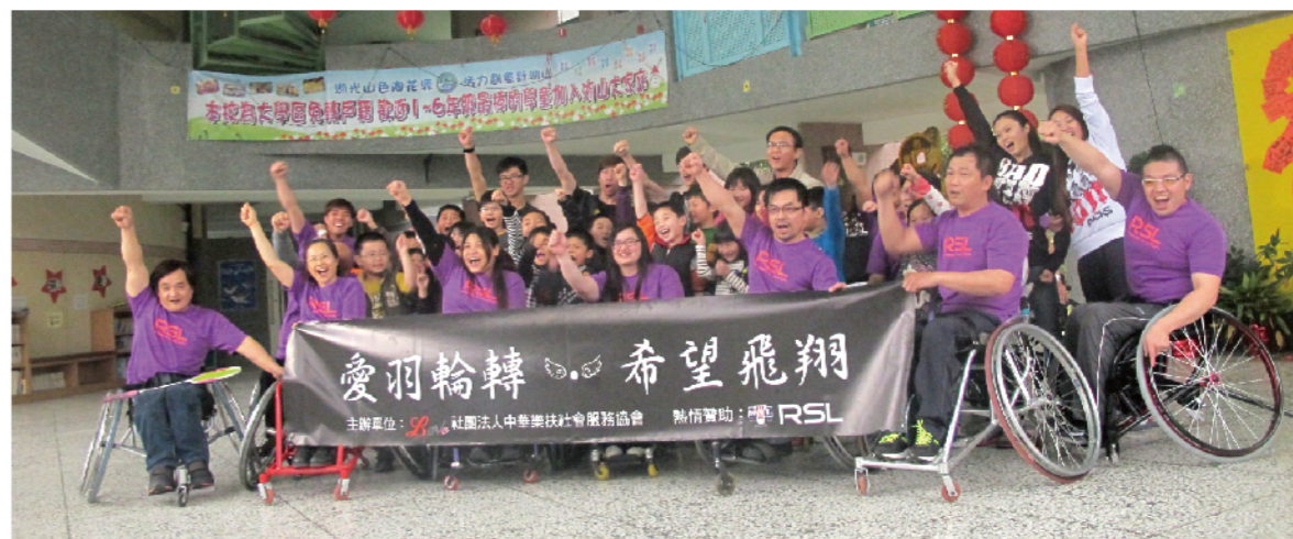
《圖/2013年愛羽輪轉·希望飛翔活動在宜蘭湖山國小》