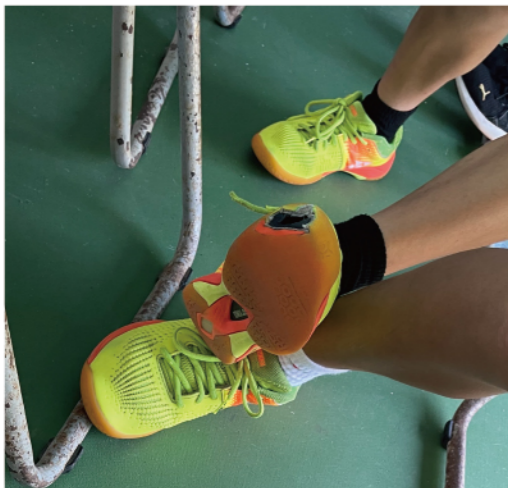
《圖/孩子們秀出球鞋給我們瞧，每雙鞋都破了》

協會帶了一箱二手舊球供孩子們平日練習，另外也扛了一箱新的比賽級羽毛球及球衣、握把布、球線...等，提供給教練及孩子們。但我們到了現場，發現孩子需要更多的支援。可能是因為地板是磨砂地的關係，綠島羽球隊裡的孩子，每個腳上的鞋幾乎都有大大小小的破洞，有些