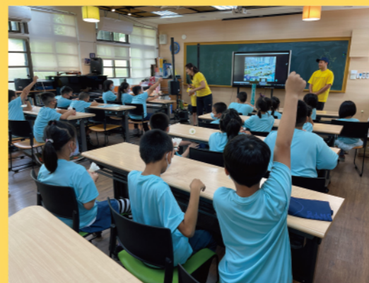
理事長為孩子們說說羽毛球製作的故事