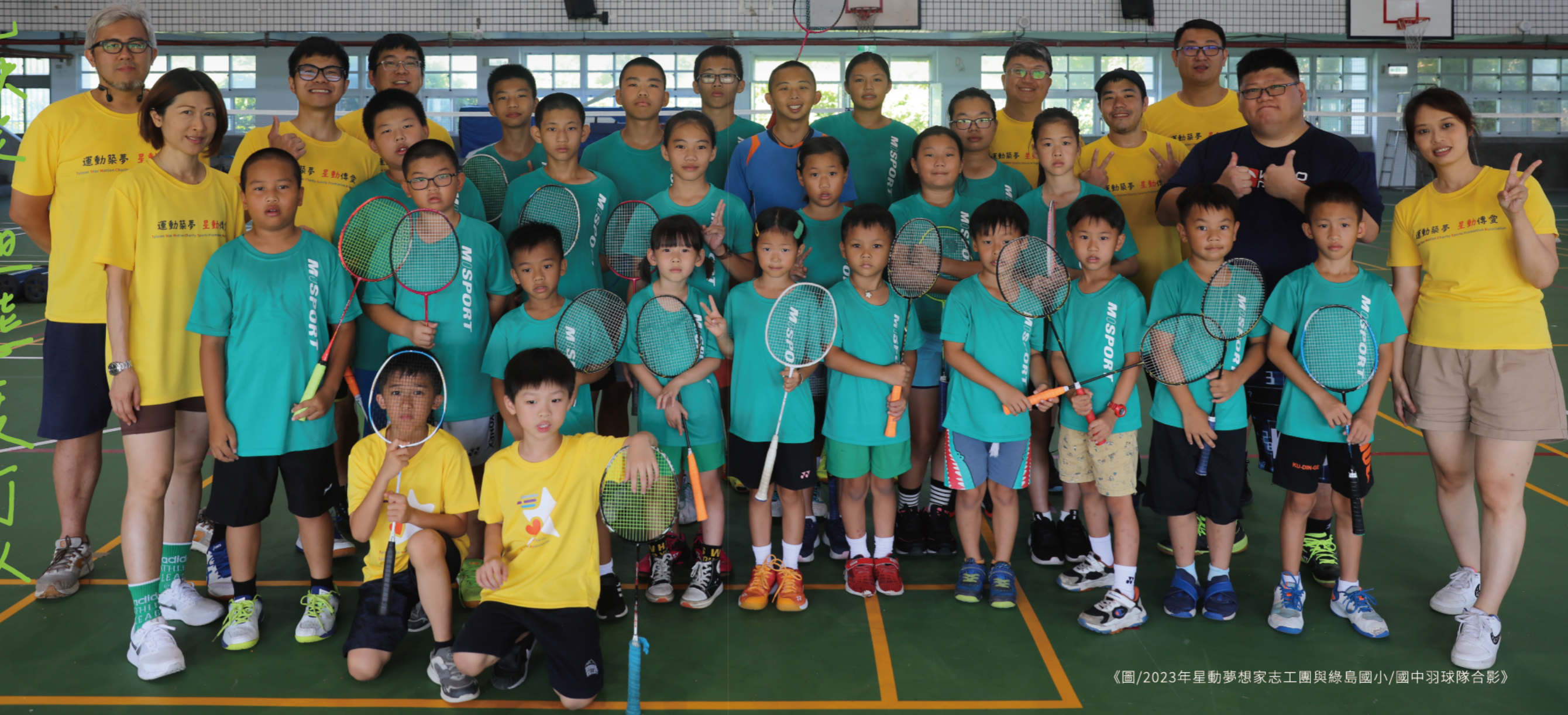
《圖/2023年星動夢想家志工團與綠島國小/國中羽球隊合影》