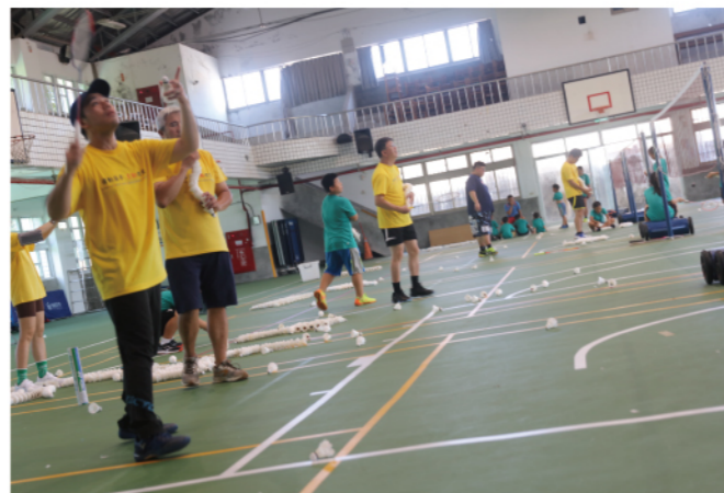
《圖/星動夢想教練陪綠島羽球隊的孩子們訓練》

綠島的孩子們只能在島上一路讀到國中畢業，無論如何就得到本島去讀高中。羽球對他們而言，不只是一項運動而已，更有可能是一個到更好、更有資源的高中，甚至是大學就讀的機會，這也是教練不論工時多長、訓練多麼辛苦，也要與孩子們一同努力不懈的原因之一。