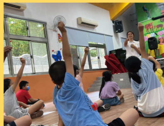
與孩子們暖身互動