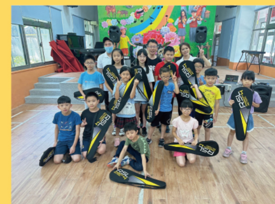
贈送器材資源給校方