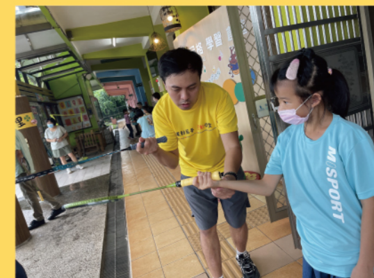
場地限制，星動志工利用走廊帶孩子們體驗羽球