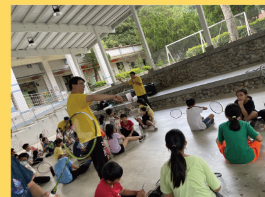
星動志工帶全校小朋友體驗羽球