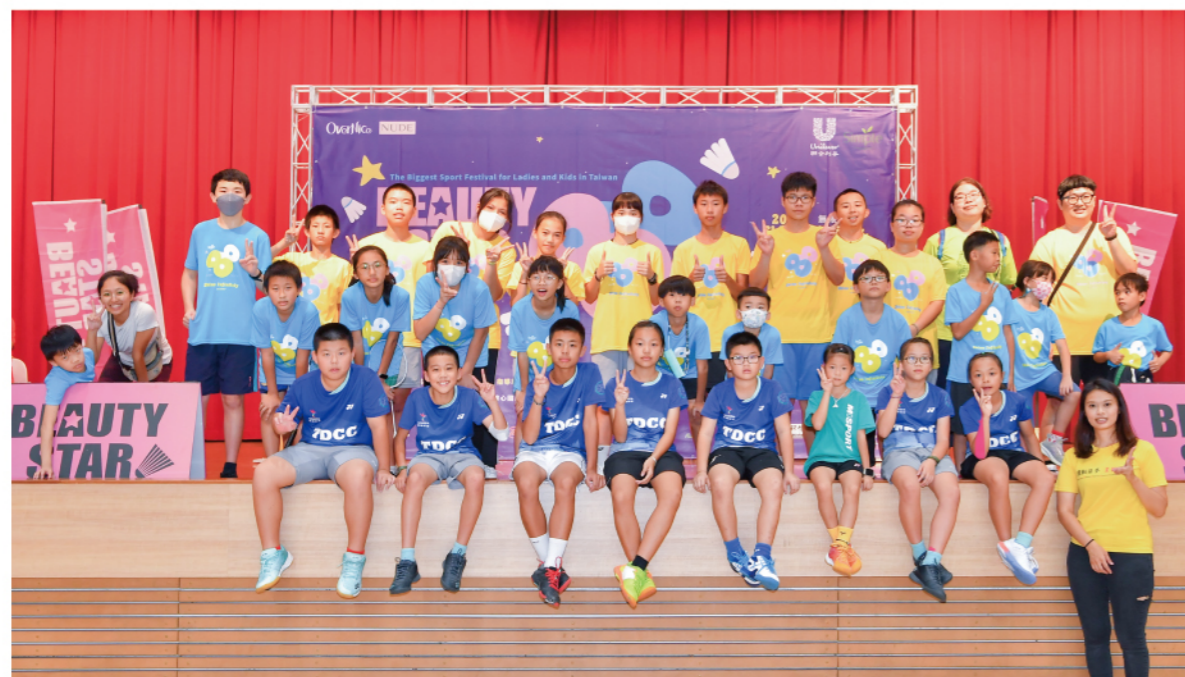
《圖/綠島羽球隊擔任美力之星公益運動嘉年華陪賽志工及現場服務志工》

五個月後，邀請孩子們到台北一趟，擔任協會主辦賽事的志工團，一同參與運動賽事的舉辦。