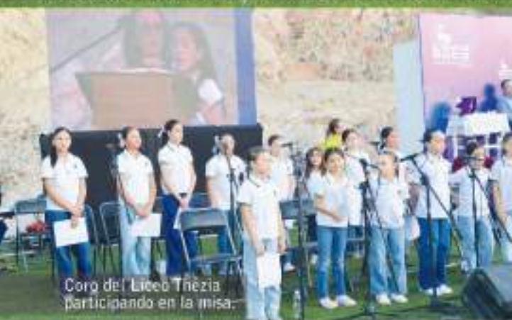
Coro del Liceo Thezia participando en la misa.