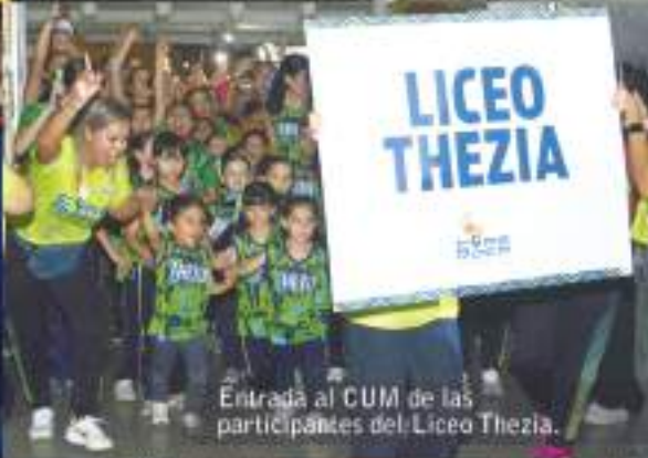
Entrada al CUM de las participantes del Liceo Thezia.