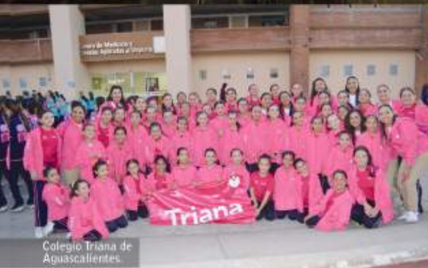
Colegio Triana de Aguascalientes.