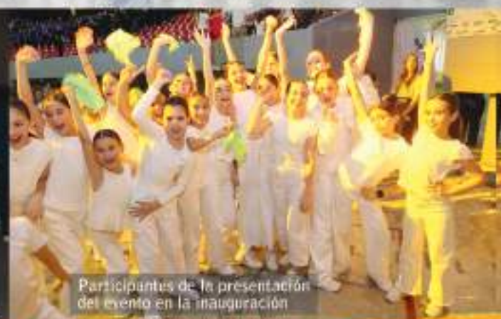
Participantes de la presentación del evento en la inauguración.