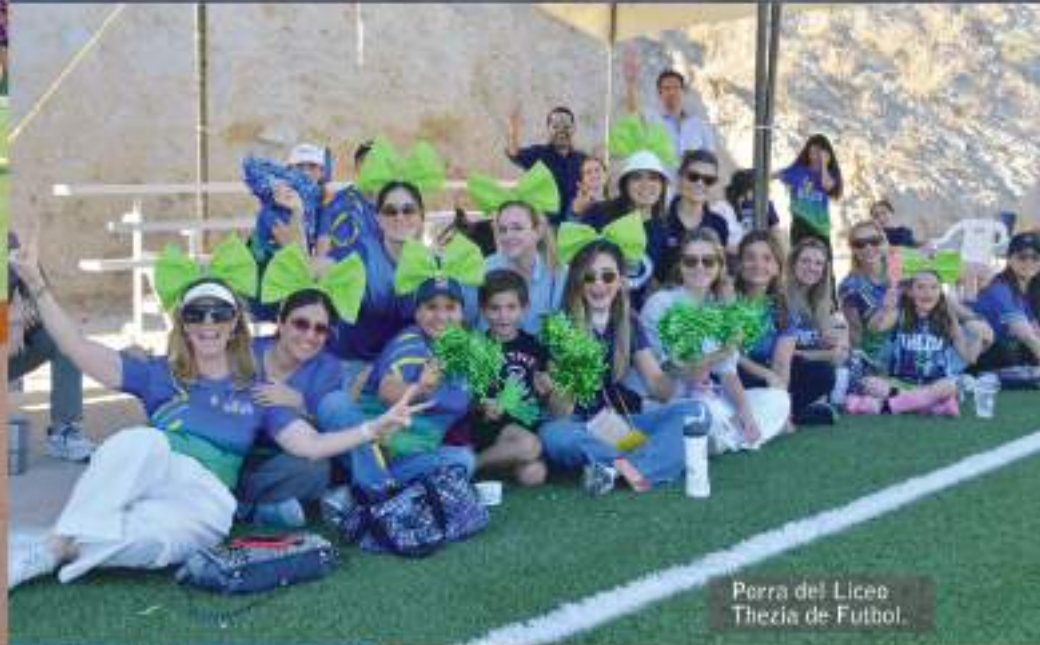
Porra del Liceo Thezia de Fútbol.