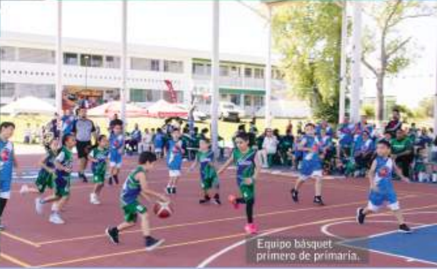
Equipo básquet primero de primaria.