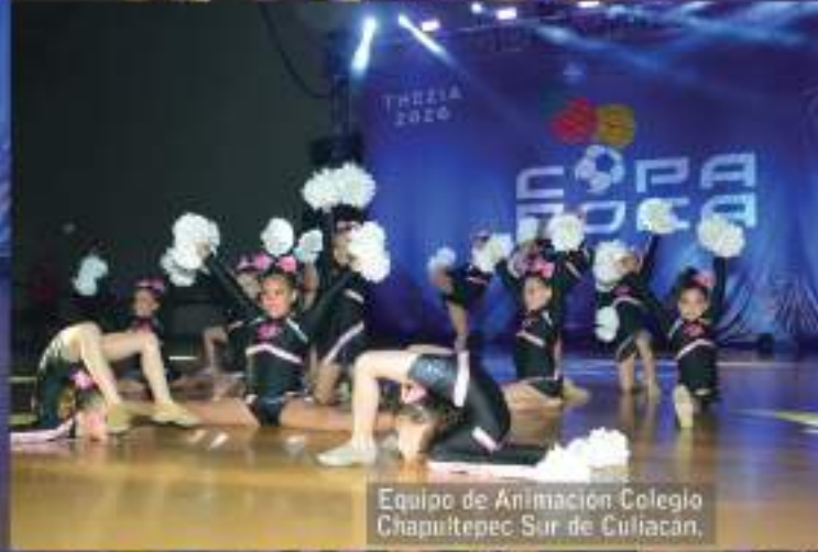
Equipo de Animación Colegio Chapultepec Sur de Cullacán.