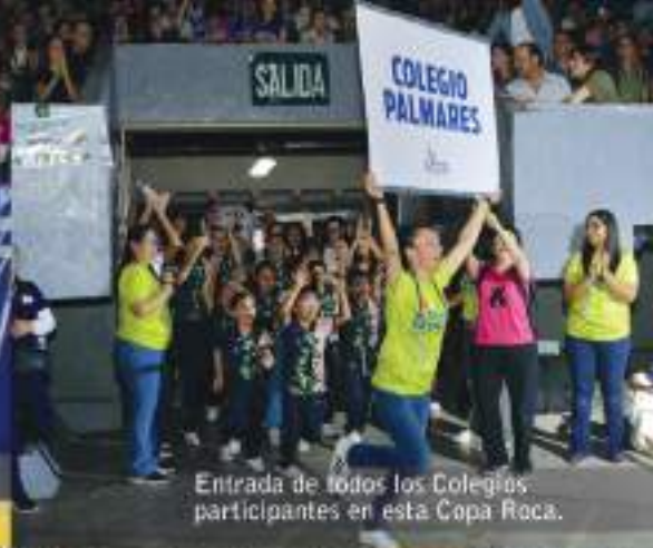
Entrada de todos los Colegios participantes en esta Copa Roca.