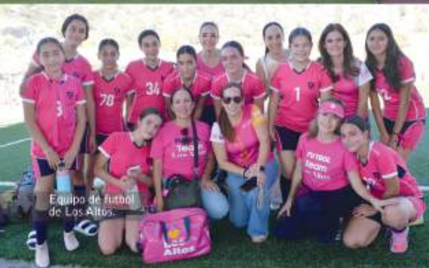
Equipo de fútbol de Los Altos.