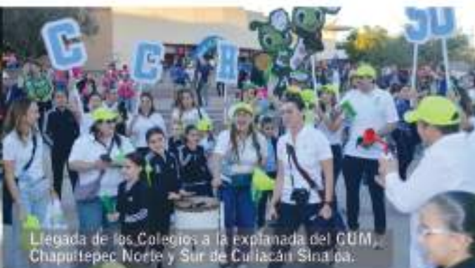
Llegada de los Colegios a la explanada del GUM, Chapultepec Norte y Sur de Culiacán Sinaloa.