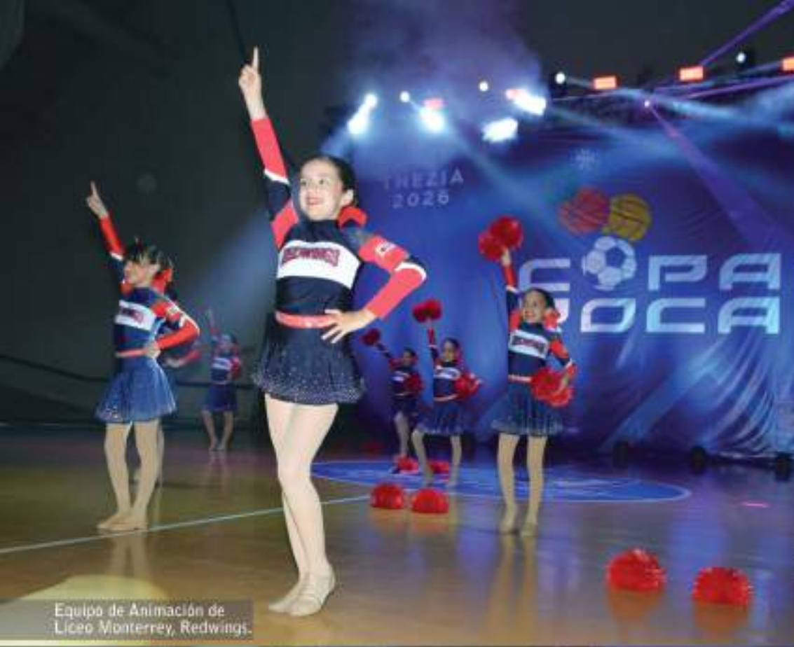
Equipo de Animación de Liceo Monterrey, Redwings.