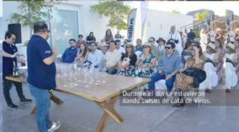
Durante el día se estuvieron dando cursos de cata de vinos.