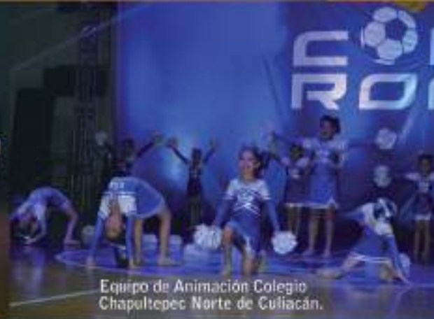
Equipo de Animación Colegio Chapultepec Norte de Cullacán.