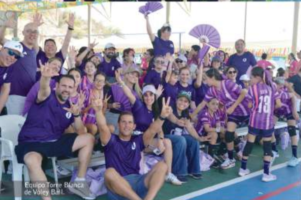
Equipo Torre Blanca de Vóley Ball.