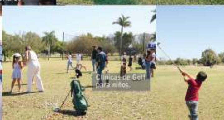
Clinicas de Golf para niños.