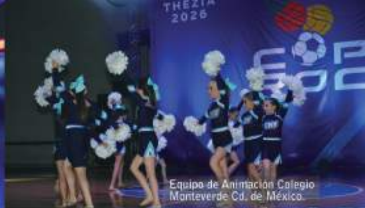
Equipo de Animación Colegio Monteverde Cd. de México.