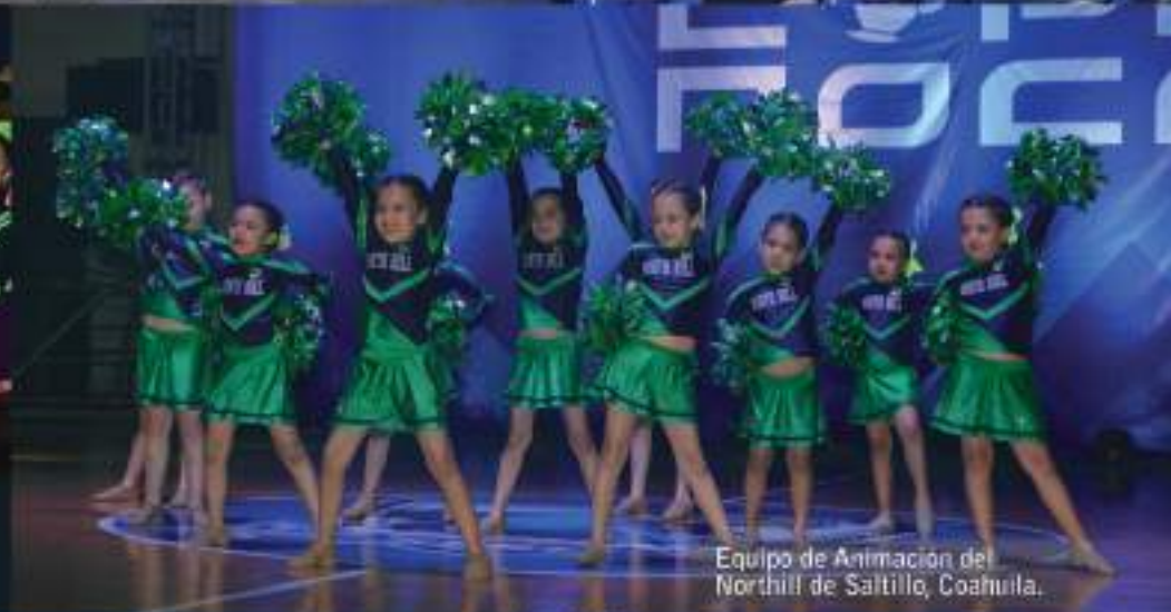
Equipo de Animación del Northill de Saltillo, Coahuila.