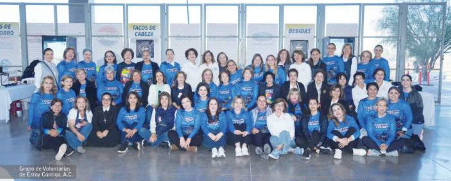
Grupo de Voluntarias de Estoy Contigo, A.C.