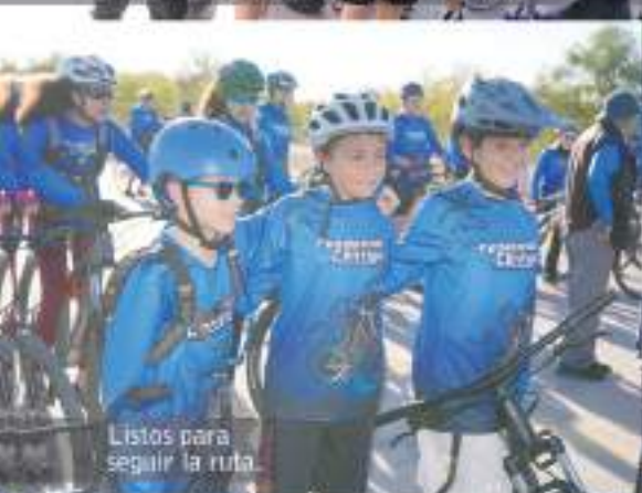
Listos para seguir la ruta.