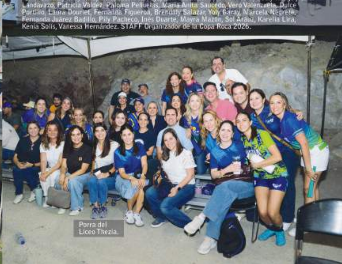
Porra del Liceo Thezia.