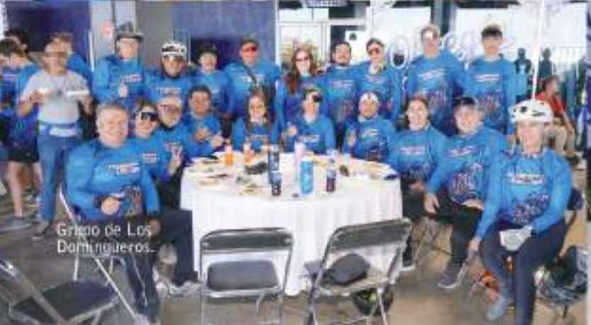
Grupo de Los Domingueros.