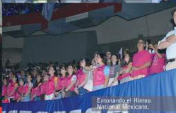
Estrenando el Himno Nacional Mexicano.