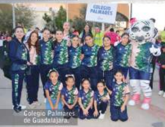
Colegio Palmares de Guadalajara.