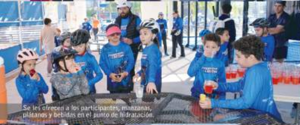
Se les ofrecen a los participantes, manzanas, plátanos y bebidas en el punto de hidratación.