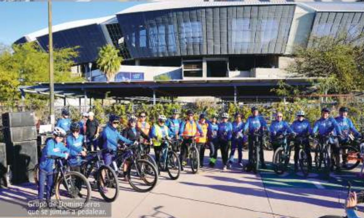
Grupo de Domingueros que se juntan a pedalear.