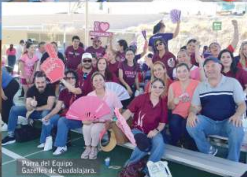
Porra del Equipo Gazelles de Guadalajara.