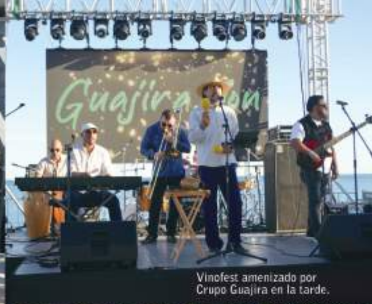
Vinofest amenizado por Crupo Guajira en la tarde.