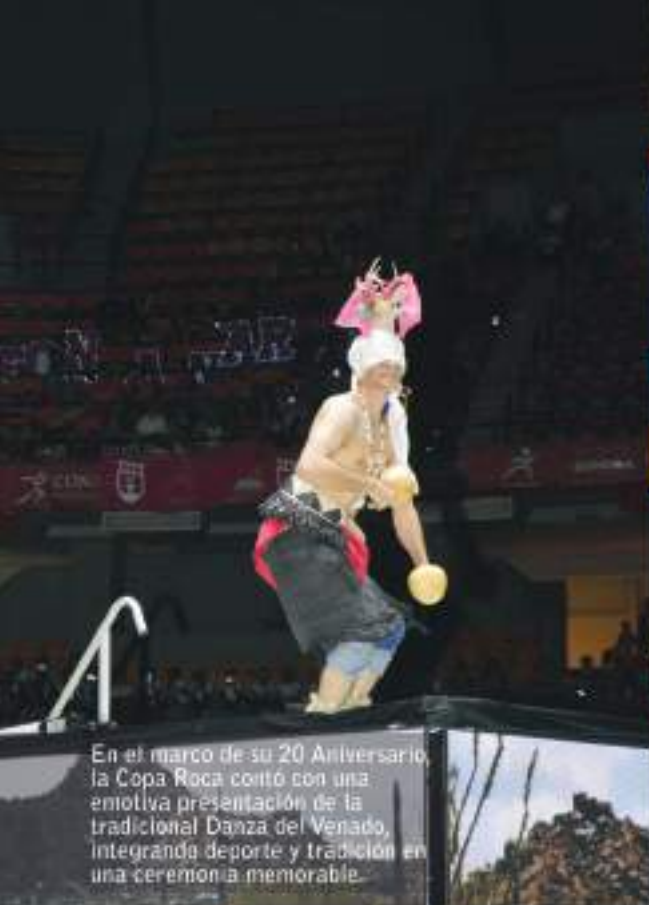
En el marco de su 20 Aniversario, la Copa Roca contó con una emotiva presentación de la tradicional Danza del Venado, integrando deporte y tradición en una ceremonia memorable.