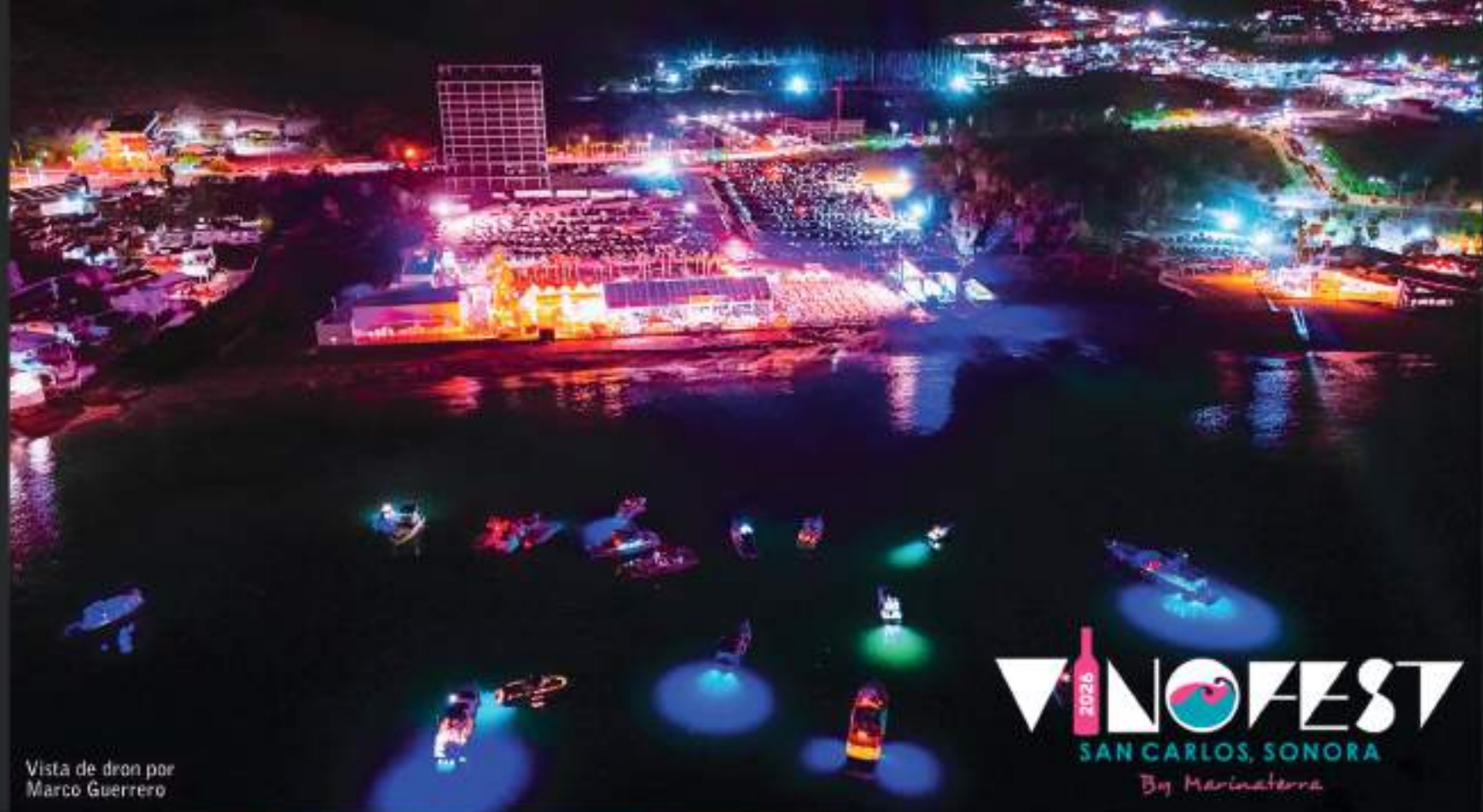
Vista de dron por Marco Guerrero