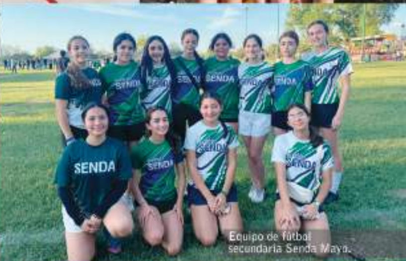
Equipo de fútbol secundaria Senda Maya.