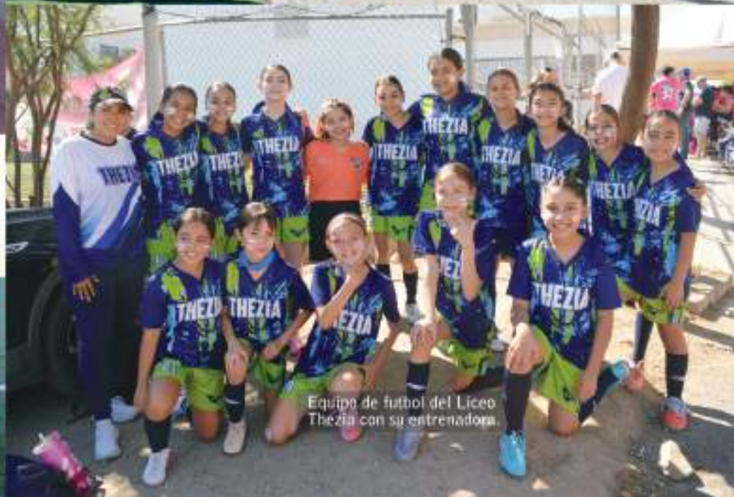
Equipo de fútbol del Liceo Thezia con su entrenadora.