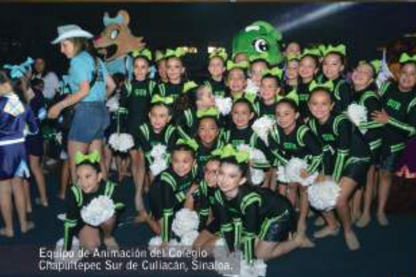
Equipo de Animación del Colegio Chapultepec Sur de Cullacán, Sinaloa.