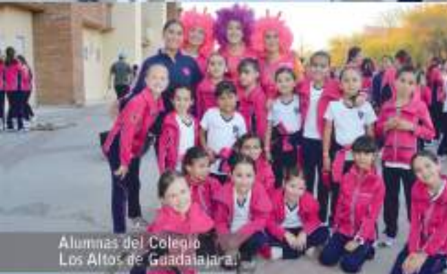
Alumnas del Colegio Los Altos de Guadalupe.