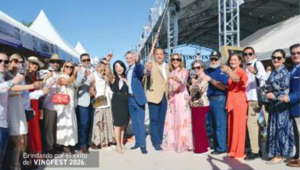
Brindando por el éxito del VINOFEST 2026