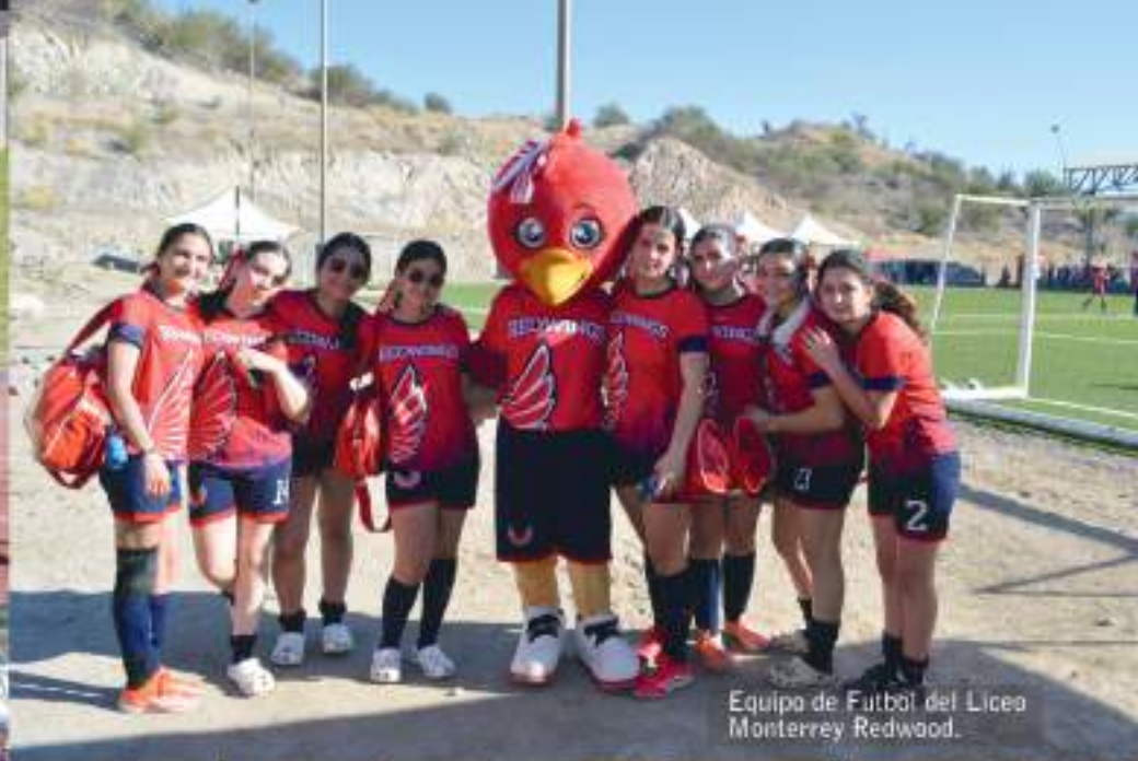
Equipo de Fútbol del Liceo Monterrey Redwood.