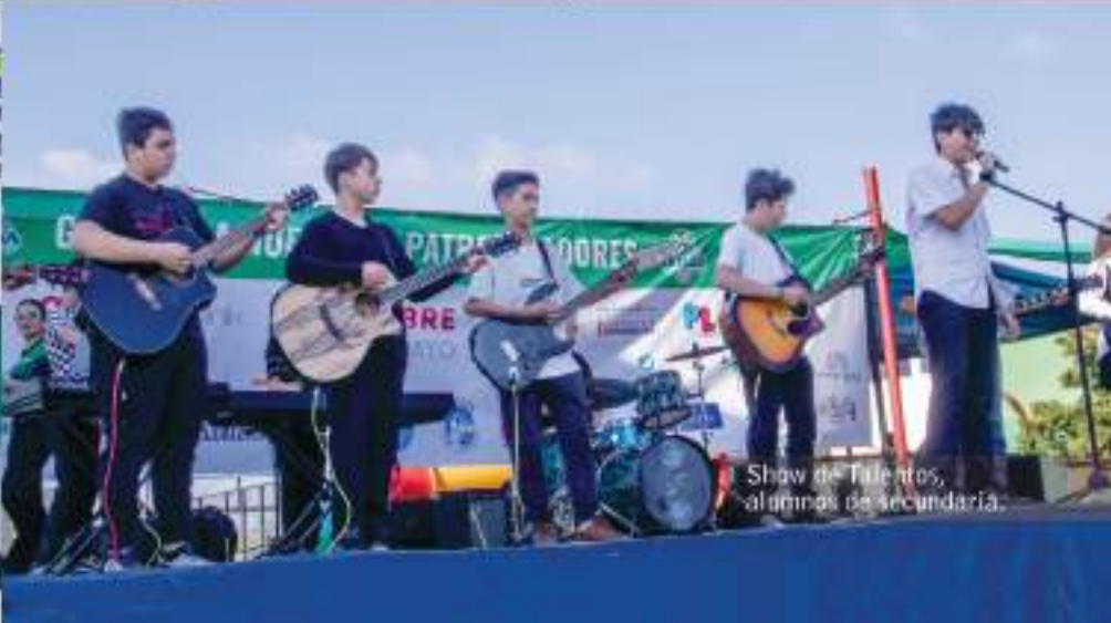
Show de Talentos, alumnos de secundaria.