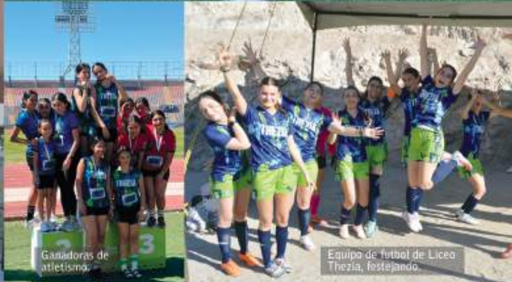
Ganadoras de atletismo.