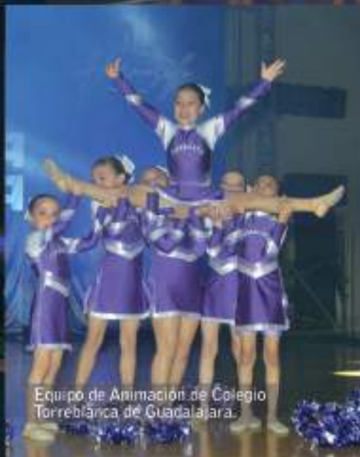
Equipo de Animación de Colegio Torreblanca de Guadalajara.