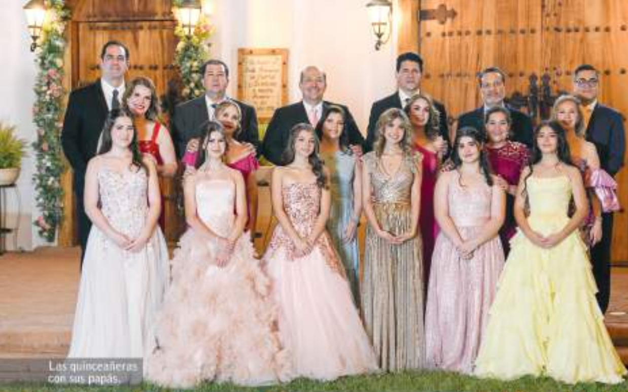
Las quinceañeras con sus papás.