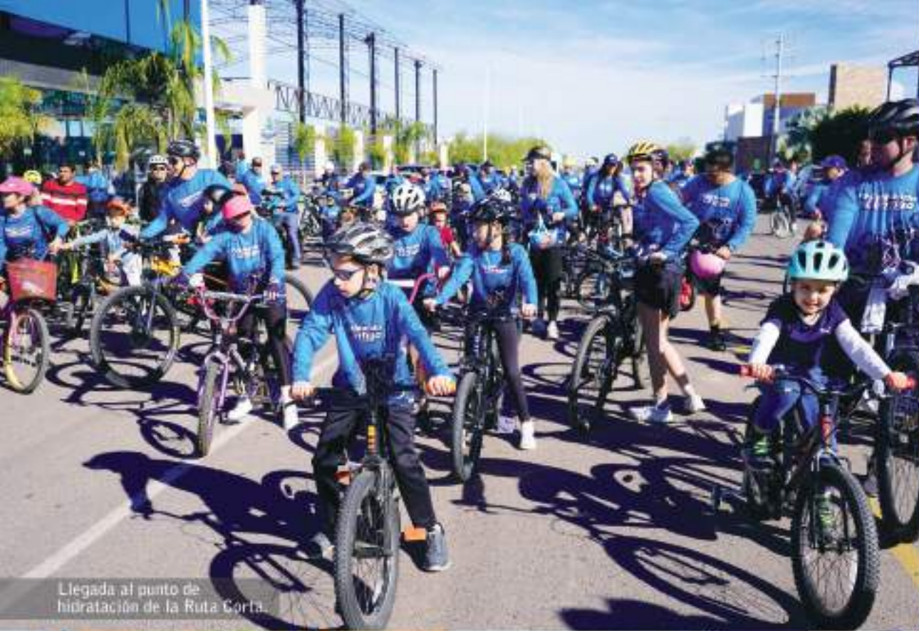
Llegada al punto de hidratación de la Ruta Corta.