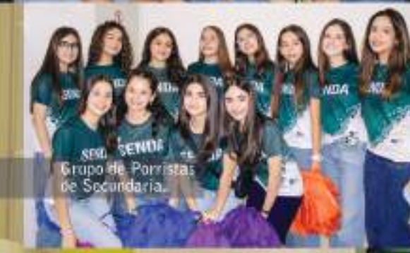
Grupo de Porristas de Secundaria.