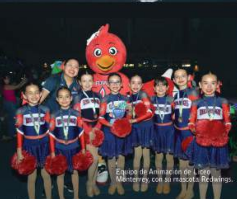
Equipo de Animación de Liceo Monterrey, con su mascota Redwings.