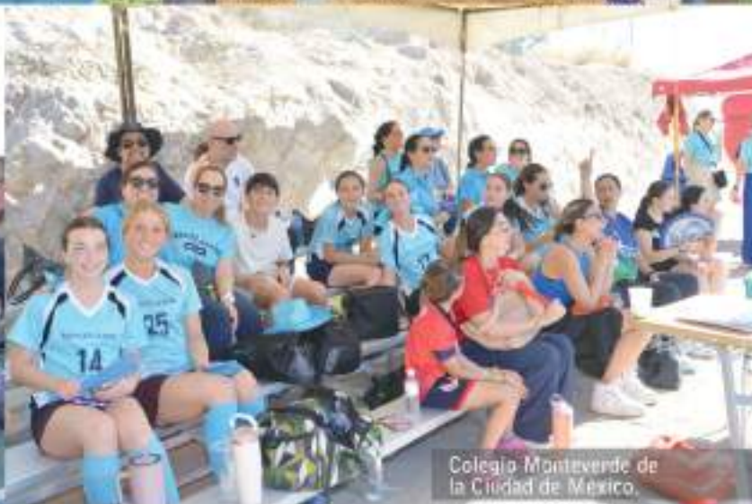
Colegio Montevende de la Ciudad de México.