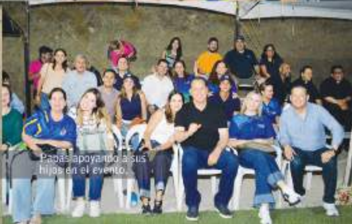
Padres apoyando a sus hijos en el evento.