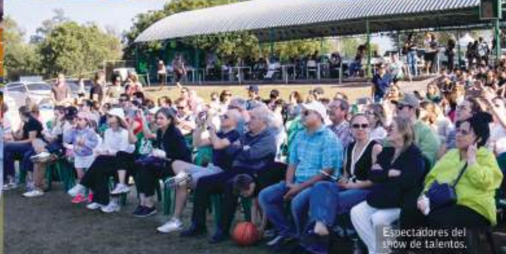
Espectadores del show de talentos.