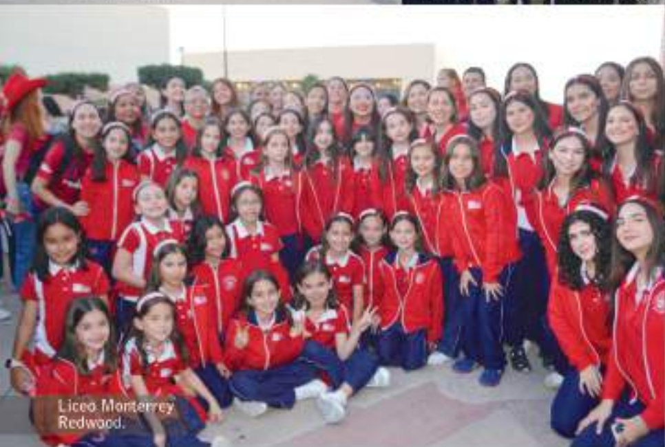
Liceo Monterrey Redwood.