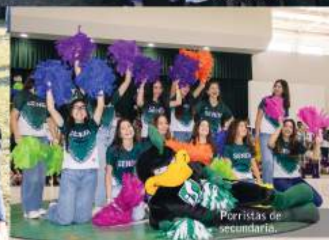
Porristas de secundaria.