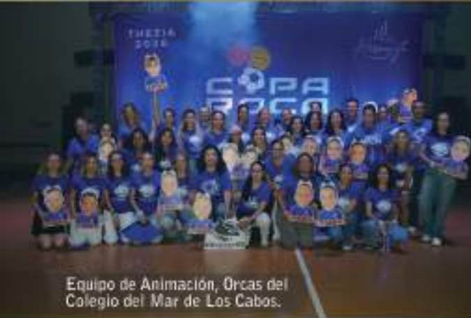
Equipo de Animación, Orcas del Colegio del Mar de Los Cabos.