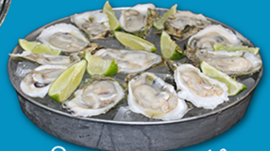
Ostiones en su Concha