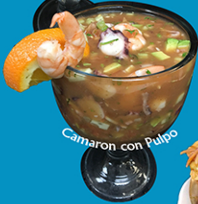
Camaron con Pulpo