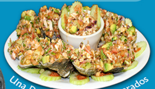
Una Docena Ostiones Preparados