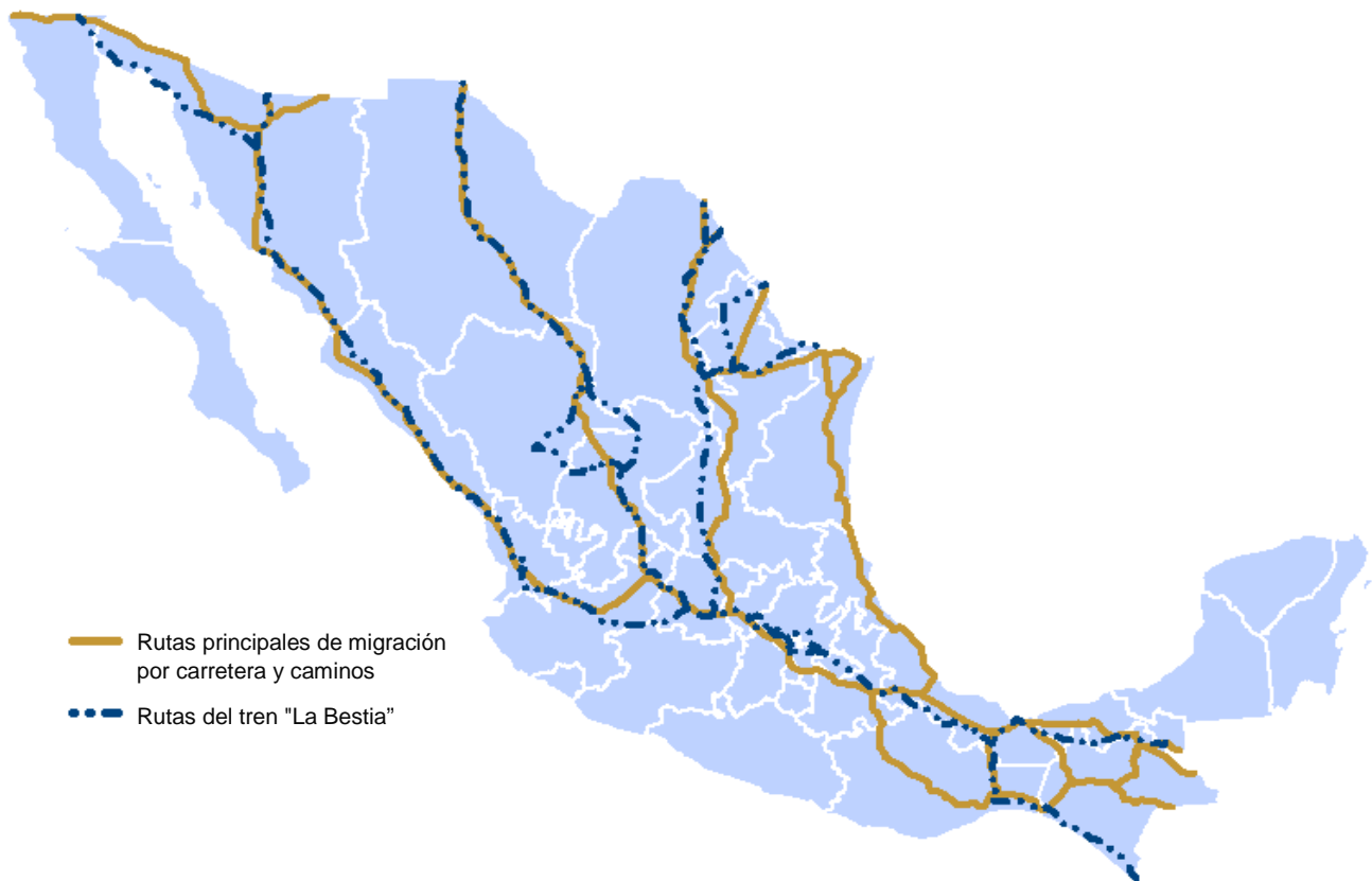
Mapa 1. Principales rutas migratorias terrestres desde el Sur al Norte que atraviesan México por carretera y por el tren "La Bestia", 2017