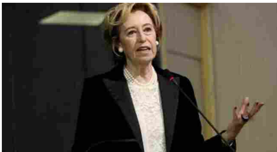
Lombardia, i casi di epatite sconosciuta tra i bambini salgono a nove e potrebbero aumentare

f Lombardia in allerta per nove casi di epatite sconosciuta tra i bambini. I casi potrebbero aumentare nelle prossime ore perché ci sono altre situazioni sotto osservazione.