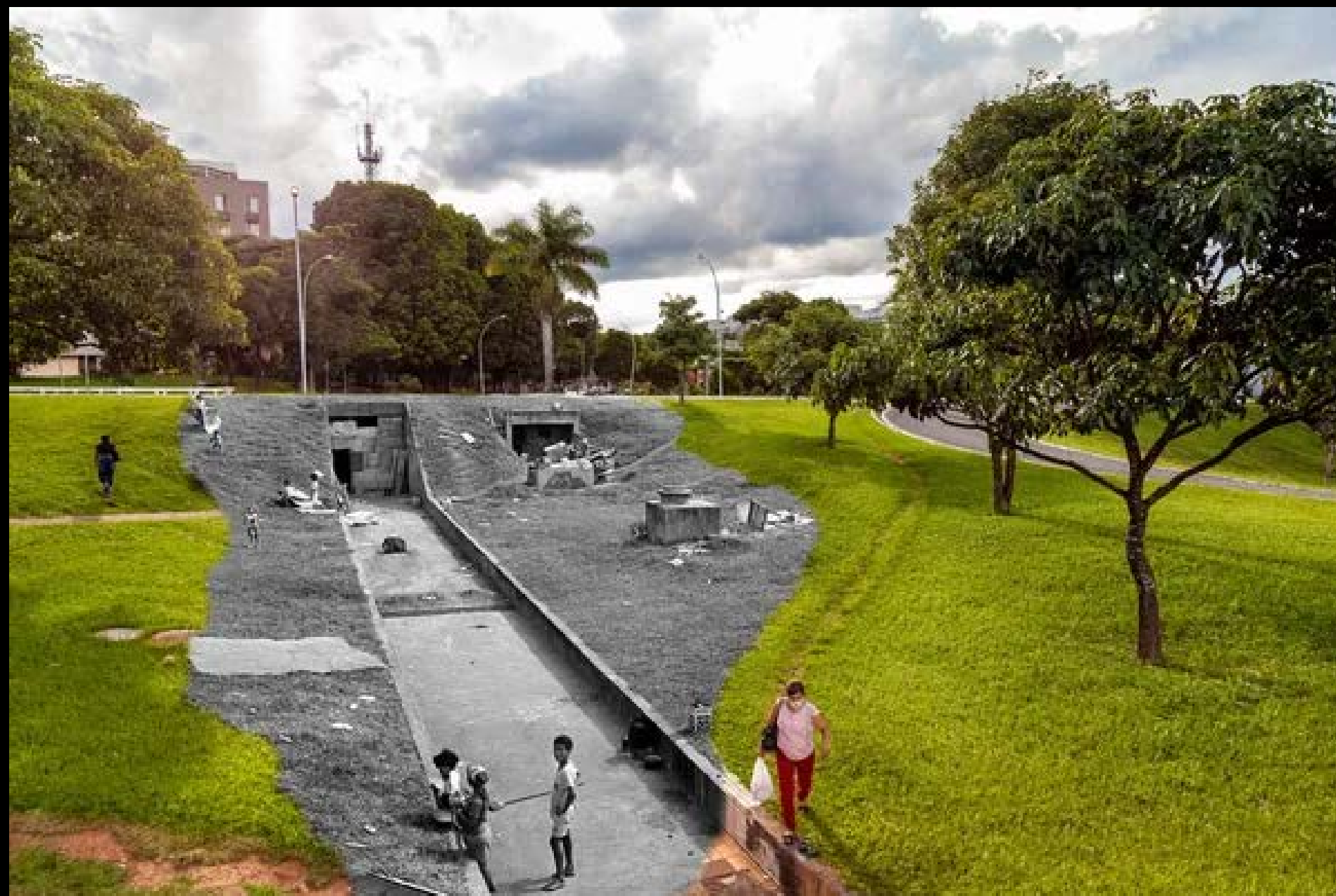
PASSAGEM SUBTERRÂNEA DA SQN 215 FOTOGRAFIA 20