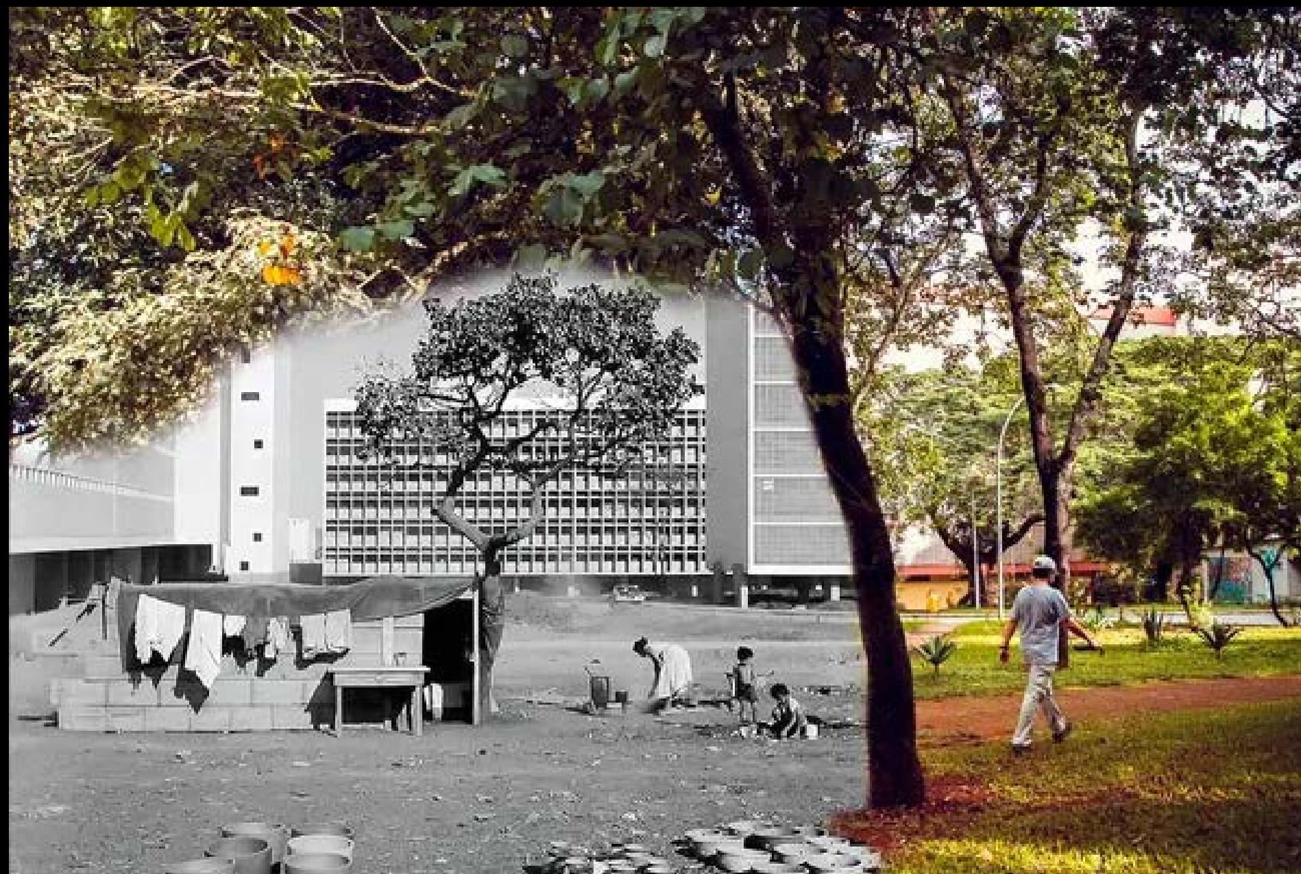
CANDANGO EM BARRACO NA ENTRADA DA SQS106 FOTOGRAFIA 21