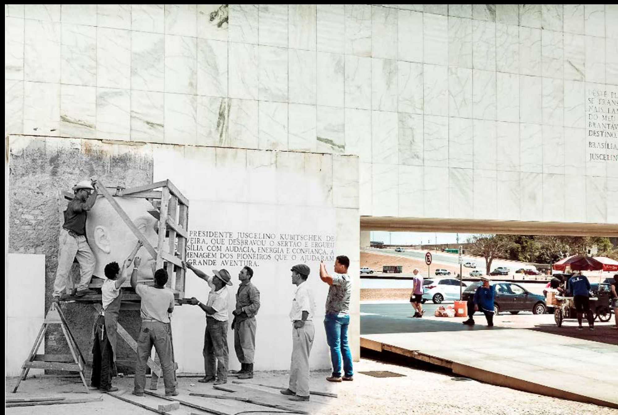
BUSTO DE JK NO MUSEU HISTÓRICO DE BRASÍLIA, PRAÇA DOS TRÊS PODERES , FOTOGRAFIA 31