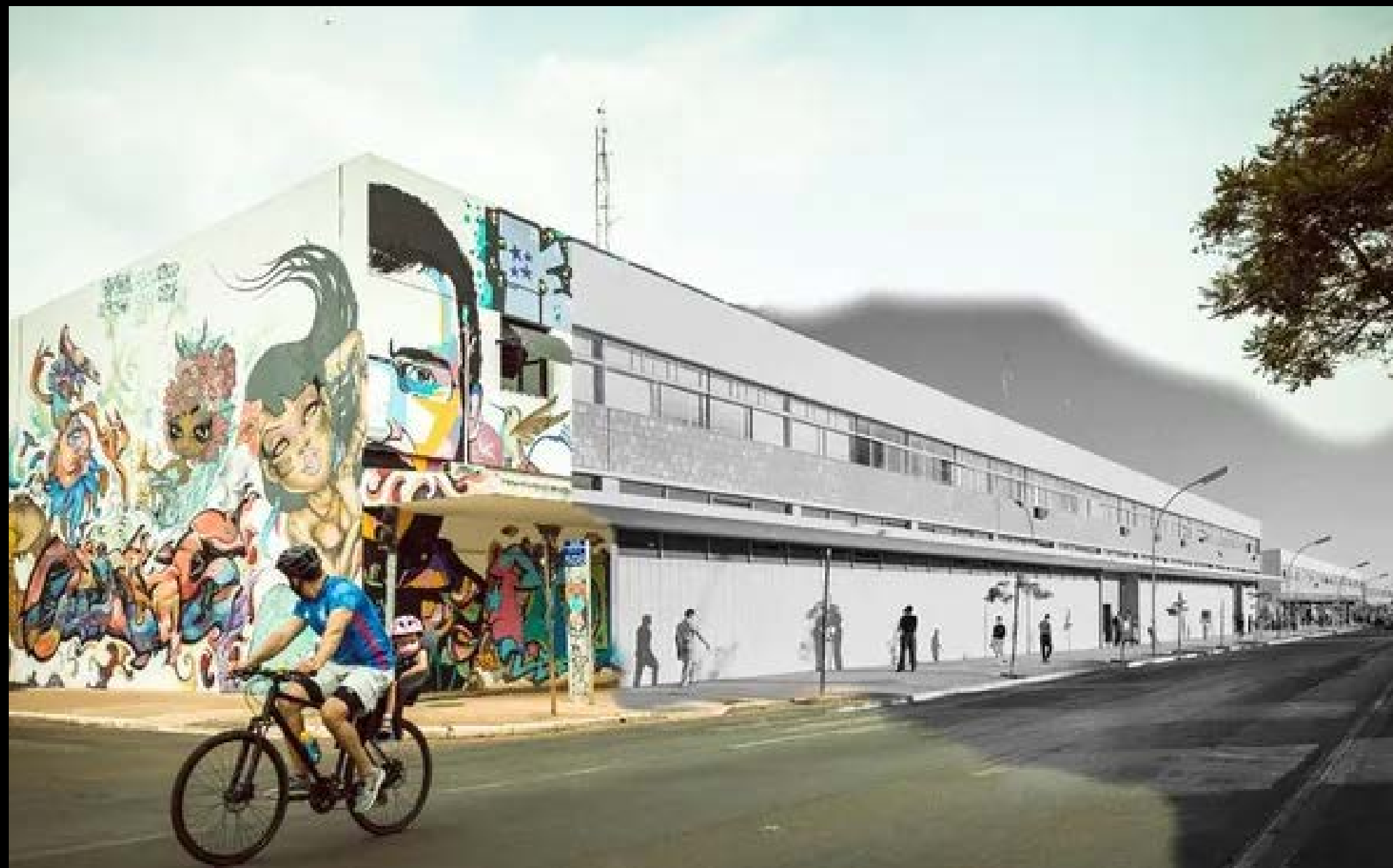
ESPAÇO CULTURAL RENATO RUSSO/TEATRO GALPÃO FOTOGRAFIA 12