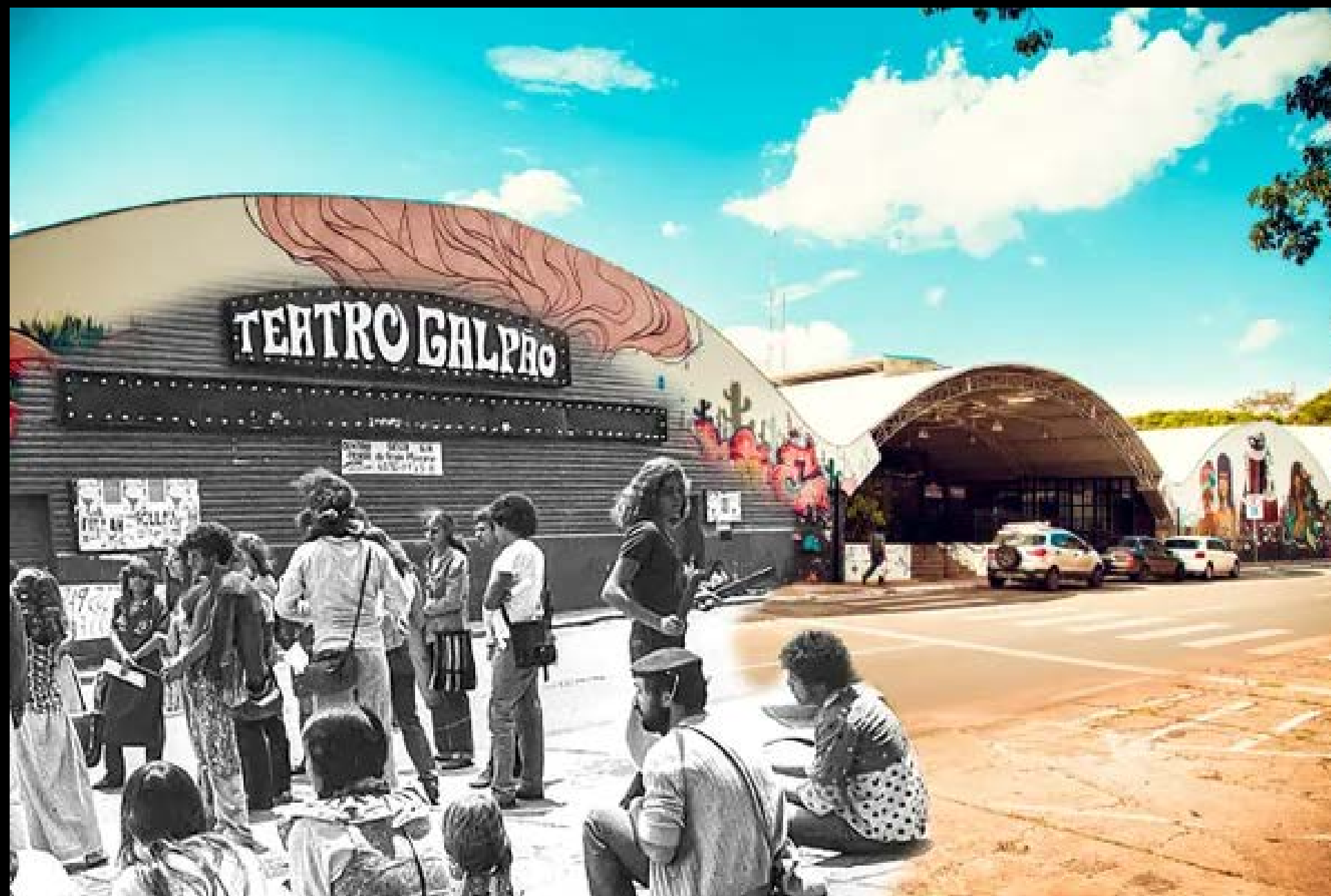
TEATRO GALPÃO/ESPAÇO RENATO RUSSO FOTOGRAFIA 17