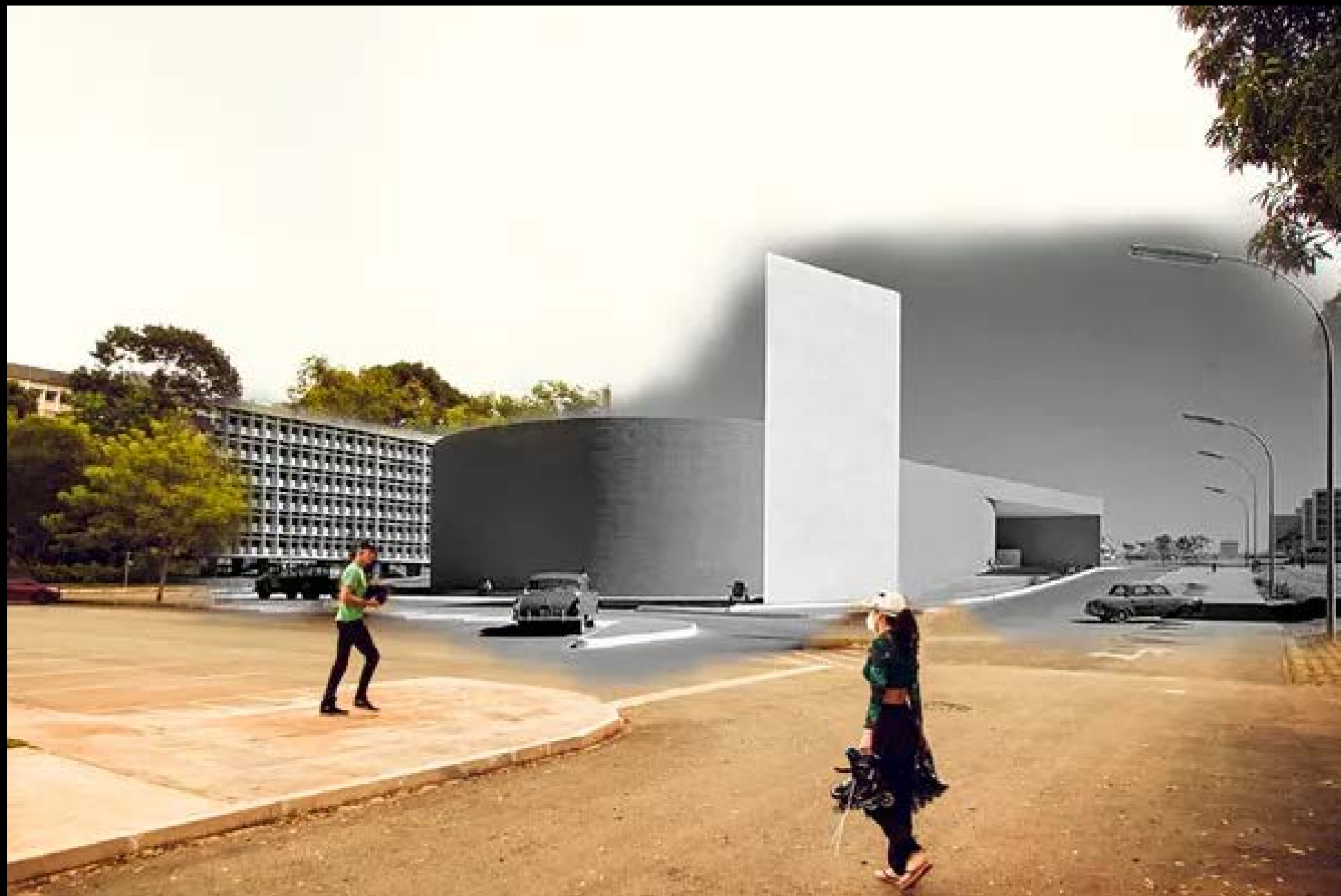
CINE BRASÍLIA FOTOGRAFIA 23