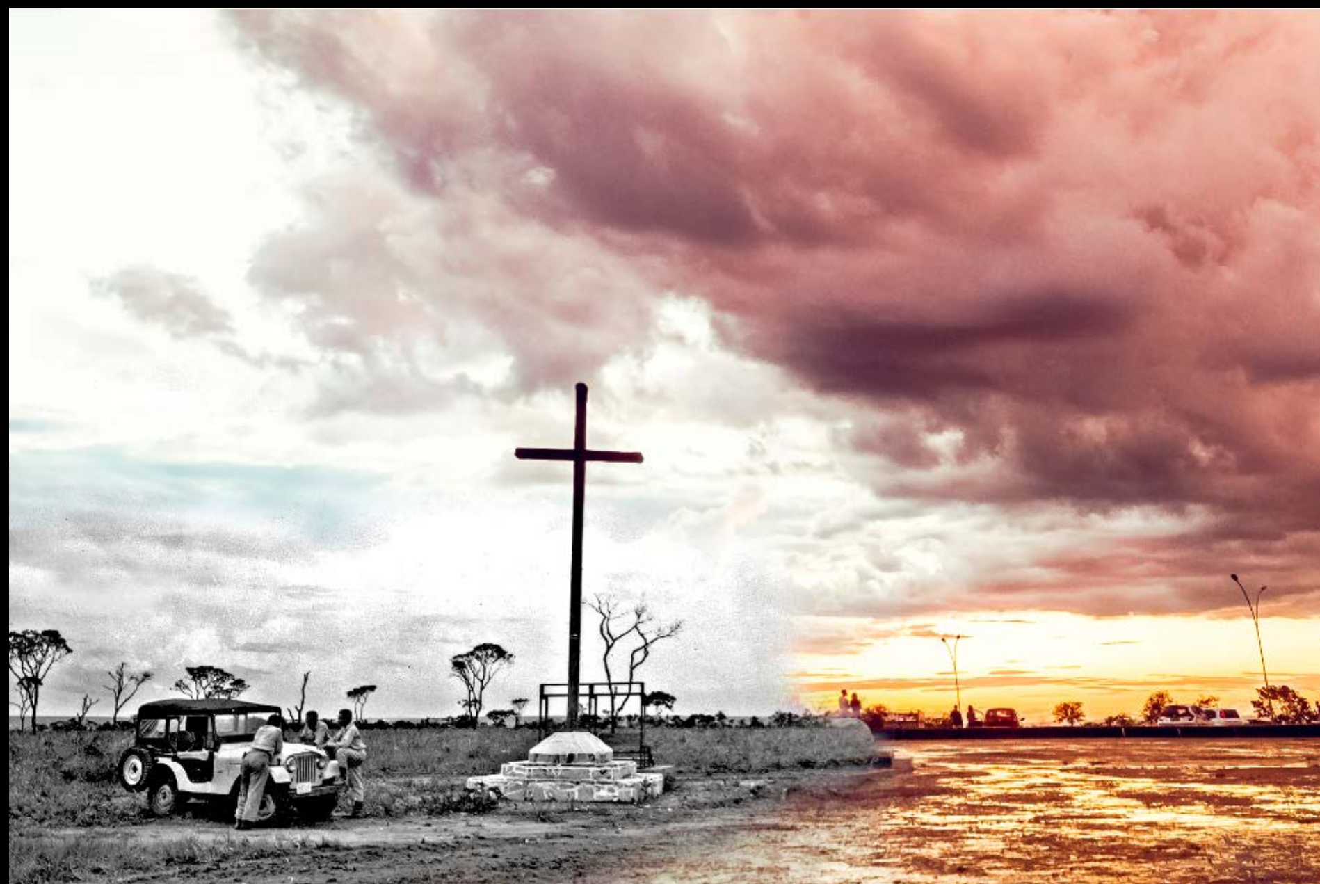
PIONEIROS NA PRAÇA DO CRUZEIRO FOTOGRAFIA 18