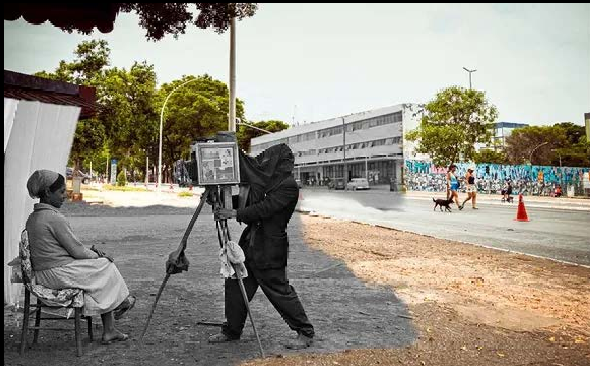
LAMBE-LAMBE NA 707/708 SUL FOTOGRAFIA 11