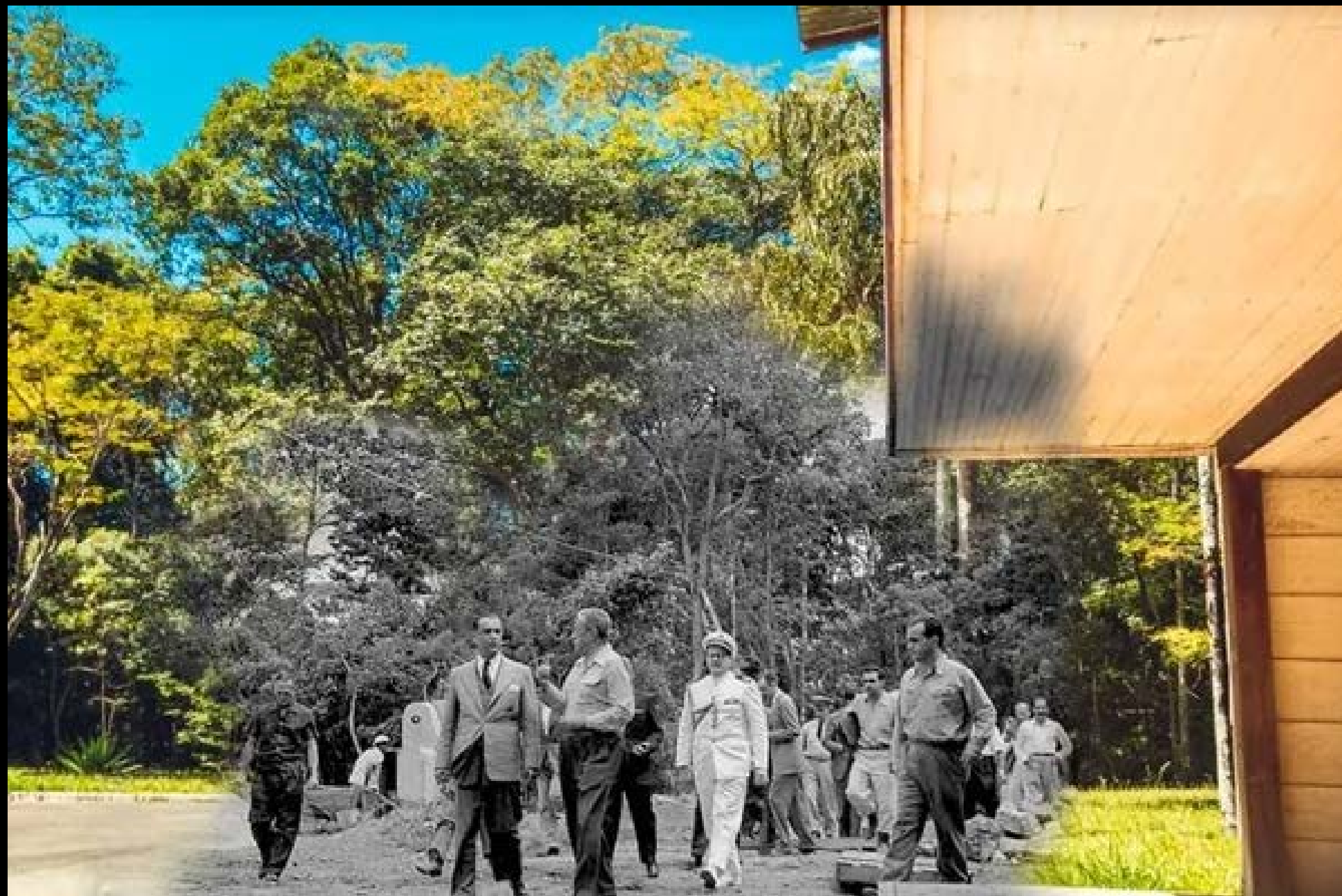
CATETINHO E JK FOTOGRAFIA 02