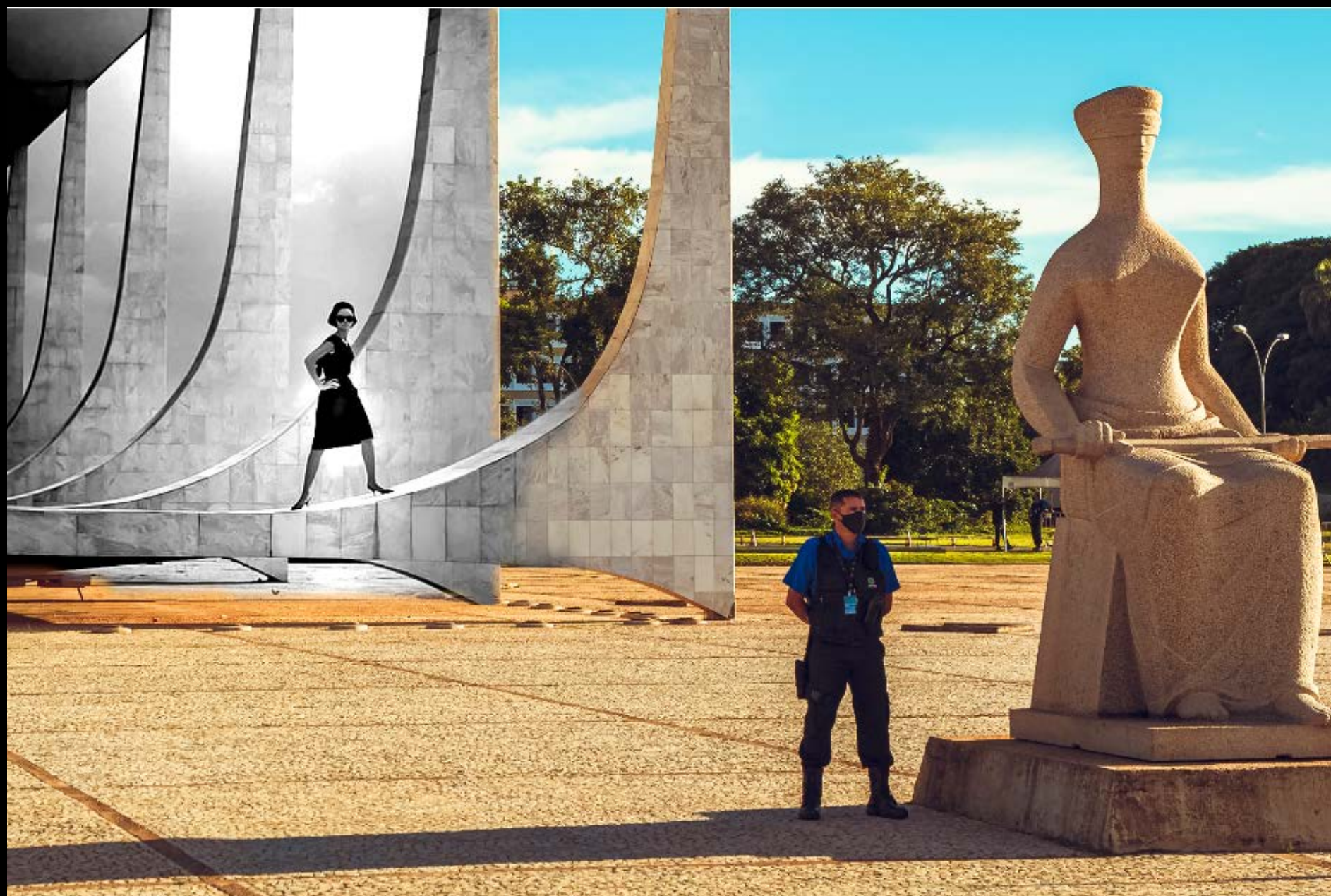
CAMPANHA PUBLICITÁRIA DE MODA, REVISTA MANCHETE, NO STF FOTOGRAFIA 40