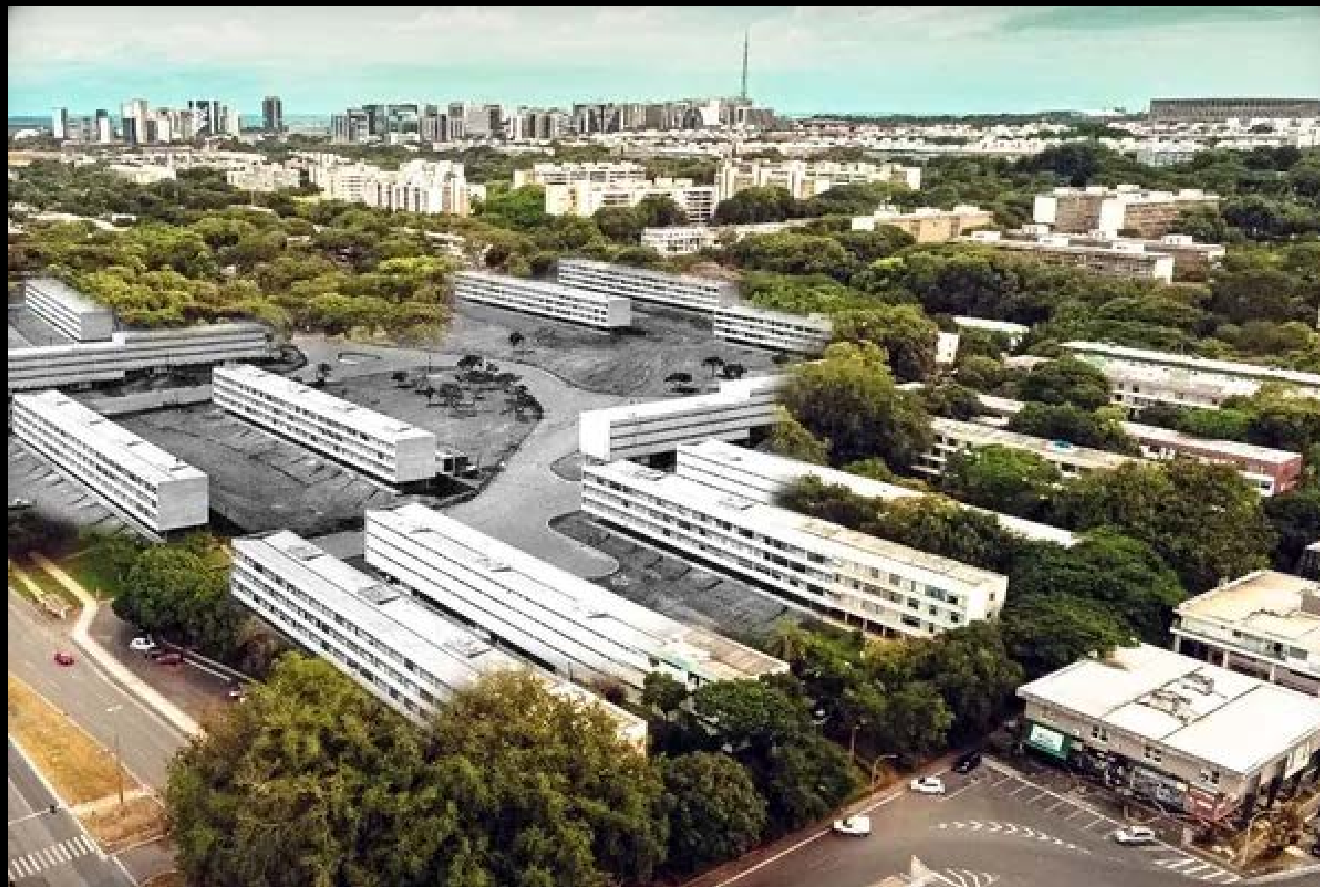
VISTA AÉREA DA SQN 416 FOTOGRAFIA 16