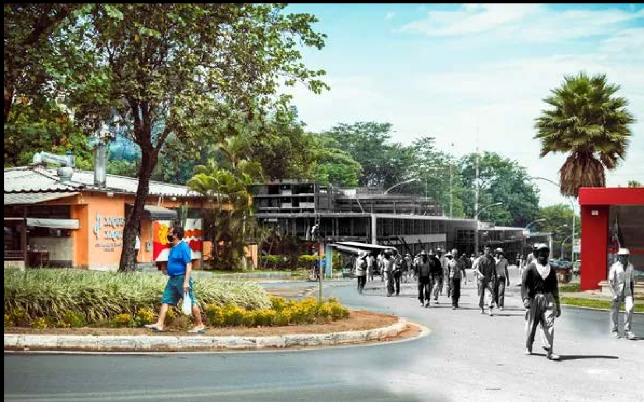
CANDANGOS SAINDO DO TRABALHO. ENTREQUADRA SQS 107 / 108 FOTOGRAFIA 26