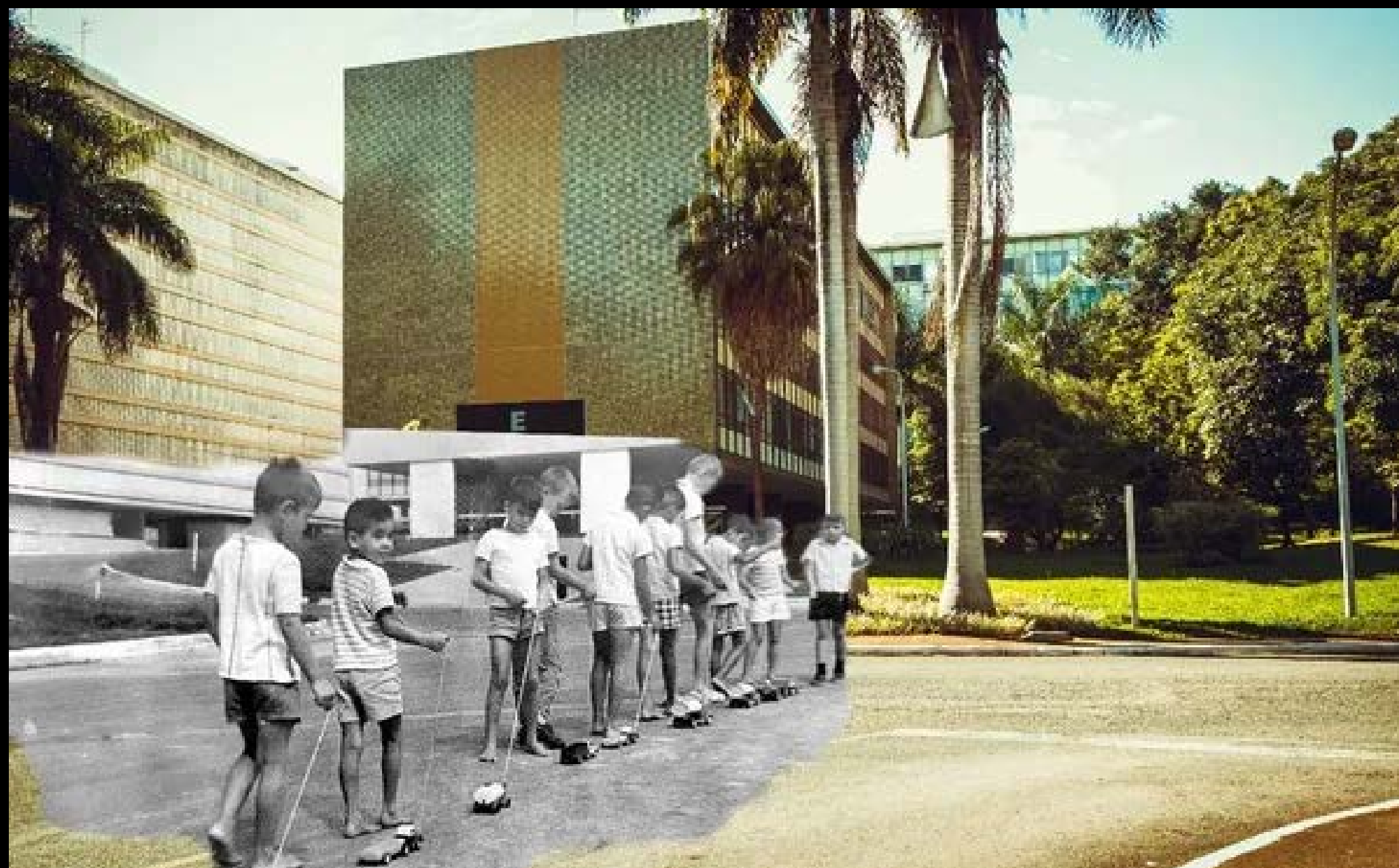
CRIANÇAS BRINCANDO NA SQS 114 FOTOGRAFIA 13