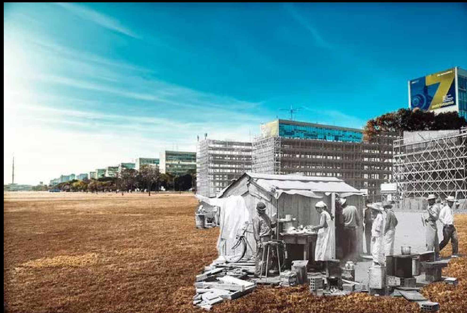
CANDANGOS NA ESPLANADA DOS MINISTÉRIOS FOTOGRAFIA 22