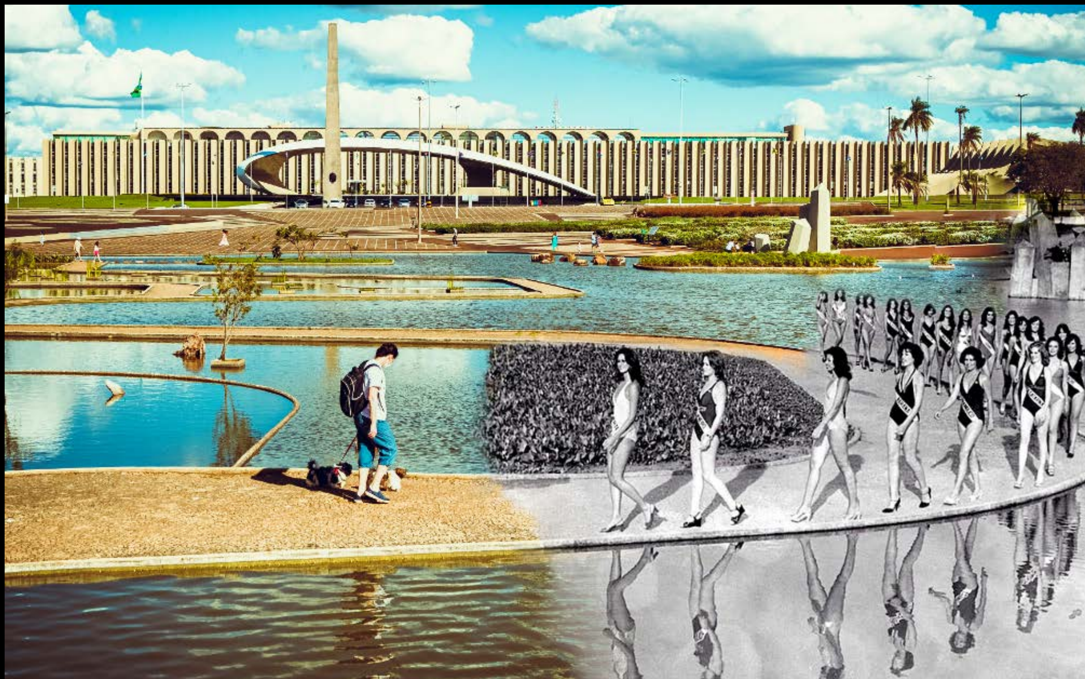
CATEDRAL METROPOLITANA DE BRASÍLIA FOTOGRAFIA 41