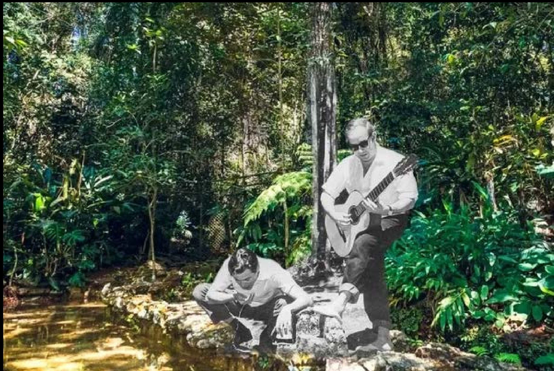
ÁGUA DE BEBER FOTOGRAFIA 05