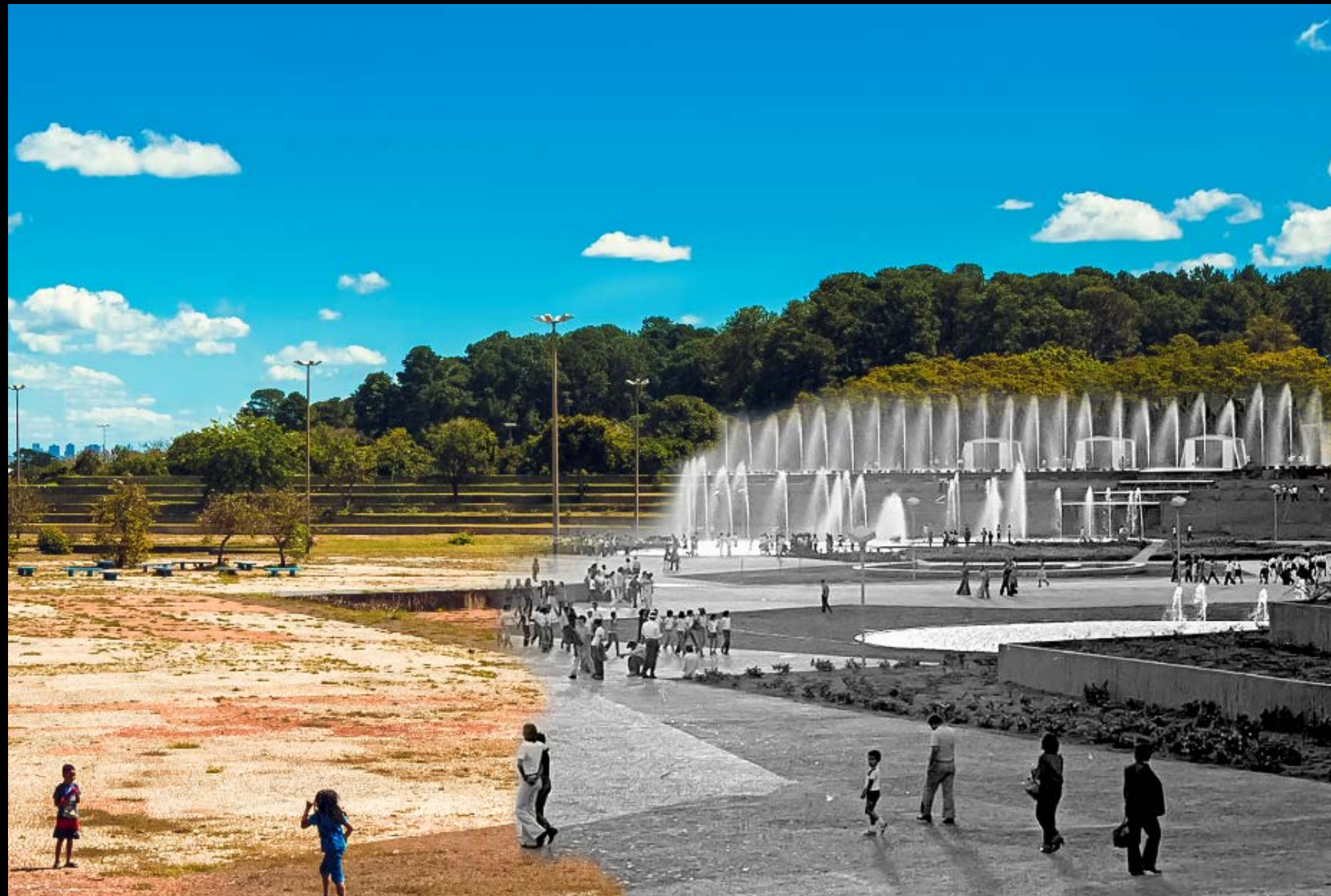
PRAÇA DAS FONTES NO PARQUE DA CIDADE FOTOGRAFIA 35