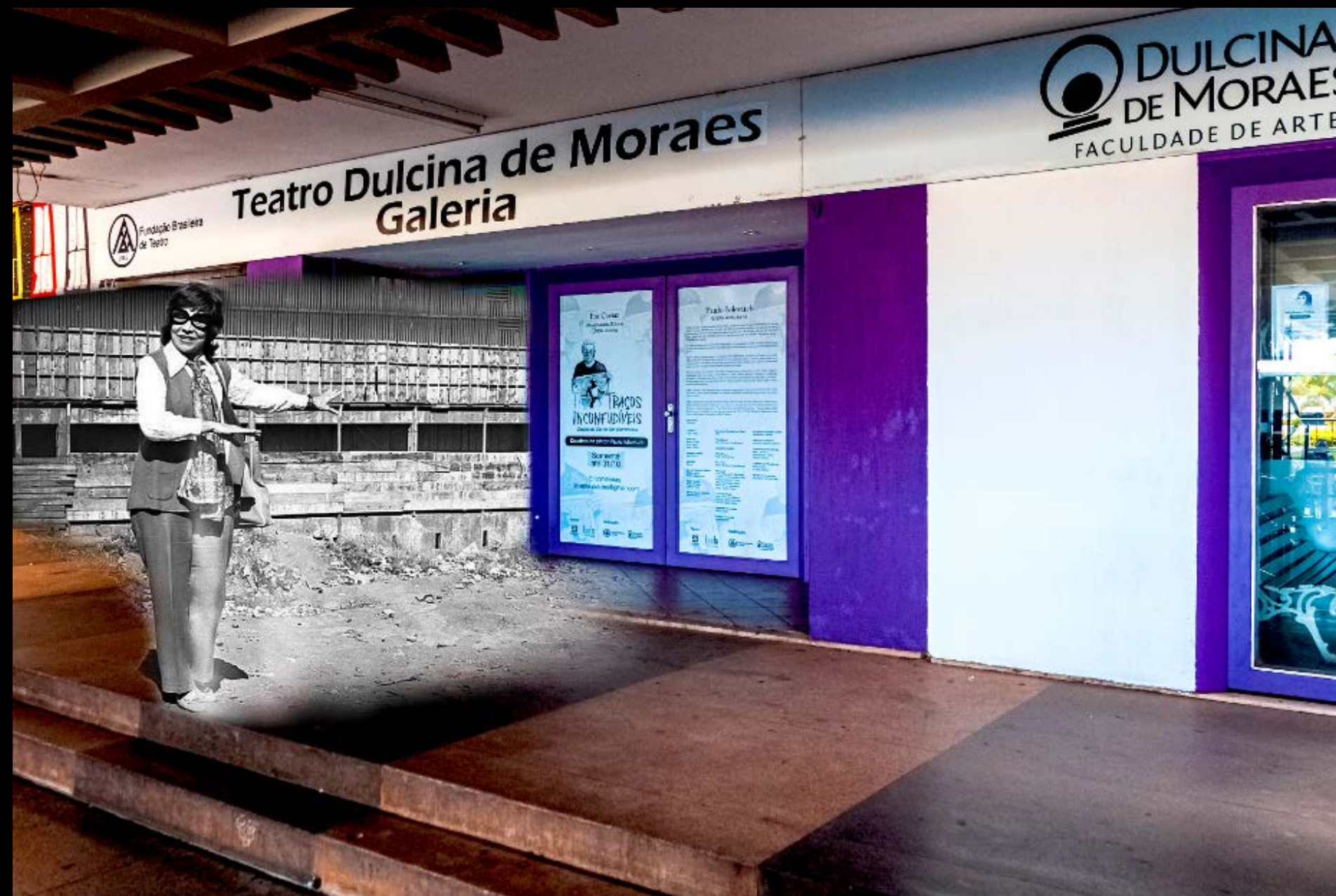
DULCINA DE MORAES EM FRENTE A FUTURA FACULDADE DE ARTES FOTOGRAFIA 42