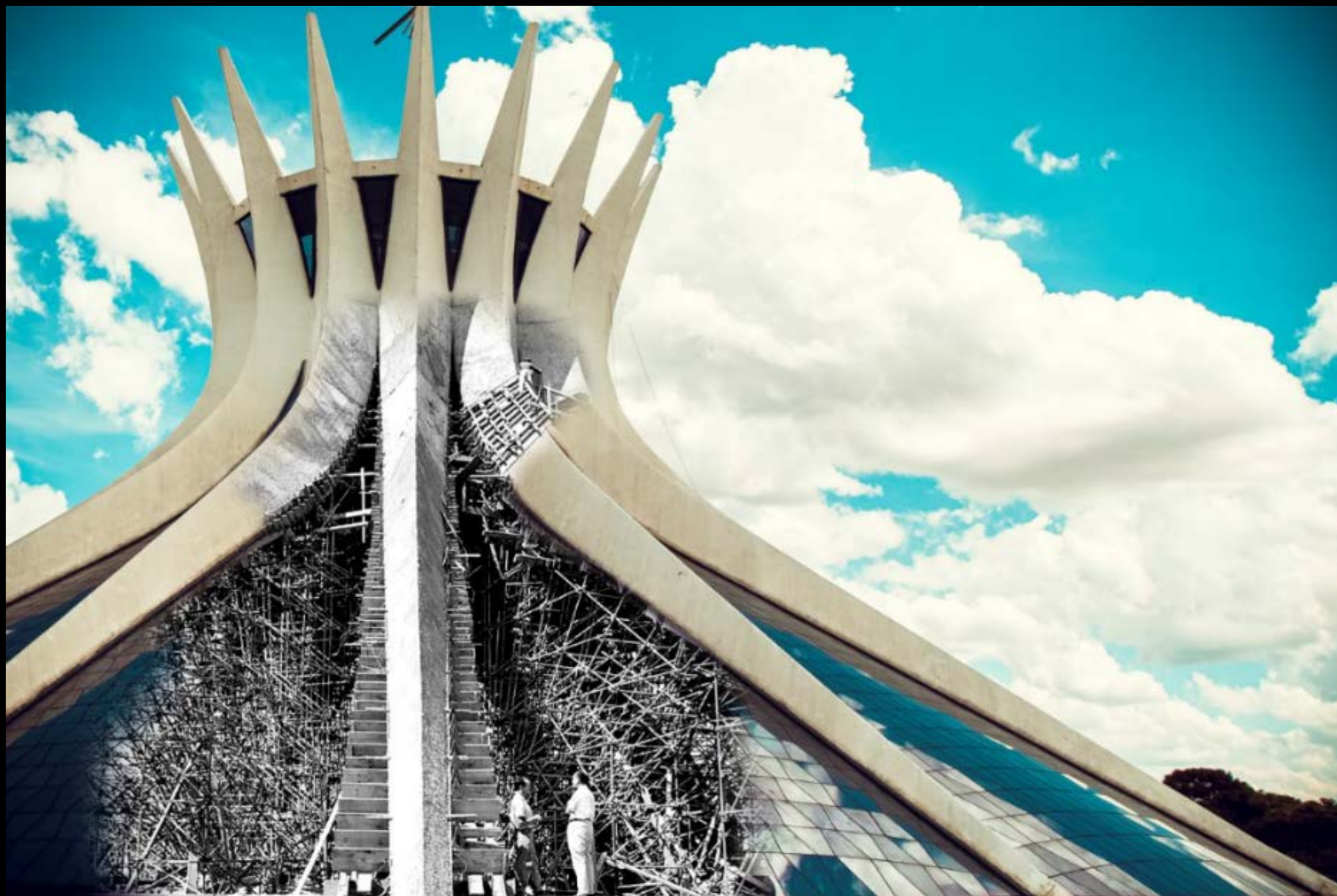
CATEDRAL METROPOLITANA DE BRASÍLIA FOTOGRAFIA 45