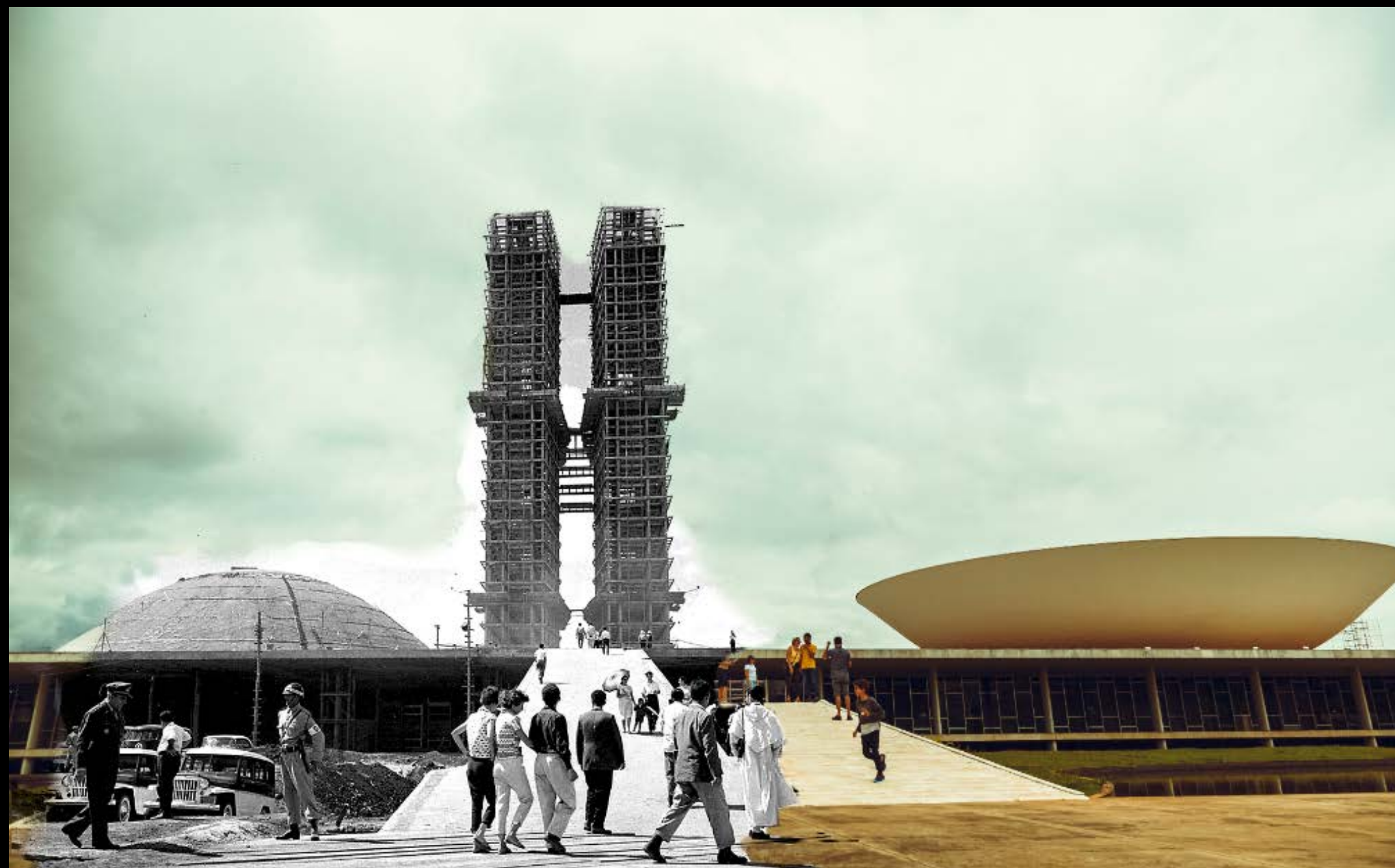
VISITANTES NA RAMPA DO CONGRESSO NACIONAL FOTOGRAFIA 29