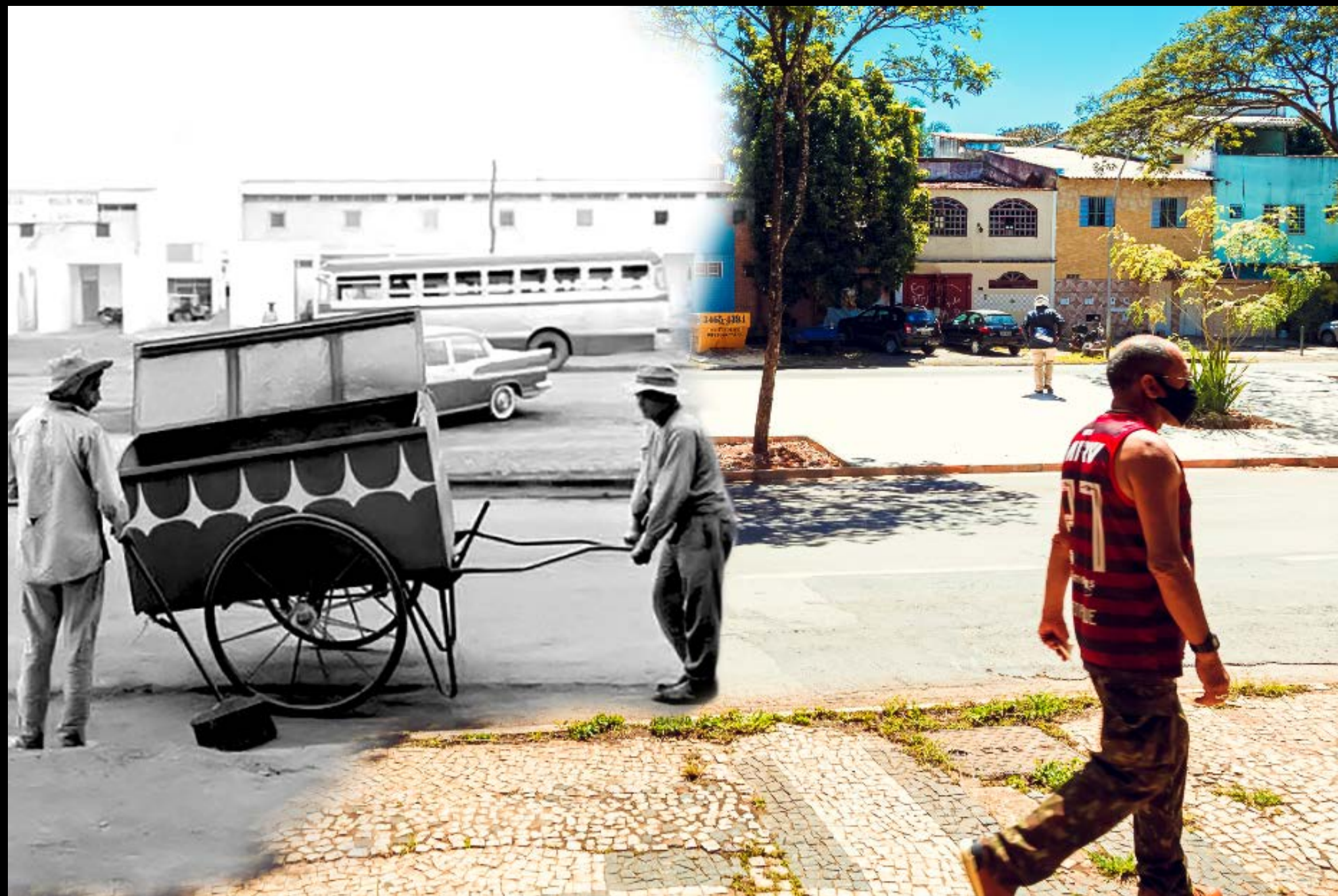
SISTEMA DE COLETA DE LIXO NA W3 SUL FOTOGRAFIA 38