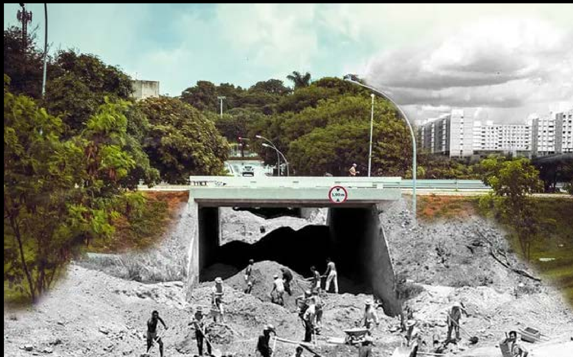
CONSTRUÇÃO DA TESOURINHA DA SQN 211/212 FOTOGRAFIA 19