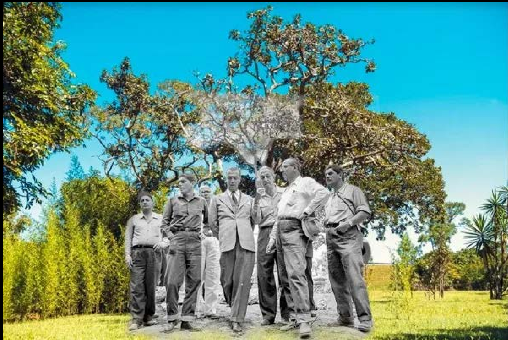
JK FOTOGRAFIA 07