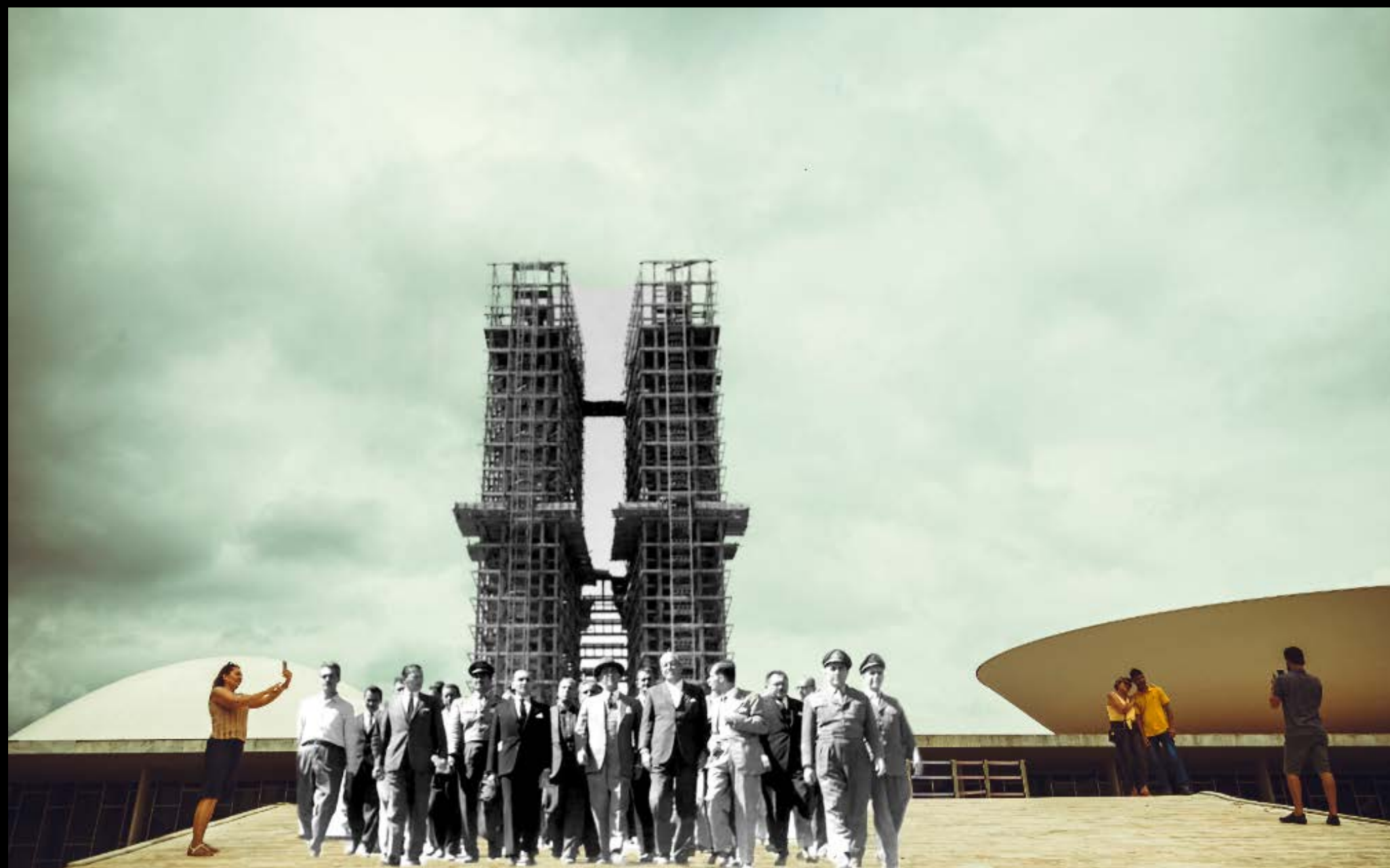
VISITANTES NA RAMPA DO CONGRESSO NACIONAL FOTOGRAFIA 30