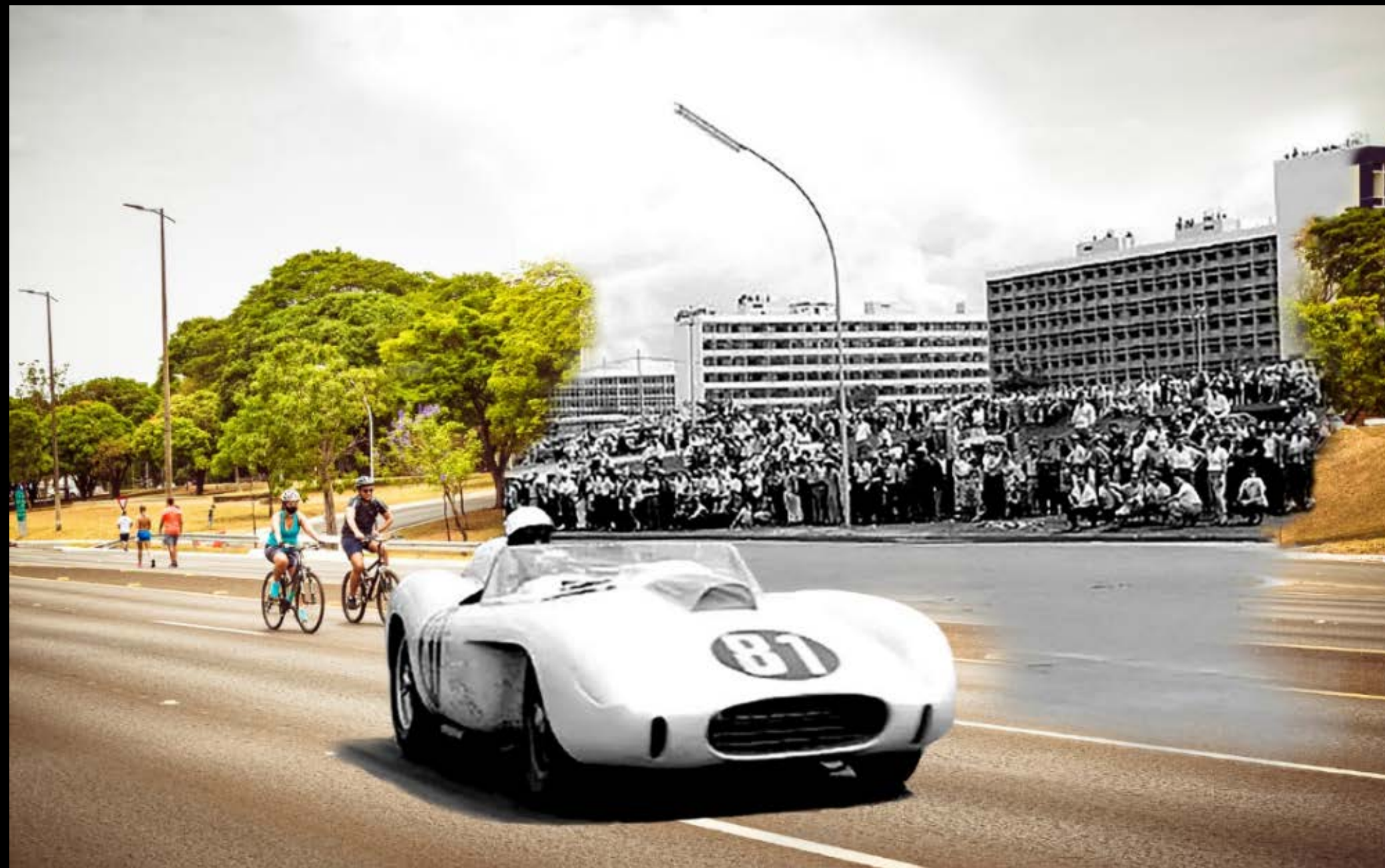
CORRIDA COMEMORATIVA DA INAUGURAÇÃO DE BRASÍLIA, SQS 106 AO FUNDO FOTOGRAFIA 43