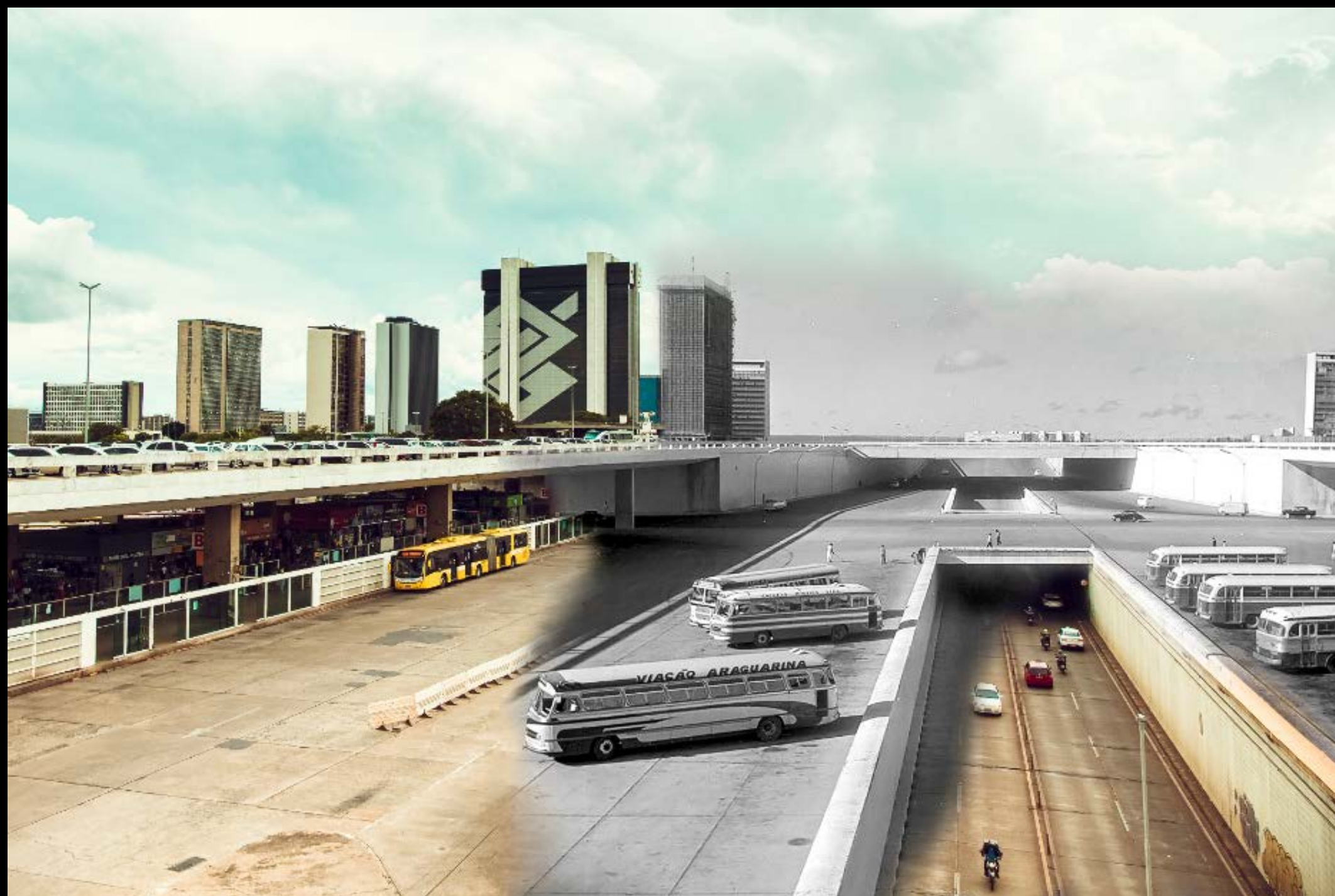
RODOVIÁRIA DE BRASÍLIA FOTOGRAFIA 32