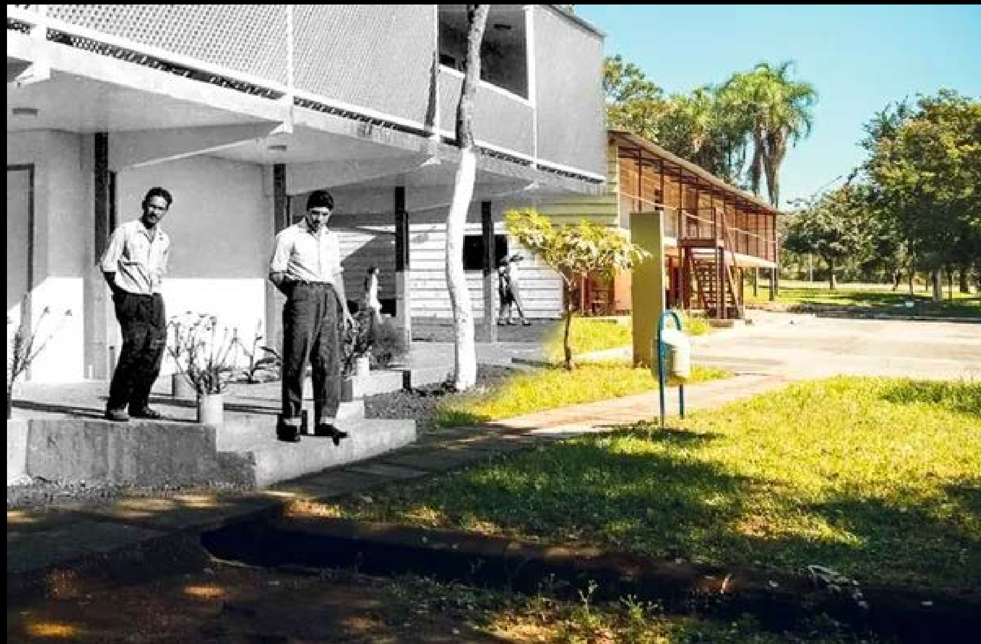
CATETINHO FOTOGRAFIA 08