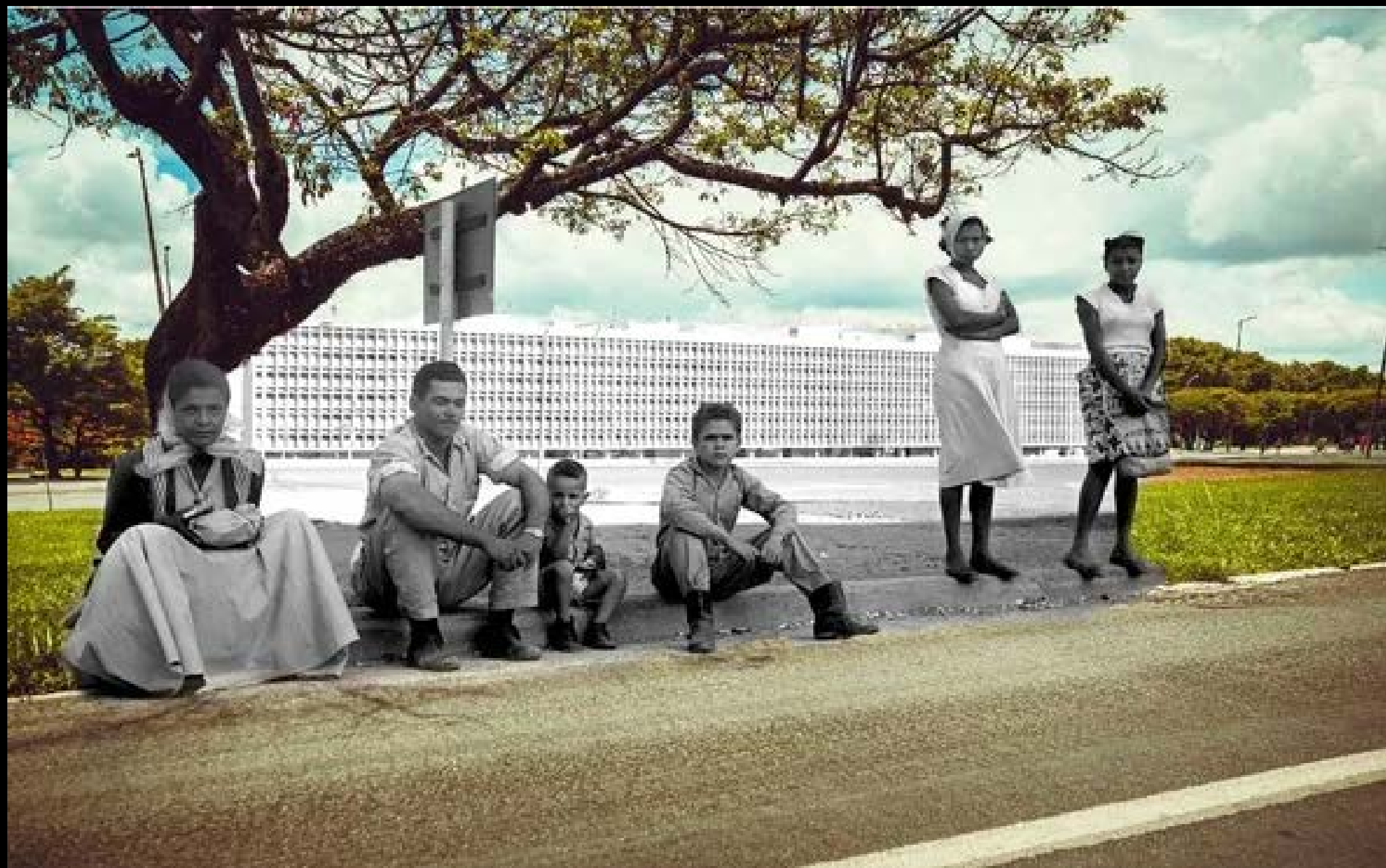
CANDANGOS NA PARADA DE ÔNIBUS107 SUL FOTOGRAFIA 14