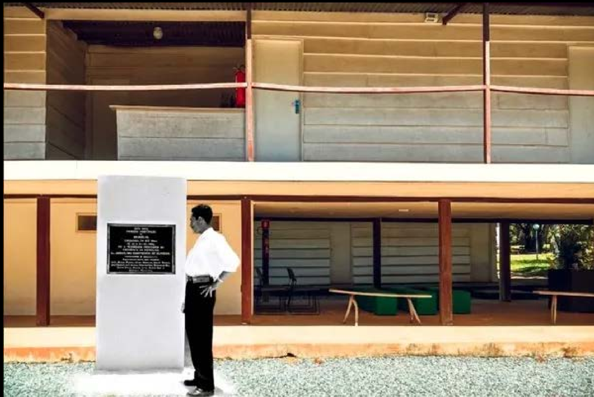
CATETINHO FOTOGRAFIA 01