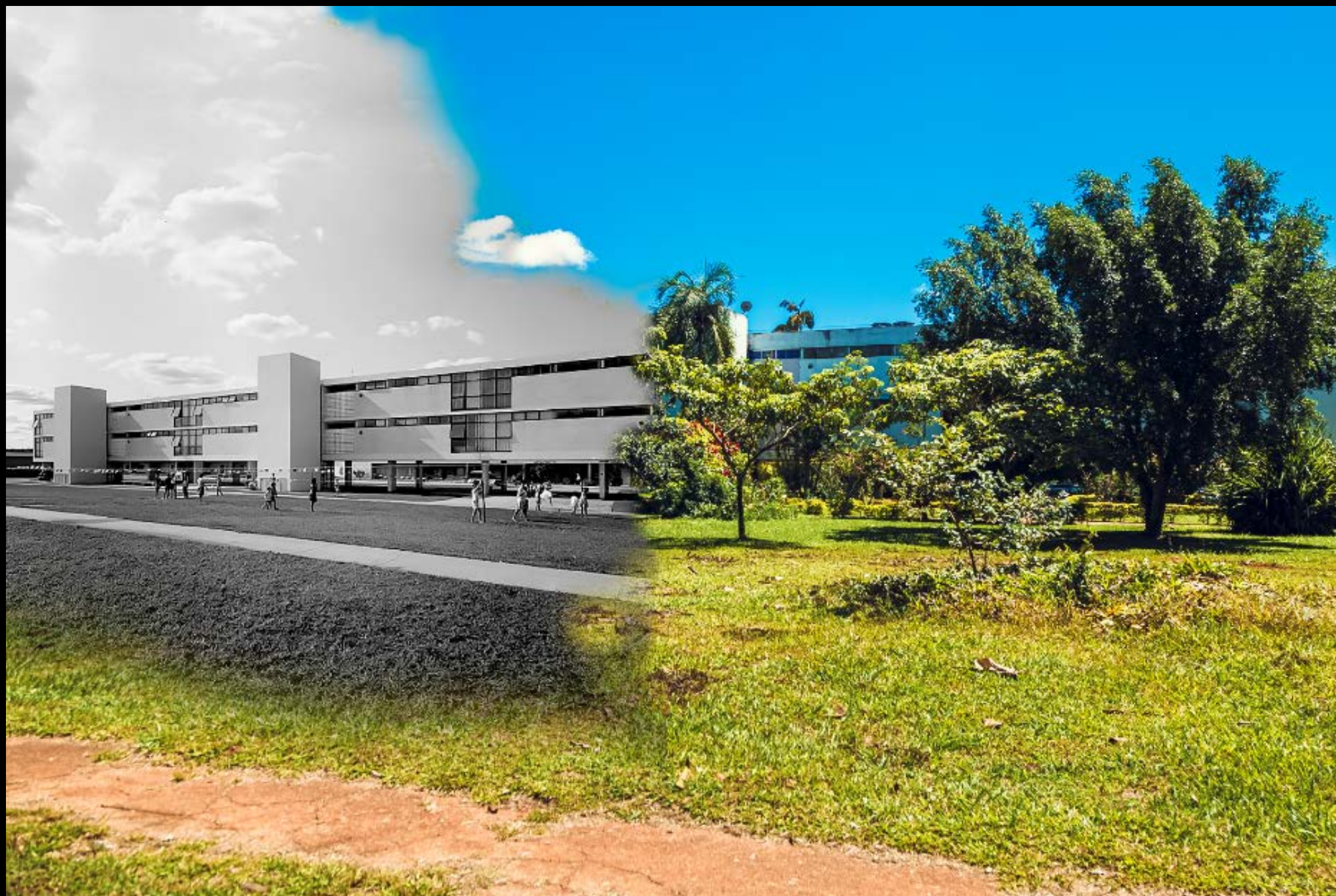
W3 SUL, 714 SUL FOTOGRAFIA 36