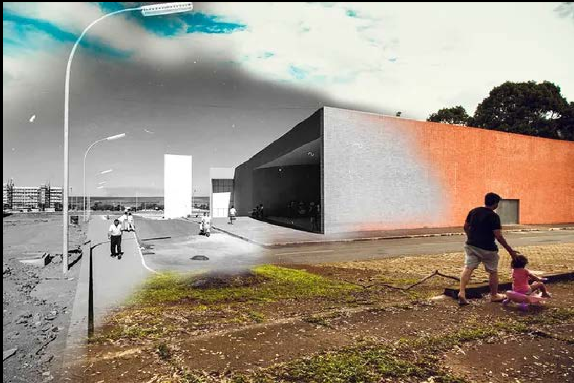
CINE BRASÍLIA FOTOGRAFIA 24