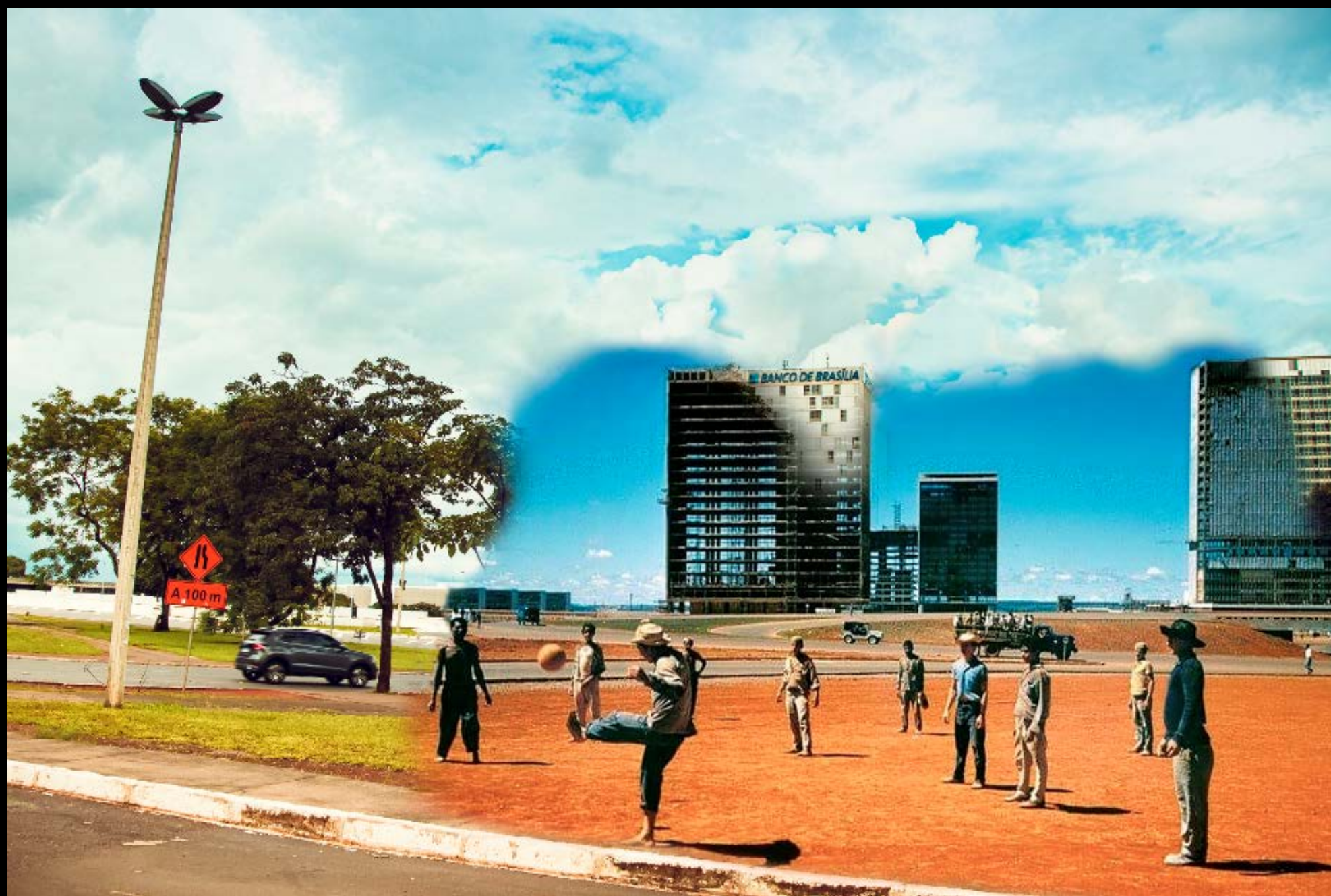
CANDANGOS JOGANDO NO SCS FOTOGRAFIA 34