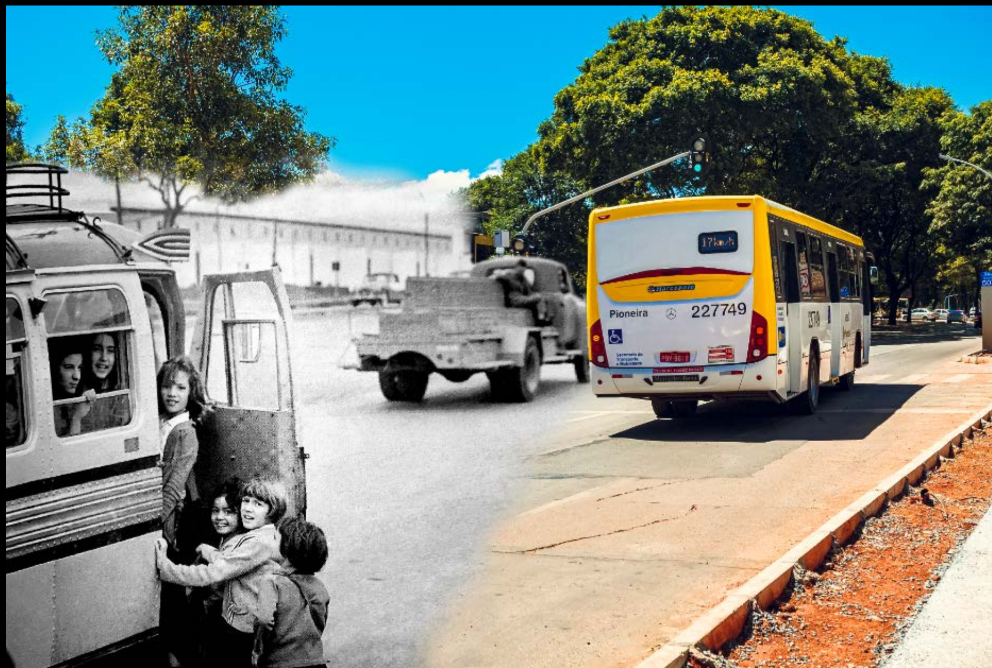
TRANSPORTE ESCOLAR NA W3 SUL, ANOS 60 FOTOGRAFIA 37