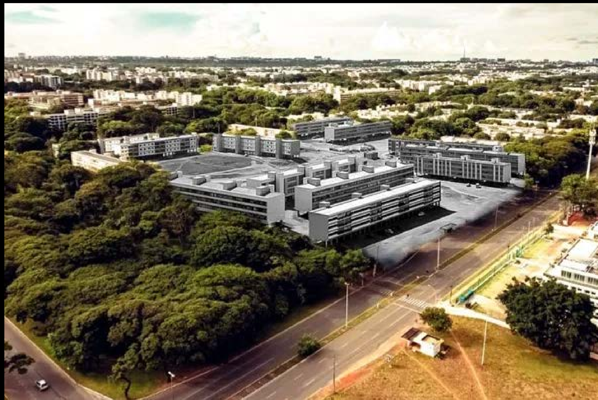
VISTA AÉREA DA SQS 416 FOTOGRAFIA 15