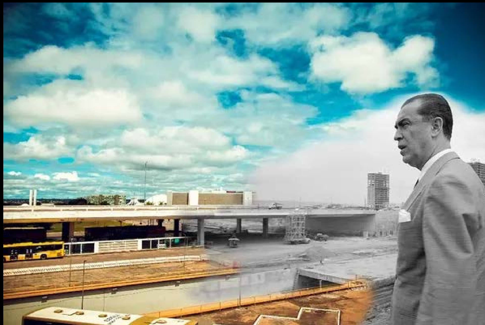
JK OBSERVANDO A CONSTRUÇÃO FOTOGRAFIA 09