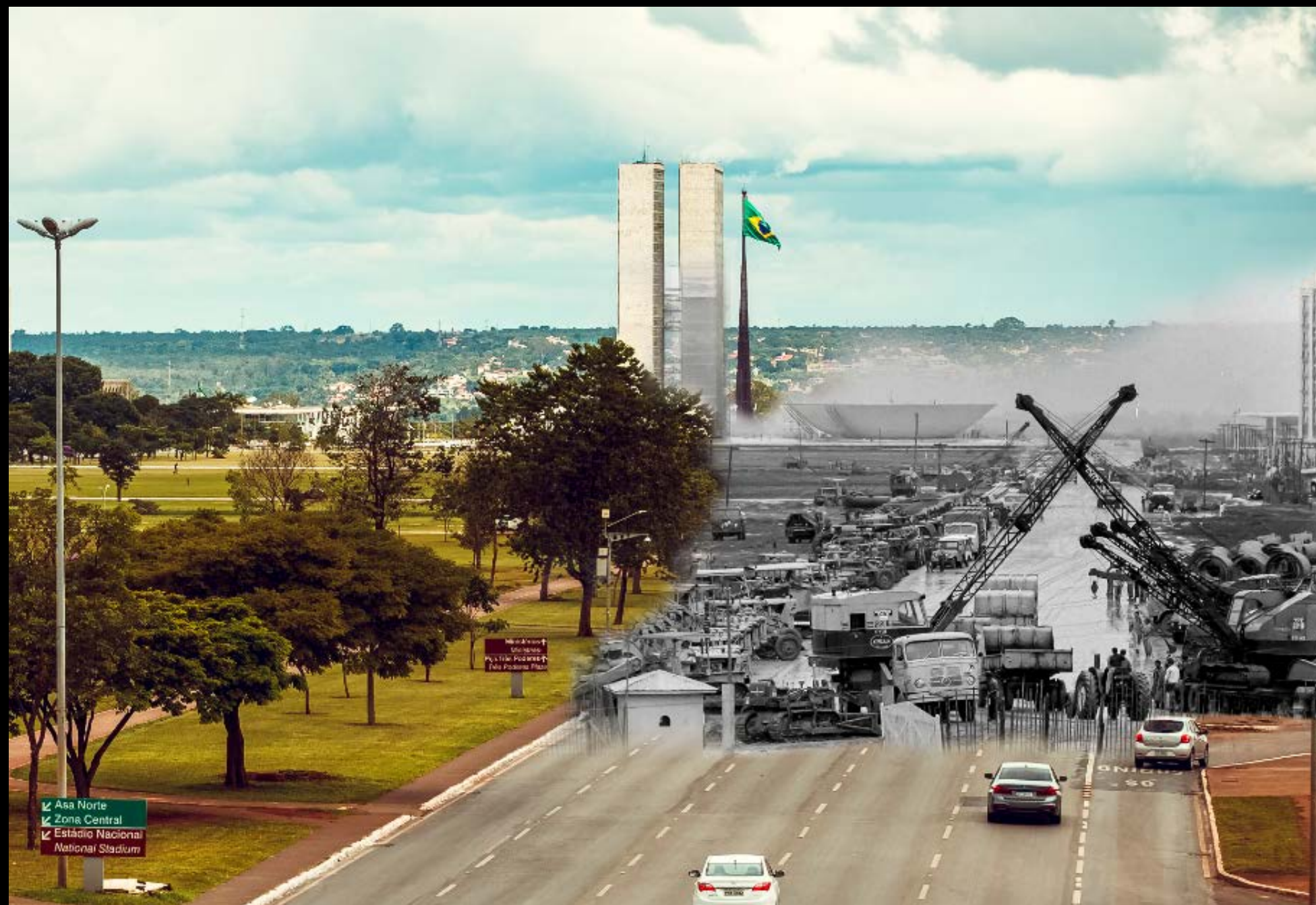
CONSTRUÇÃO ESPLANADA DOS MINISTÉRIOS FOTOGRAFIA 33