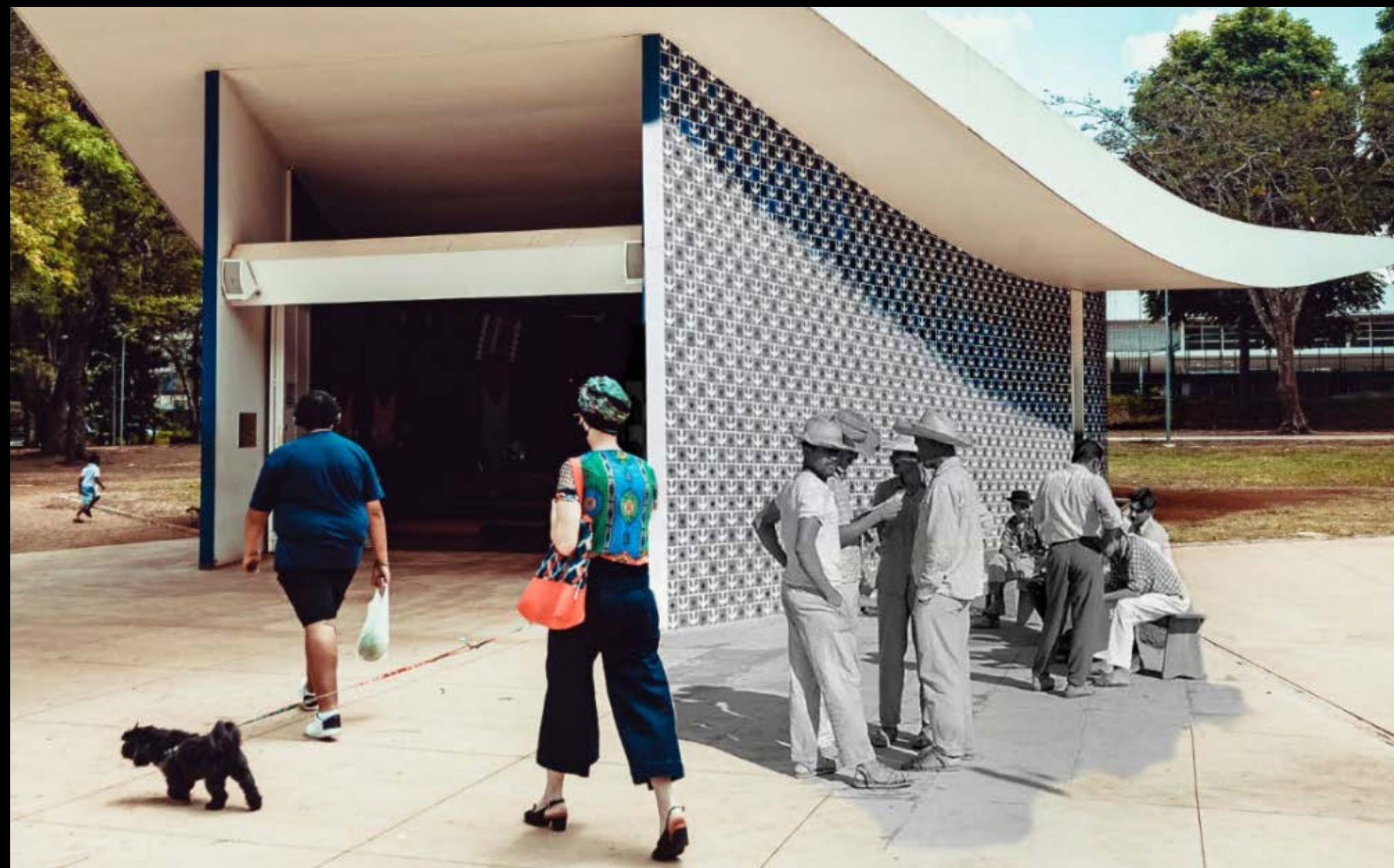
IGREJINHA NOSSA SENHORA DE FÁTIMA 307/308 SUL FOTOGRAFIA 44