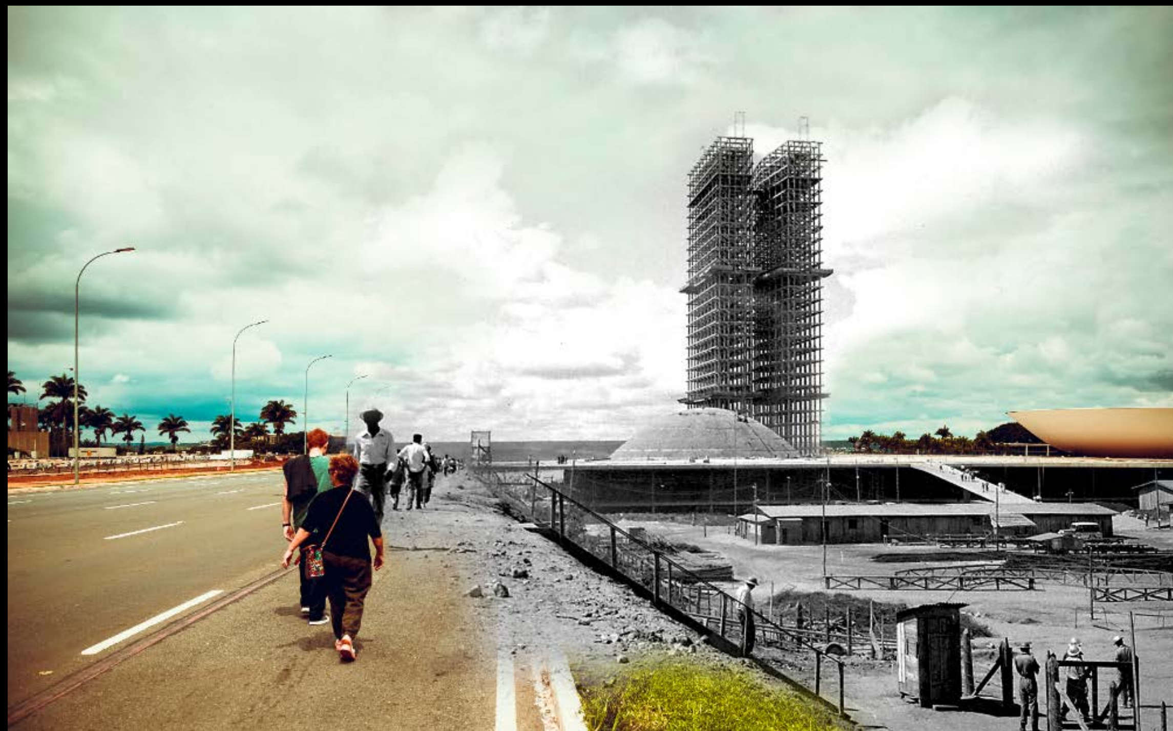
CANDANGOS TRABALHANDO NA CONSTRUÇÃO DO CONGRESSO NACIONAL FOTOGRAFIA 46