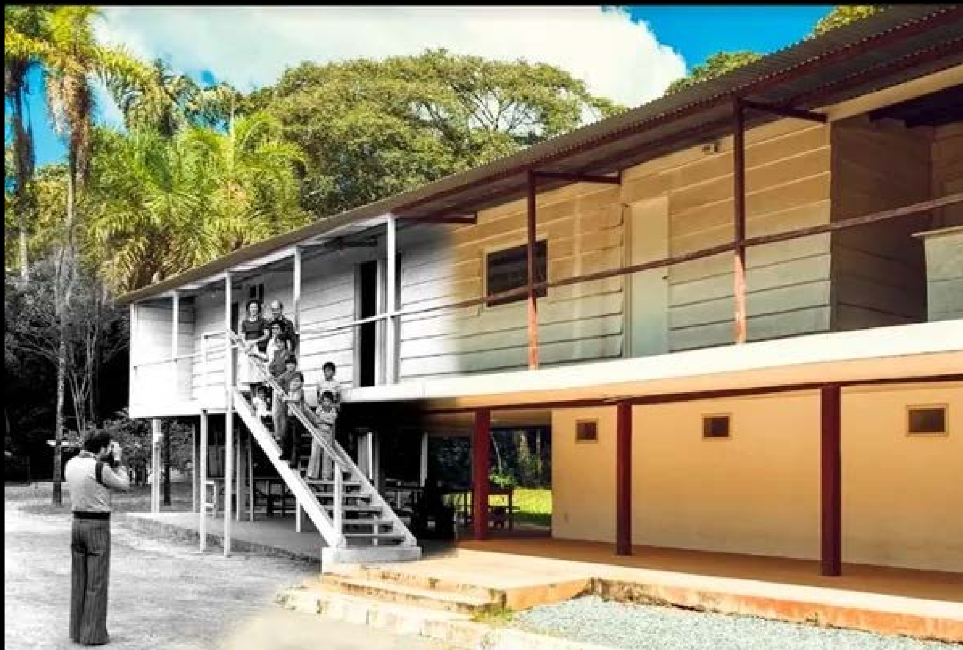
CATETINHO FOTOGRAFIA 04