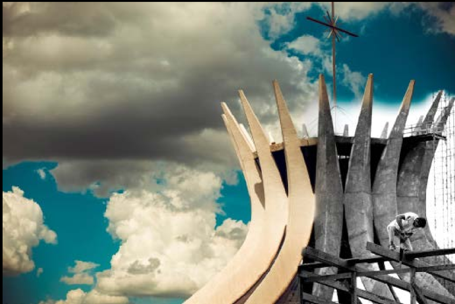
Releitura Candangos trabalhando na Catedral Fotografia 00