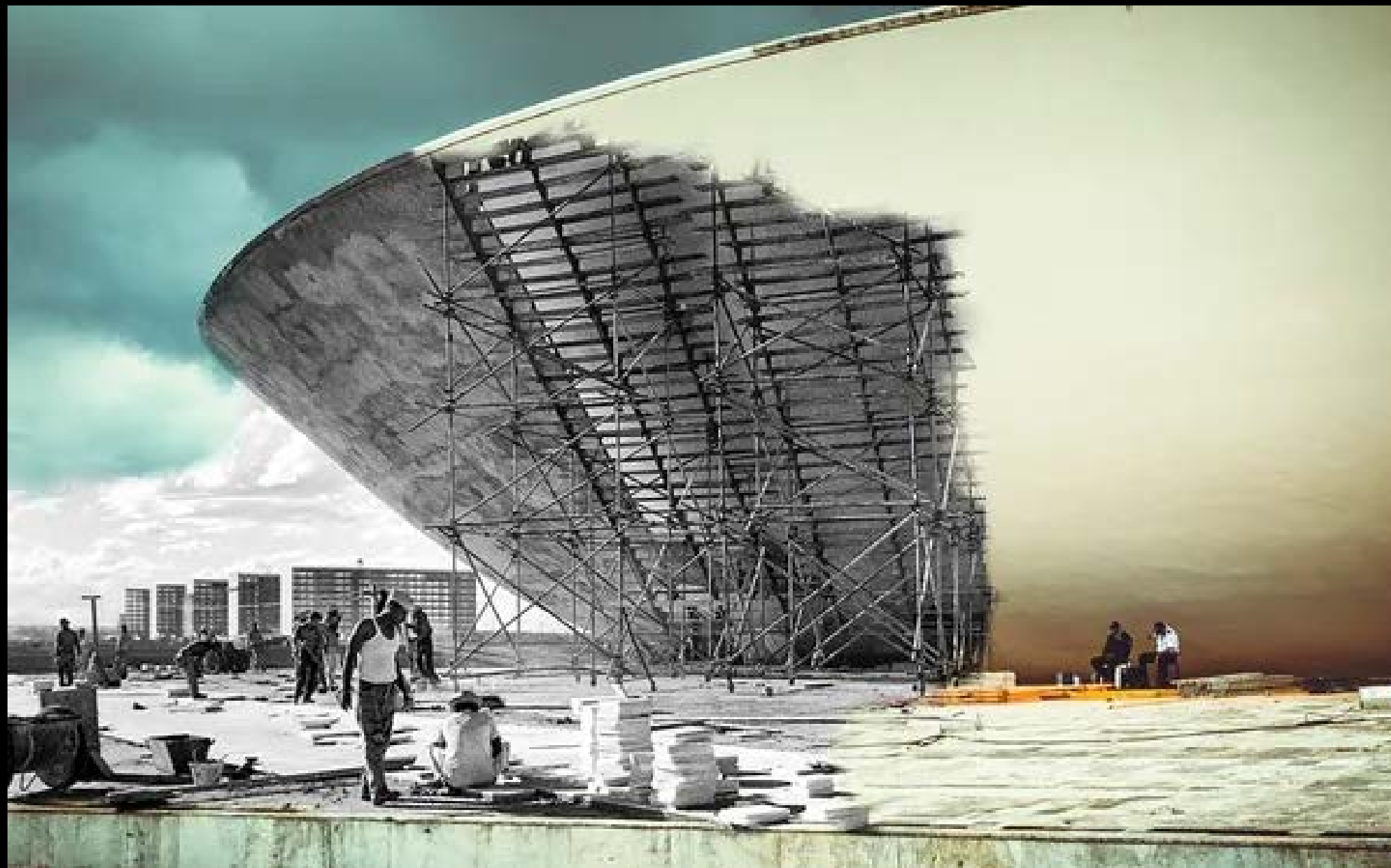
CONSTRUÇÃO DA CÂMARA DOS DEPUTADOS FOTOGRAFIA 27