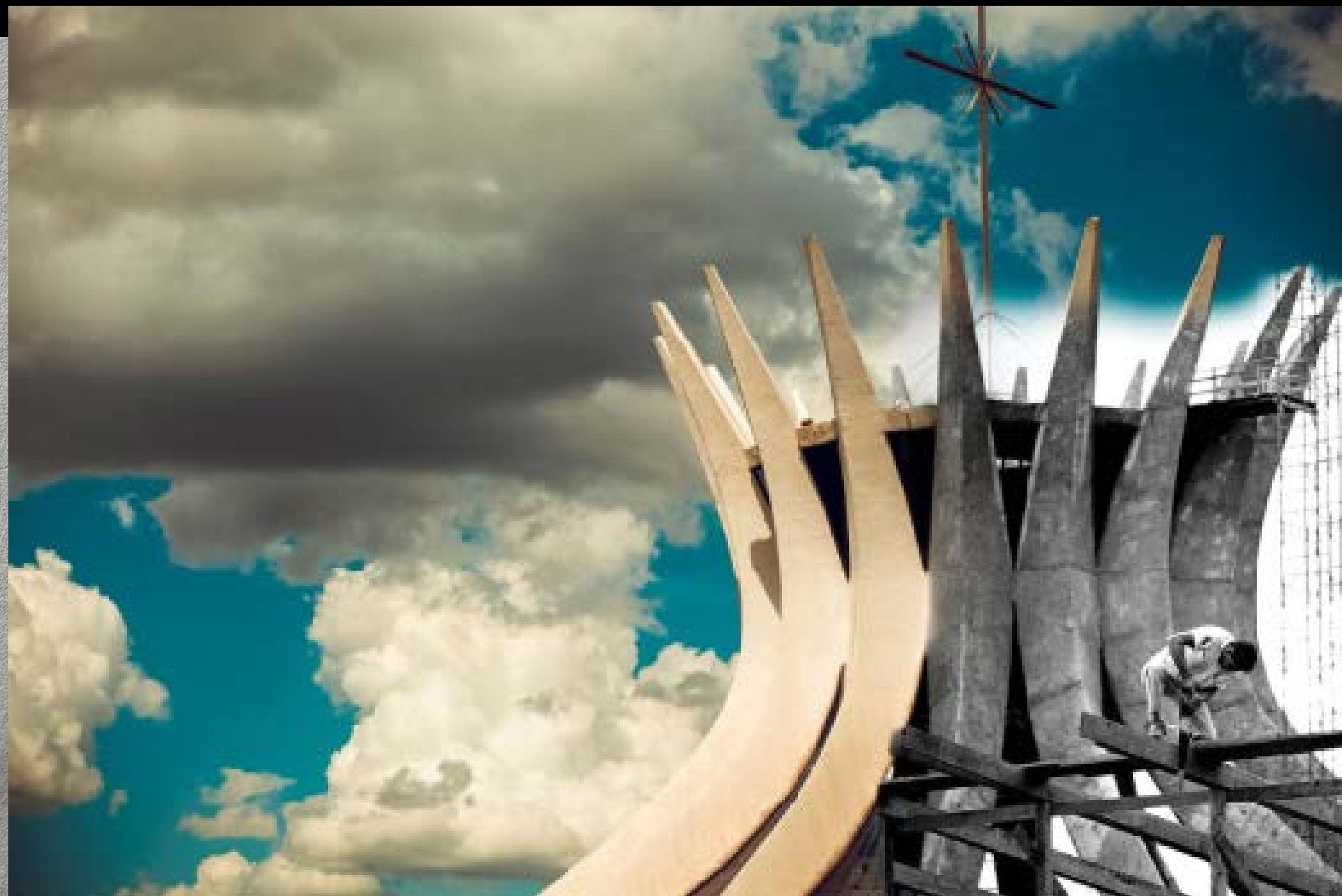
RELEITURA CANDANGOS TRABALHANDO NA CATEDRAL