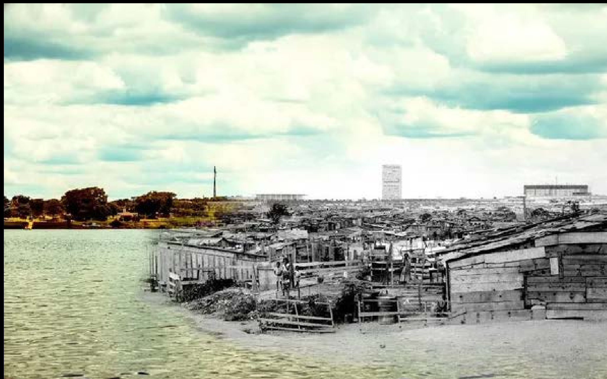
VILA AMAURY FOTOGRAFIA 10