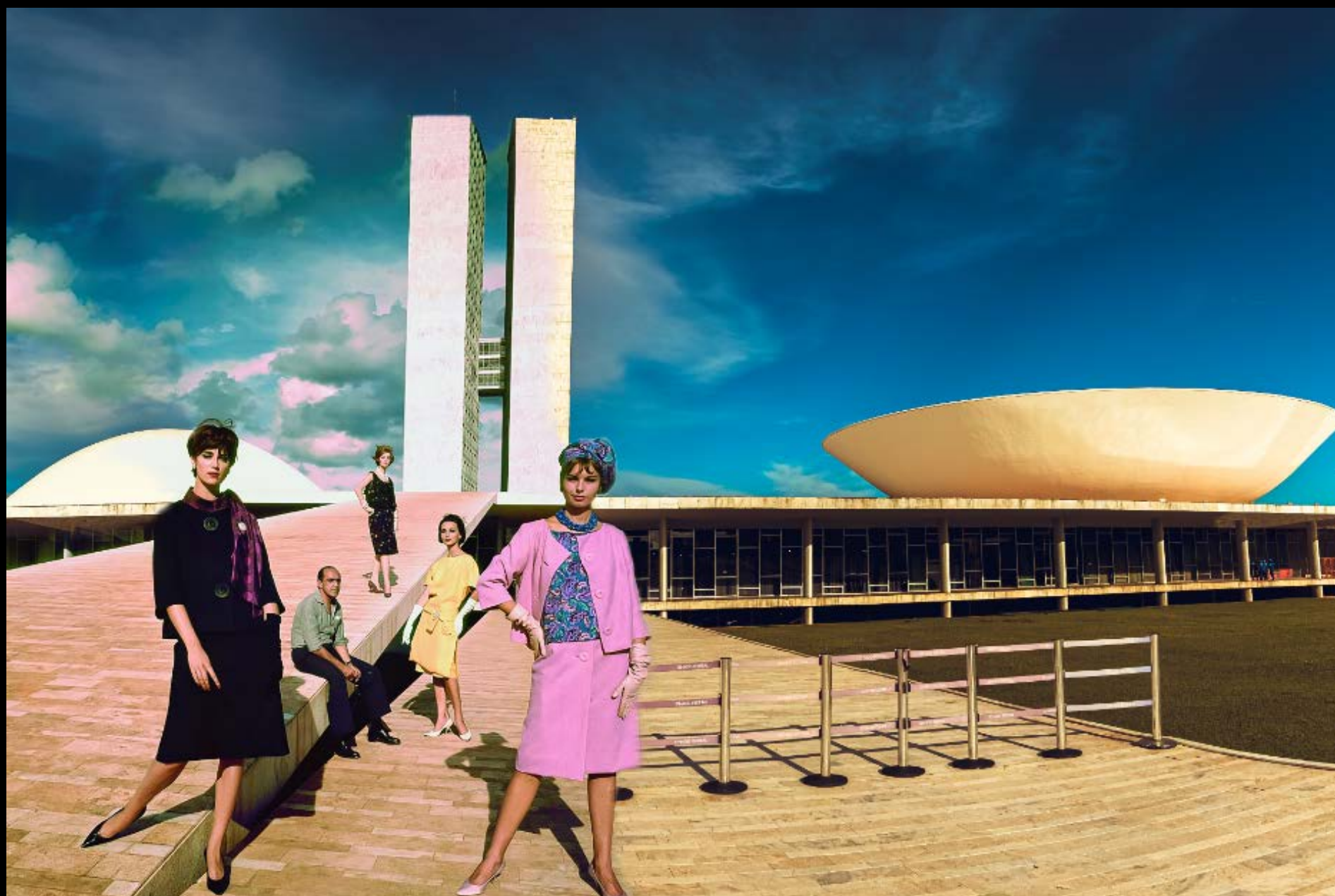
OSCAR NIEMEYER FOTOGRAFADO PARA CAMPANHA DA RHODIA FOTOGRAFIA 39