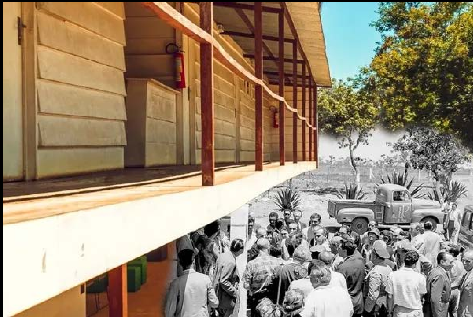
CATETINHO FOTOGRAFIA 03