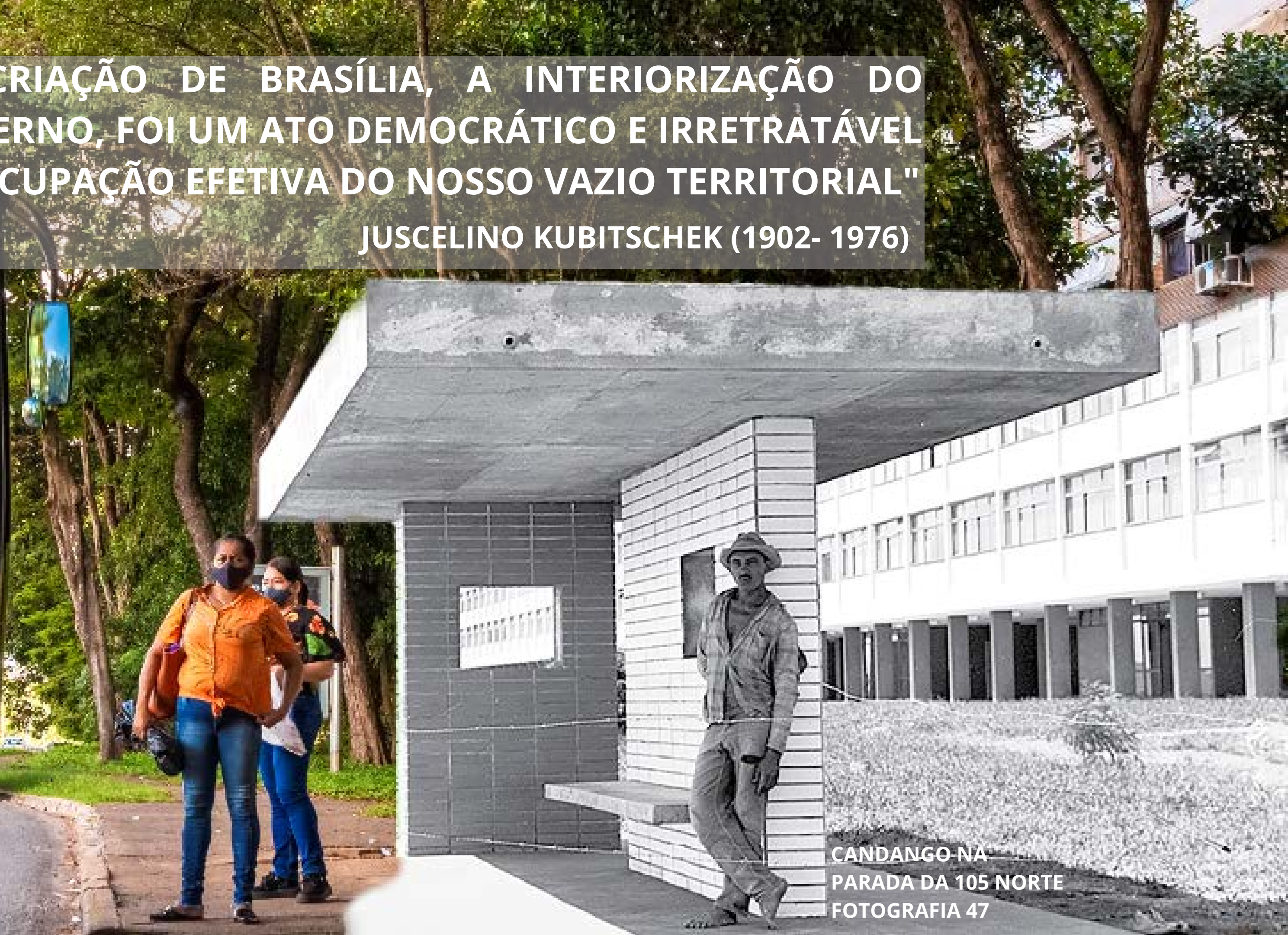
CANDANGO NA PARADA DA 105 NORTE FOTOGRAFIA 47