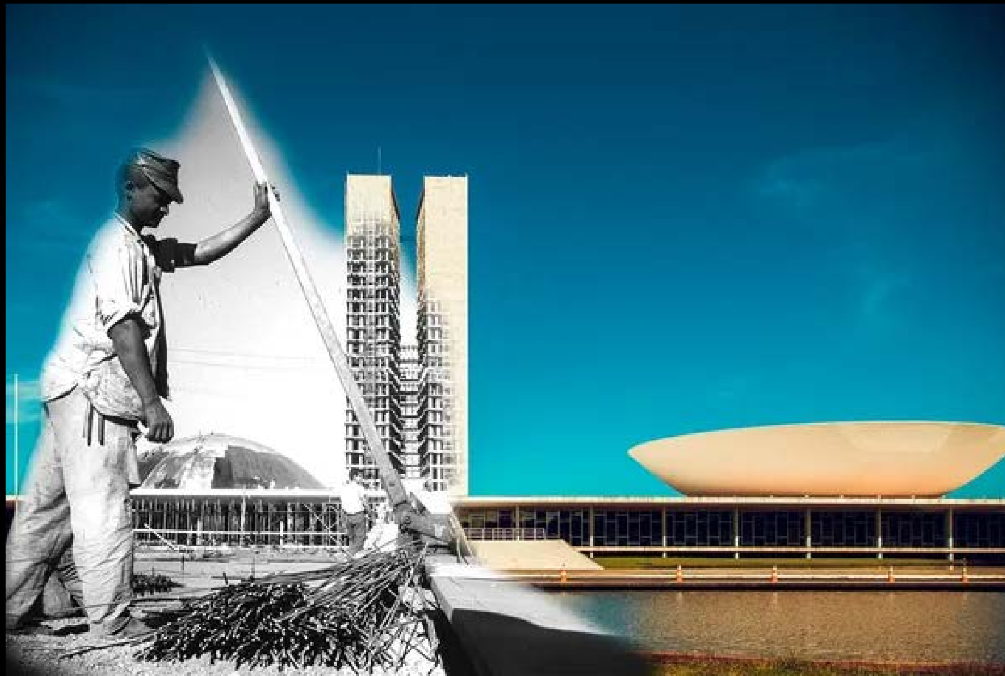
CANDANGO NA CONSTRUÇÃO DO CONGRESSO NACIONAL FOTOGRAFIA 28