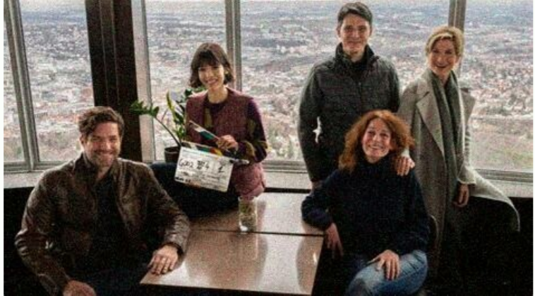
Die Besetzung der SOKO Stuttgart

Becker hat Berrenrieds Existenz vernichtet und sich letztendlich auch noch dessen Hof unter den Nagel gerissen. War es die Rache des gedemütigten Nachbarn? In einem Seniorenstift der Oberklasse stirbt nachts überraschend eine ältere Dame, Hedwig Lautenbacher. Alles sieht nach einem Routinefall aus: "Herzversagen" steht auf dem Totenschein. Doch als Dieter Posch, ein Verehrer der Verstorbenen, zur SOKO kommt und den Verdacht äußert, dass es sich um Mord handelt, wird die Leiche obduziert. Und tatsächlich: Hedwig ist keineswegs eines natürlichen Todes gestorben, sie wurde mit einem Kissen erstickt.