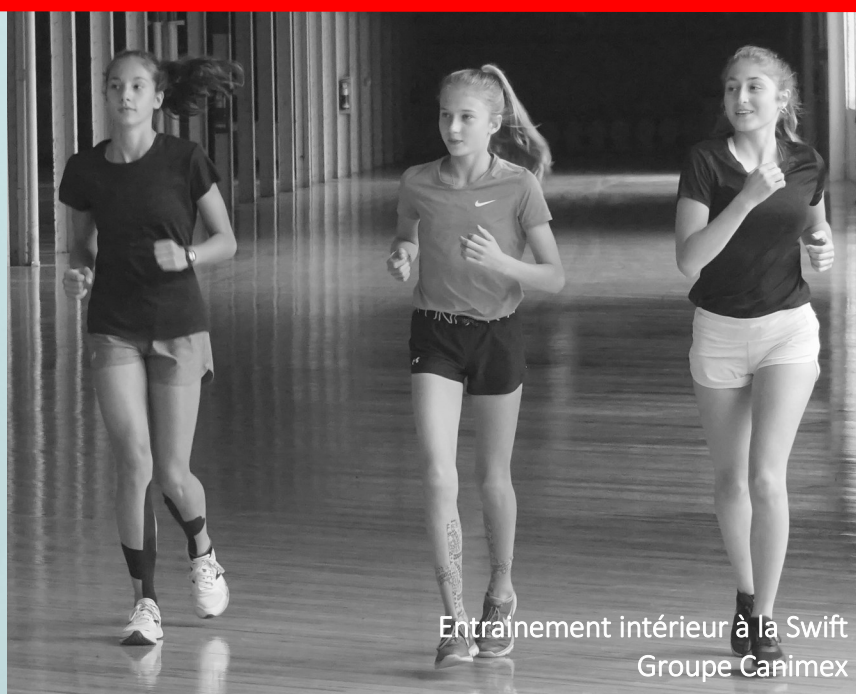
Entraînement intérieur à la Swift Groupe Canimex

Au Québec, 15 commissions scolaires offrent le programme sport-études athlétisme représentant 11 régions sur 17.