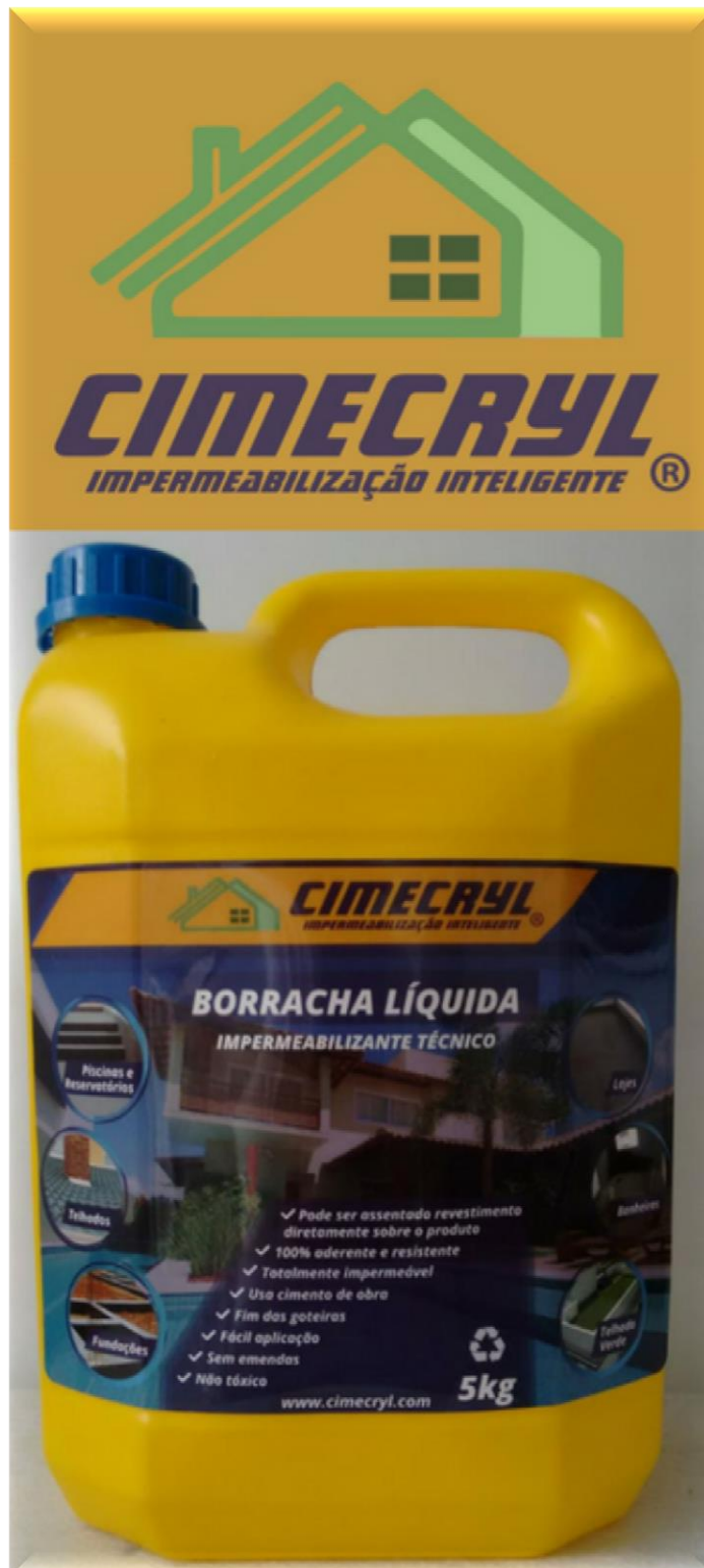
BORRACHA LÍQUIDA CIMECRYL