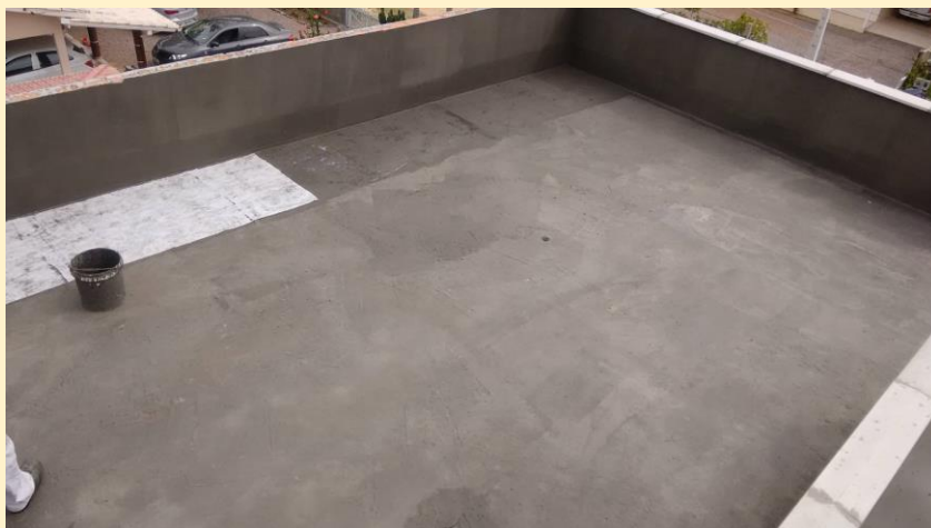
Véu de poliéster Cimecryl sendo colocado entre a primeira e segunda demão da Borracha Líquida da Cimecryl em laje que receberá telhado verde.