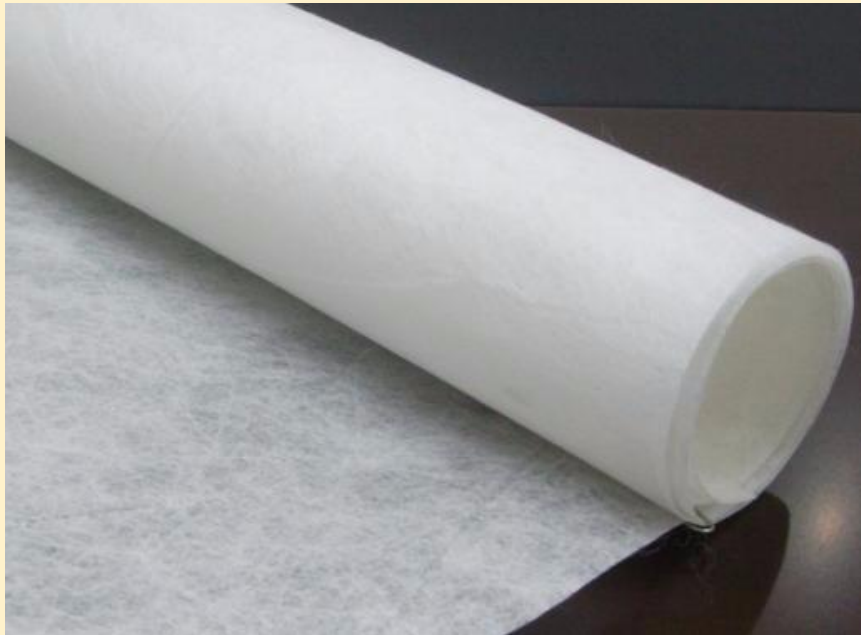
Véu de poliéster da Cimecryl