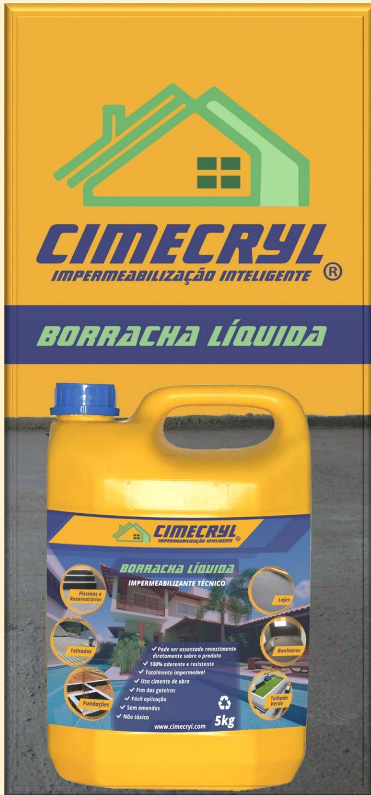
BORRACHA LÍQUIDA DA CIMECRYL