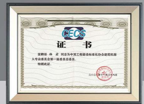
中國工程建設標準化協會 建築機器人專業委員會 委員單位