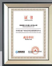
中國房地產協會智慧建築研究中心 副主任單位