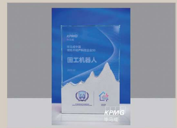
入選畢馬威中國“2023年領先不動產科技企業50”榜單