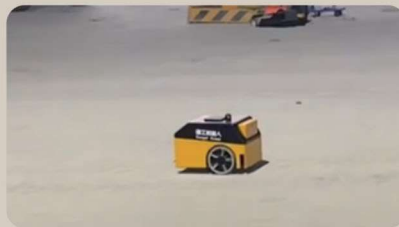
上海大歌劇院項目