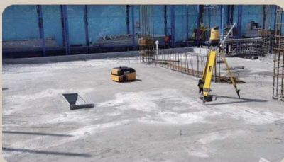
長沙城投某房建項目