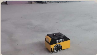
國家會議中心二期項目