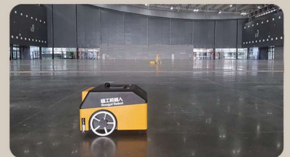
長沙國際會展中心項目