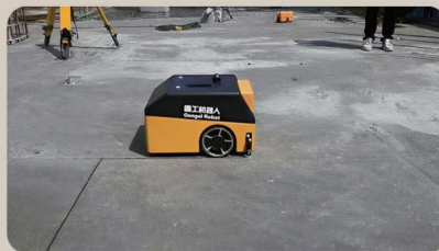
湖南高嶺建設某房建項目