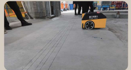
香港啓德新急癥醫院項目