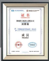
國內首部《智能建造評價標準》 主要編制單位