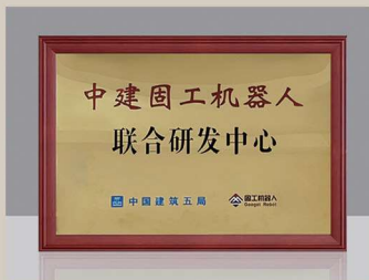
中建固工机器人联合研发中心