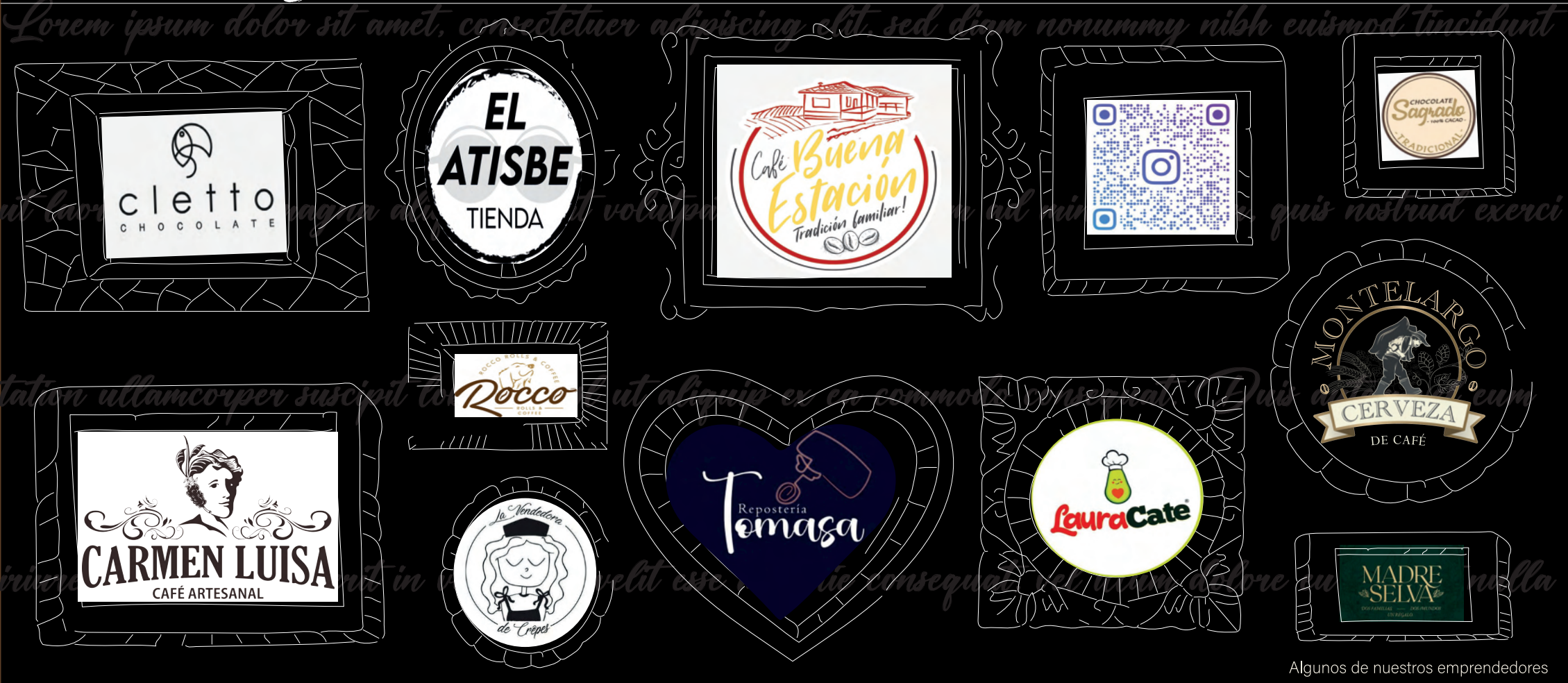
Algunos de nuestros emprendedores

En Restrepia creemos que la formula para triunfar es