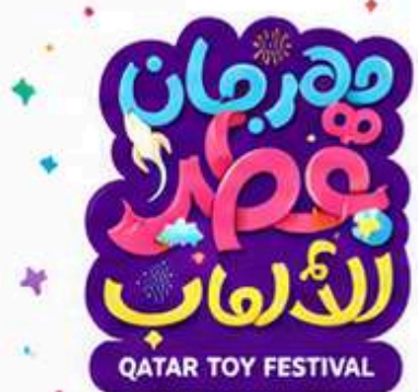
QATAR TOY FESTIVAL