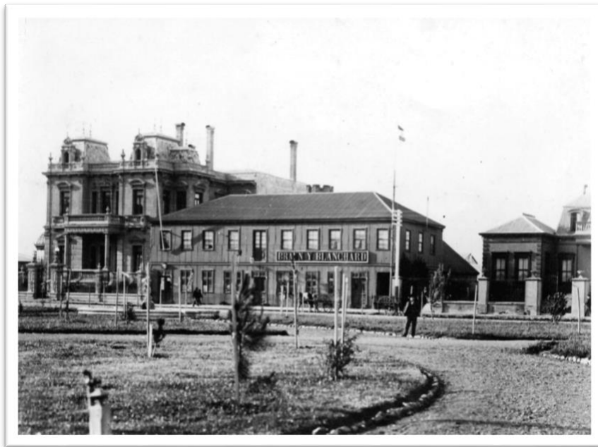
Casa Comercial de los Braun y Blanchard

Ante el gran y prometedor futuro comercial que se edificaba y dada la escasez de bodegas terrestres para almacenar la creciente cantidad de productos de importación y exportación en la ciudad de Punta Arenas, la compañía Braun y Blanchard tomó la decisión de transformar a la embarcación Lonsdale en una bodega flotante, conocida en la época como "chata" 2 . Esta adaptación le otorgó al barco un nuevo propósito en el puerto de Punta Arenas, donde prestó largos y útiles servicios almacenando lana, carbón y mercaderías varias.