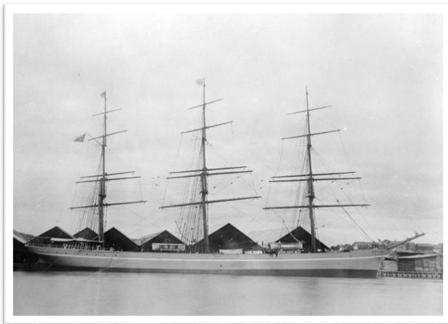
Fotografía del velero Lonsdale hacia 1900

El velero de acero con aparejo de fragata de tres mástiles Lonsdale, construido en 1889 en el prestigioso astillero Charles Joseph Bigger en Londonderry, Irlanda, es una imponente embarcación que evoca la época dorada de la navegación a vela de finales del siglo XIX y comienzos del XX. Fue encargado por la firma Joseph Henry Iredale & Co. de Liverpool, cuyo compromiso con la excelencia en la construcción naval se refleja en el diseño y la resistencia de la embarcación. Con un impresionante desplazamiento de 1.756 toneladas, esta fragata fue concebida para enfrentar los desafíos del comercio de la época a través de la navegación transoceánica. (Lloyd’s Register Foundation, 1889).