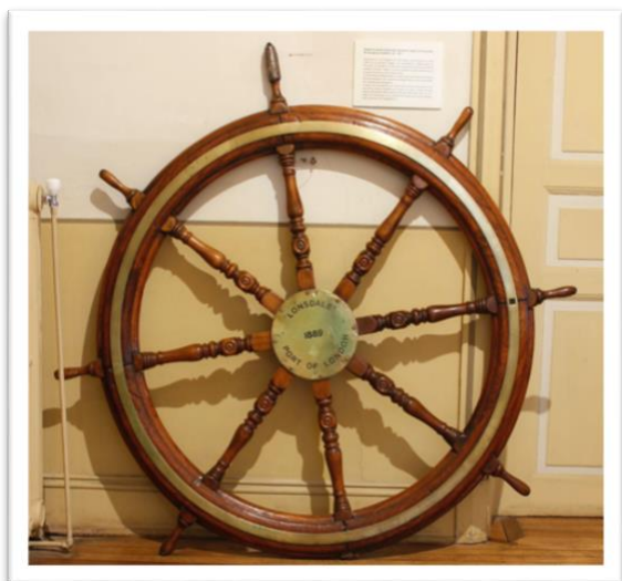
Rueda de gobierno del Lonsdale. Colección marítima del Museo Regional de Punta Arenas

Hoy en día, la rueda de gobierno 4 del Lonsdale se conserva en el Museo Regional de Punta Arenas como parte del patrimonio marítimo de la región, recordando su valioso legado en la historia de la navegación y el comercio marítimo. La historia del Lonsdale se entrelaza con la importancia estratégica del Estrecho de Magallanes, donde la exploración de Fernando de Magallanes en 1520 marcó el inicio de la historia del hemisferio austral del mundo y dio lugar a nuevas exploraciones y descubrimientos en la región.