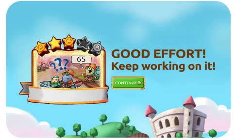
Complete activities to earn stars