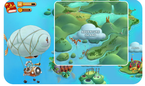
Go to The Adventure Island