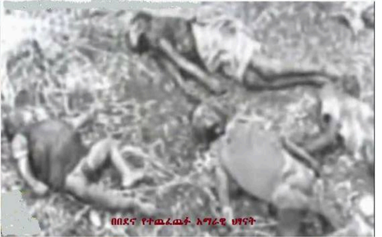
በበደና የተወረወሩት አግራዊ ህፃናት