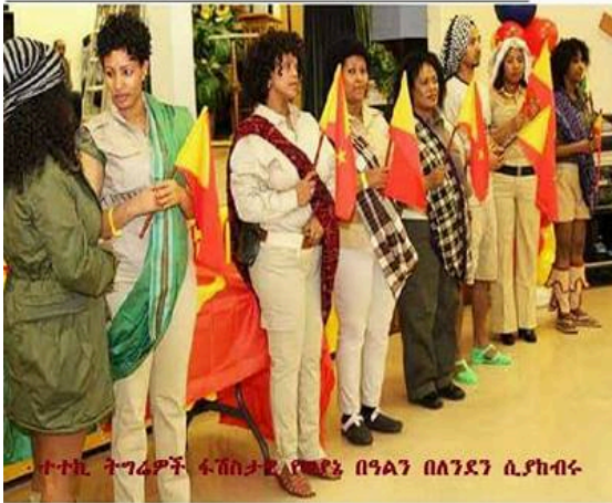
ተተኪ ትግራዎች ፋሽስታዊ ለየጫዳ በዓልን በለንደን ሲያከብሩ