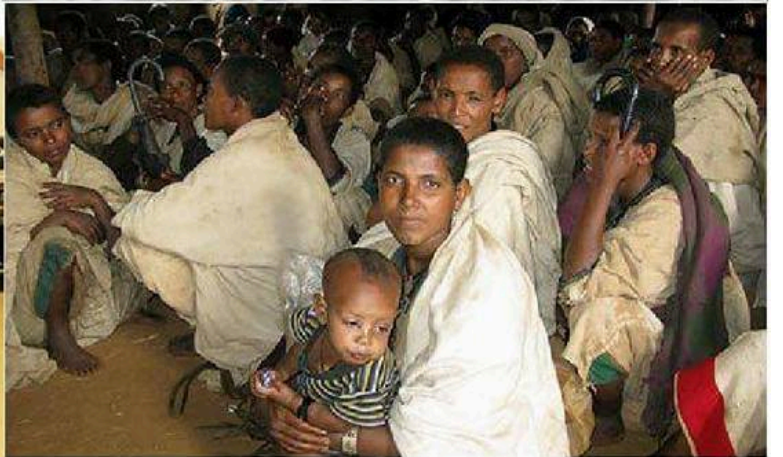
ከቤኒሻንጉል በግፍ የተፈናቀሉ ወጣት አግራዊ ቤተሰቦች