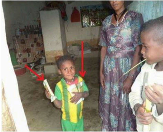
አዲሱ ተጠቃሚት ብምካና ሕፃን ገንዘብ ብምሓዝ ዘርእዮ ተሕጋስ ኣብ እንደርታ ወረዳ ፈለግጎይ ጣብያ ምገብ: http://www.tigrayyouth.org/