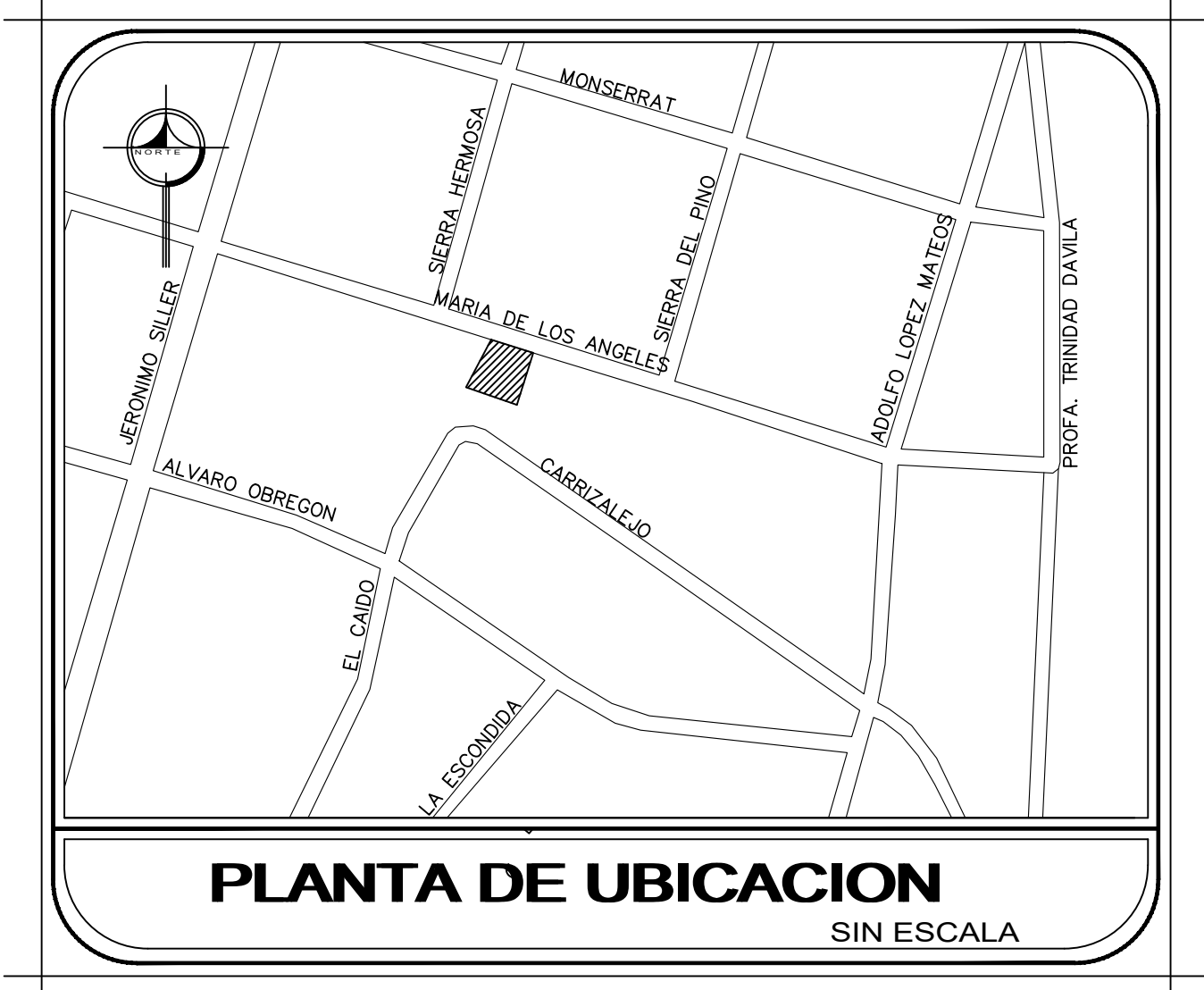
PLANTA DE UBICACION SIN ESCALA