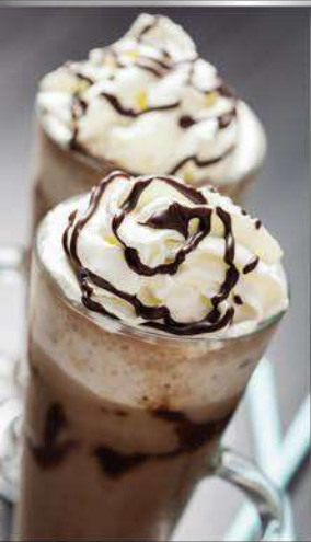
Bases para frappe y Smoothie