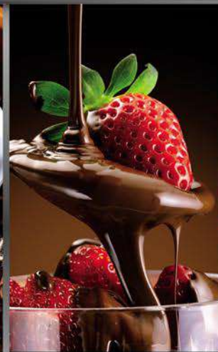
Salsas de chocolate: oscuro, caramelo, cajeta y chocolate blanco