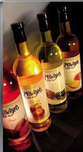
Jarabes saborizantes Allegro