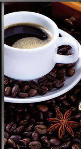
Café de grano mercla gourmet Regular y descafeinado