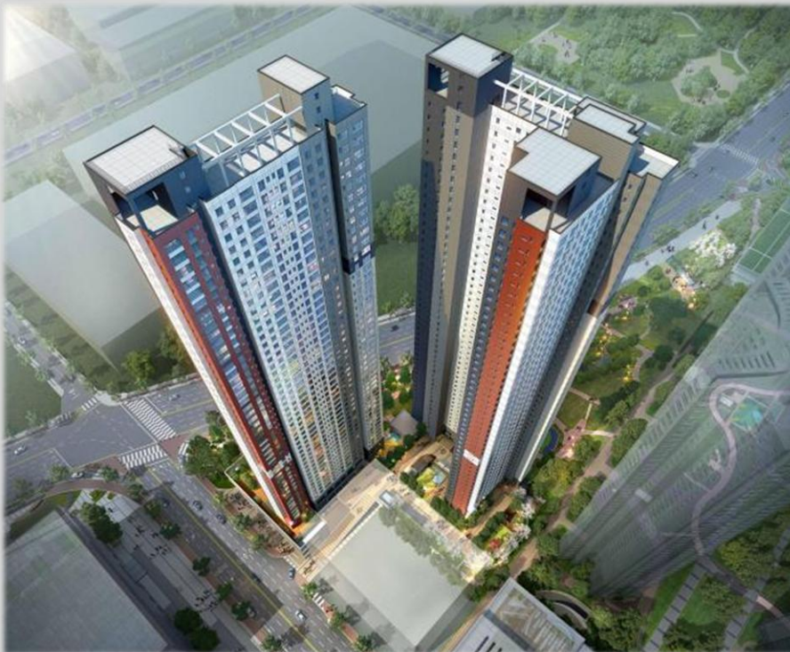
청주 대농지구 상업 4블록 주상복합 신축