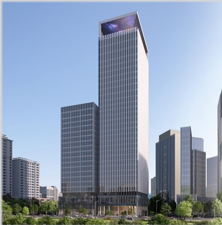
면목동 650번지 사가정역 역세권활성화사업