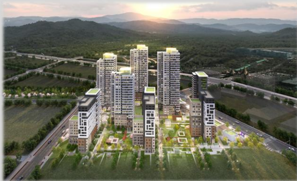
과천 A5블록 공공주택사업