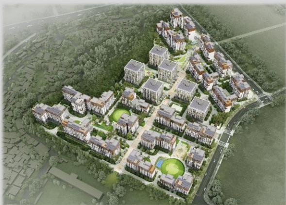
고양 창릉 S16BL 공공주택 신축