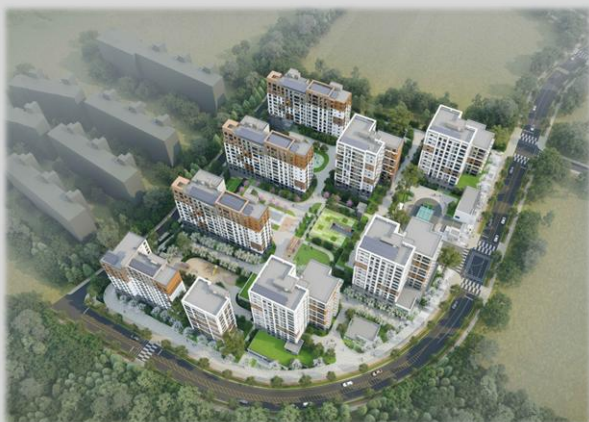
고양 창릉 A10BL 공공주택 신축