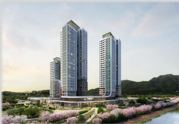
과천 A8블록 공공주택사업