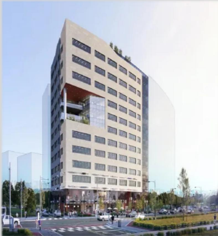
안산 근린생활시설 신축