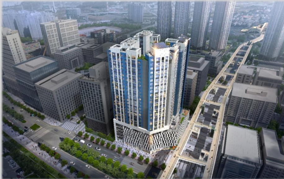
파주시 와동동 복합빌딩 신축공사