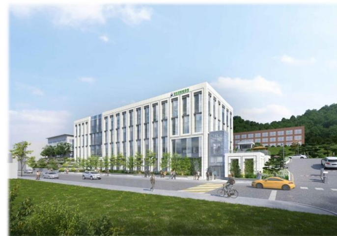
경인 지방병무청 제2병역판정검사동 증축공사