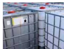
· IBC & Flüssigkeitstank