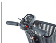
Weicher Griff und zwei Bedienelemente