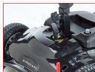
T-Bar-Griff mit Schnellverschluss