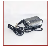
Ladegerät im Auto