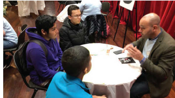
Los estudiantes reciben valiosos consejos sobre el proceso universitario de parte de consejeros voluntarios.

la EXPOSICIÓN DE UNIVERSIDADES PARA LATINOS por la tarde. Conviértete en el estudiante mejor informado mientras navegas a través de tu viaje de toma de decisiones universitarias. Toma las decisiones correctas para ti y tu familia.