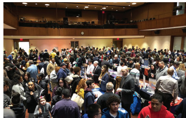
Exposición Anual de Universidades con más de 1,000 estudiantes, padres/tutores y consejeros.

Después de asistir a la parte de la mañana de la CUMBRE DE LIDERAZGO saldrás sintiéndote preparado para