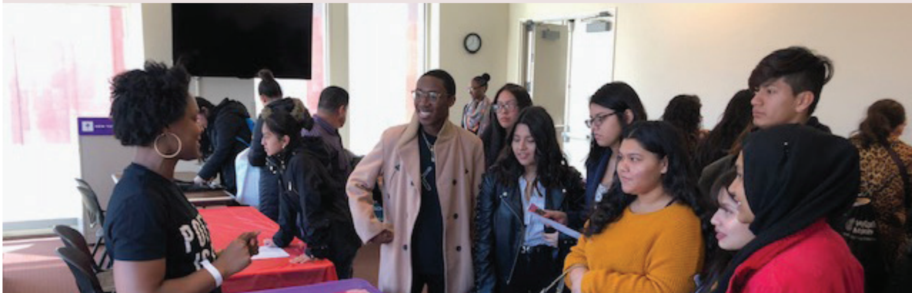
Students listening and learning about services offered by community-based organizations.

The wait is finally over. Mark your calendar for the 30th Annual Latino College Expo & Leadership Summit on Saturday, March 18.