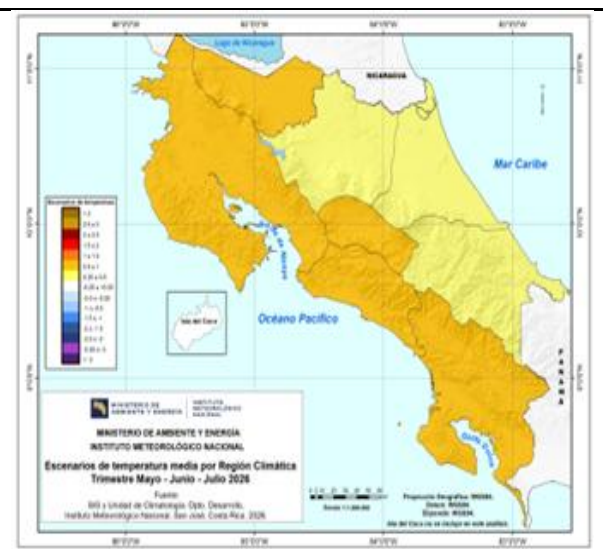
Perspectiva de temperatura media (°C) promedio en las regiones climáticas de Costa Rica, trimestre mayo - junio - julio 2026.

La tabla siguiente, a la izquierda, muestra los montos de lluvia basados en los escenarios de lluvia previamente mostrados. Para el caso de la temperatura media, sus valores en base a los escenarios mostrados anteriormente en este documento se muestran en la figura siguiente; a la derecha.