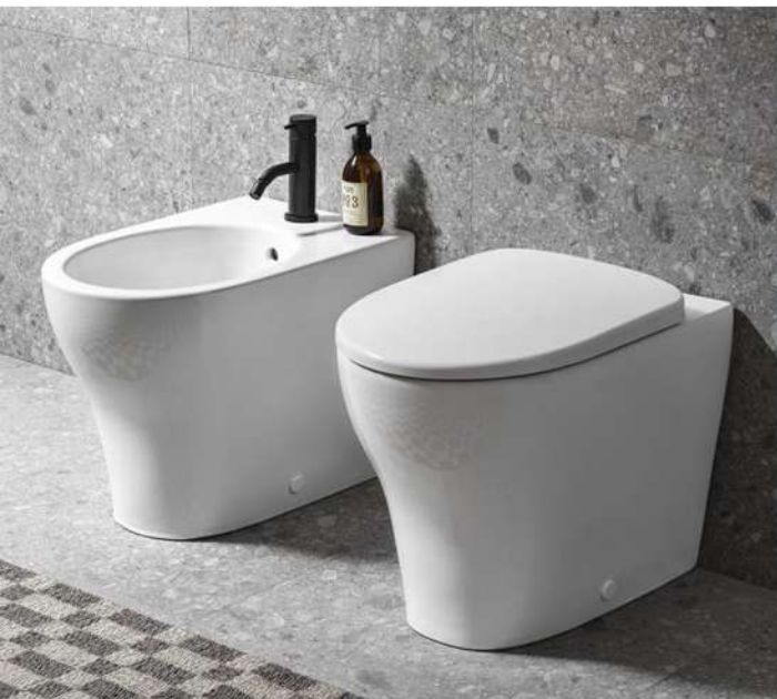
Mod. Selnova Prod. Geberit