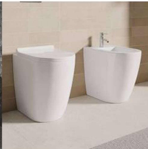
Mod. Fusion Prod. Hatria