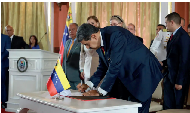
MADURO quer anexar mais de dois terços do território da Guiana

“Este ato ilegal põe em causa a obrigação da Vene-