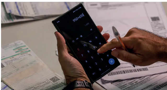
PESQUISA mostra que cresceu o número de famílias pouco endividadas

“A alta da inadimplência também é vista pelo crescimento do percentual de famílias que afirmam que não terão condições de pagar as dívidas atrasadas em março, que é o grupo mais complexo dos inadimplentes. Nesse caso, o percentual já supera o