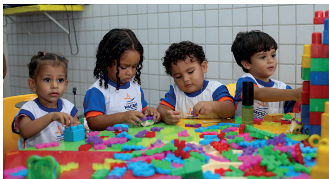
CRIANÇAS DA CMEI SÃO SEBASTIÃO já estão devidamente uniformizadas