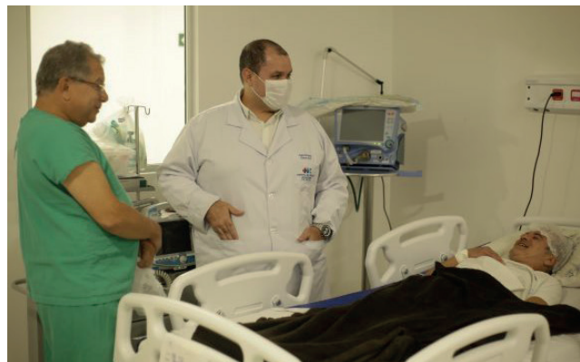
MÉDICOS CONVERSAM com barman após a realização da angioplastia

cateterismo realizado foi possível observar artérias obstruídas e o grau de obstrução. “Procedemos com a angioplastia coronária para desobstruir a artéria e melhorar seu fluxo sanguíneo, salvando, assim, a vida do paciente. Também organizamos a internação dele e posterior procedimento”, detalhou o cardiologista.