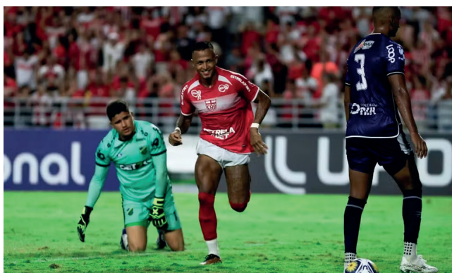
CRB enfrenta o Botafogo-PB, mas antes decide o Alagoano com o ASA