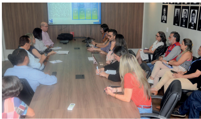
SESAU define ações a serem feitas e avalia o que já está funcionando

“Durante as reuniões analisamos o momento atual da Situação Epidemiológica de Alagoas e a projeção que será necessária para um controle melhor dos casos”. Ele explica que o foco tem sido a preven-