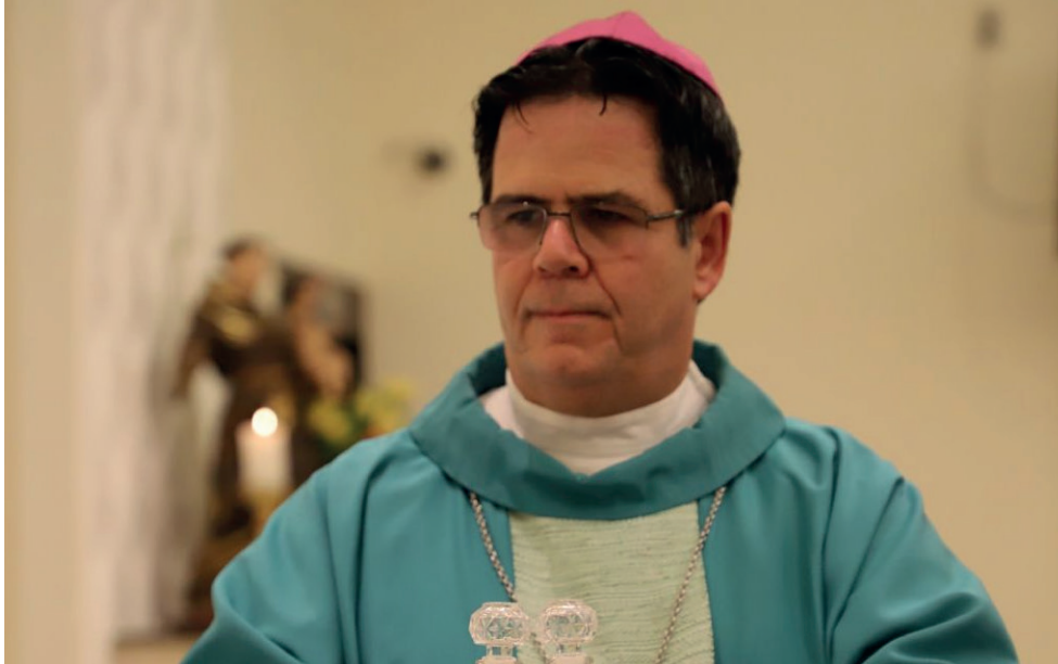
DOM BETO BREIS está em Alagoas desde o final de 2023, já visitou grande parte das paróquias da arquidiocese

A Arquidiocese de Maceió agrega, além da capital, outros 36 municípios. Dom Beto Breis se encontra em Alagoas desde o final de 2023, quando assumiu como coadjutor. Ele destacou que, no período em que auxiliou Dom Antônio Muniz, viveu dias inten-