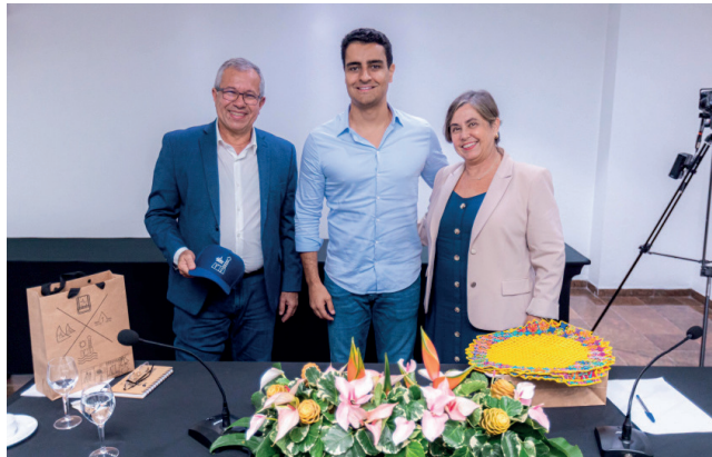
PREFEITO JHC durante reunião com representantes do Fonplata

A operação de crédito que a Prefeitura negocia é no valor de US$ 40 milhões (algo próximo de R$ 200 milhões) e será feita junto ao Fonplata, com o recurso sendo destinado ao Programa de Desenvolvimento Urbano no Município de Maceió (Desenvolve Maceió), tendo como objetivo melhorias na