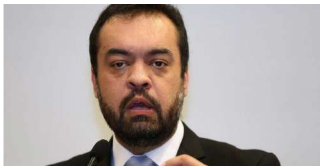
CASTRO é investigado por participação em desvio de verbas na Saúde

Com o início do julgamento pela Corte Especial, o relator mudou de posi-