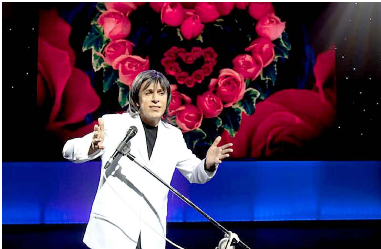
TOM CAVALCANTE, um dos maiores pupilos de Chico Anysio, leva sua imitações e personagens icônicos para o novo espaço cultural do Rio

No palco, Tom canta suas perfeitas imitações de grandes nomes da música, entre outras surpresas. Cada apresentação tem seus diferenciais únicos, pois Tom trabalha suas crônicas e piadas em cima das atualidades do Brasil e do mundo, com uma boa dose de improviso, que ele domina tão bem. As observações do comportamento humano e o olhar atento sobre a política do país somam-se às hilariantes imitações de personalidades da televisão e aos personagens originais