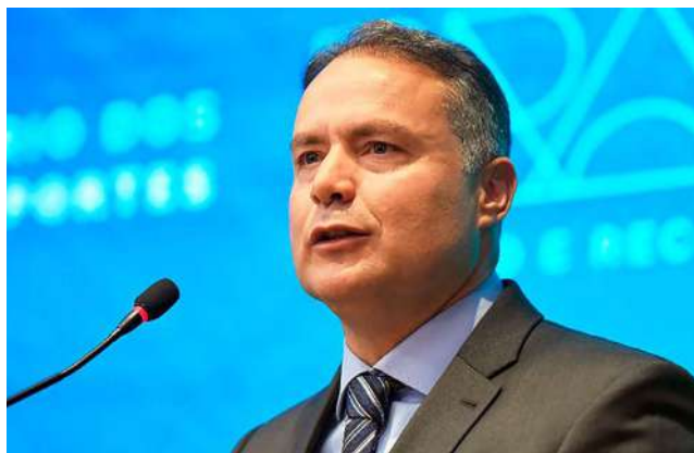
RENAN FILHO teve que driblar pressões políticas por cargos