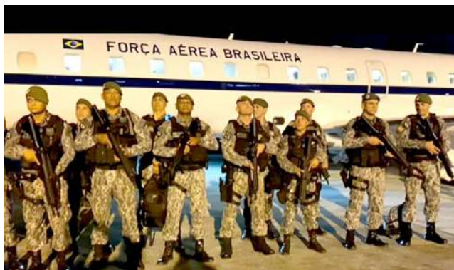
MAIS AGENTES DA FORÇA NACIONAL devem chegar ao RN hoje

A assessoria do governo informou que foram regis-