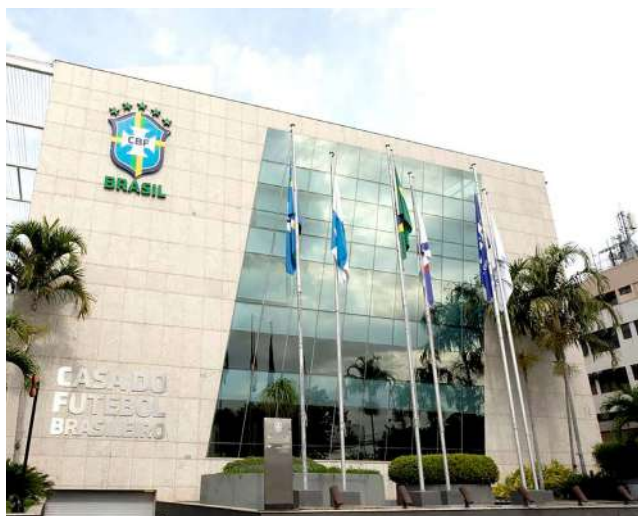
SELEÇÃO BRASILEIRA foi eliminada dos últimos 5 mundiais por rivais da Europa

Os duelos entre sul-americanos e europeus vão obedecer critérios técnicos: os seis melhores times da Conmebol vão jogar contra rivais do grupo A da Nations League da Europa. Ouseja: o Brasil (assim como Argentina, Uruguai, Equador, Peru e Colômbia) vão enfrentar nessas partidas duas das 16 melhores seleções da Uefa, que são: Croácia, Dinamarca, França, Espanha, Portugal, Suíça,