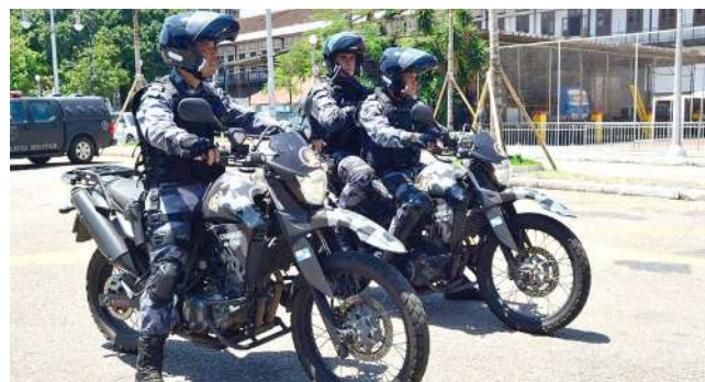
PROGRAMA visa articular ações de segurança pública

No âmbito do Programa de Capacitação Profissional e Implementação de Ofici-