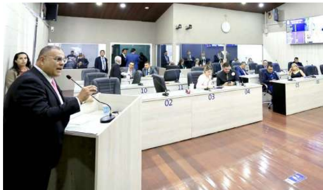
CANUTO defende que audiência pode ser passo importante para soluções

Pela proposta, deverão participar da audiência secretarias municipais que também têm sido afetadas por conta de serviços prestados ou não realizados pela BRK, além de organizações não-governamentais, asso-