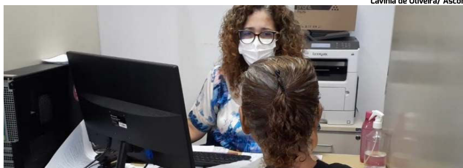
Lavinia de Oliveira/ Ascom

Em um investimento de cerca de R$ 6 milhões provenientes de recursos próprios do Tesouro Estadual, apenas nesta primeira etapa, treze cidades turísticas e rodovias que ligam a capital, Maceió, ao litoral e o interior do Estado estão recebendo sinalização de padrão internacional, a fim de fomentar e qualificar a atividade do turismo por todo o Estado. Maragogi, Japaratinga, Passo de Camaragibe, Porto de Pedras, São Miguel dos Milagres, Marechal Deodoro, Barra de São Miguel, Coruripe, Penedo, Piranhas, Delmiro Gouveia e Murici estão entre os municípios inicialmente contemplados.