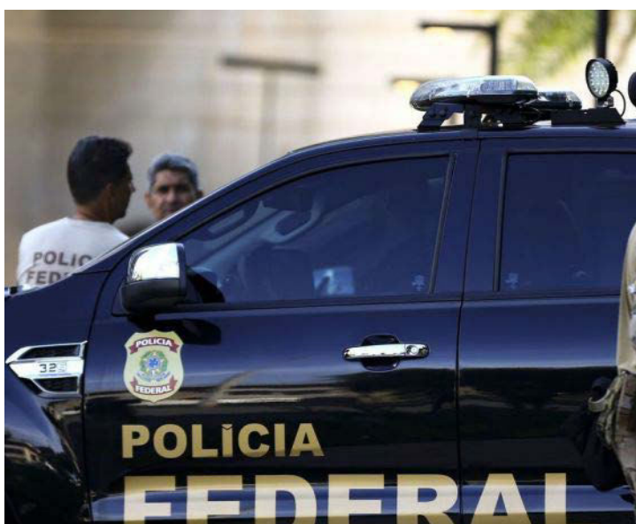
POLÍCIA FEDERAL cumpriu mandados no RJ, MG, PR, SC, ES e DF

Segundo os investigadores, 11 mandados de prisão preventiva e 27 mandados de busca e apreensão foram cumpridos no Rio de Janeiro (nove de busca e apreensão e um de prisão), Minas Gerais (quatro de busca e apreensão e dois de prisão), Paraná (um de busca e apreensão e um de prisão), Santa Catarina (um de busca e apreensão e um de prisão), Espírito