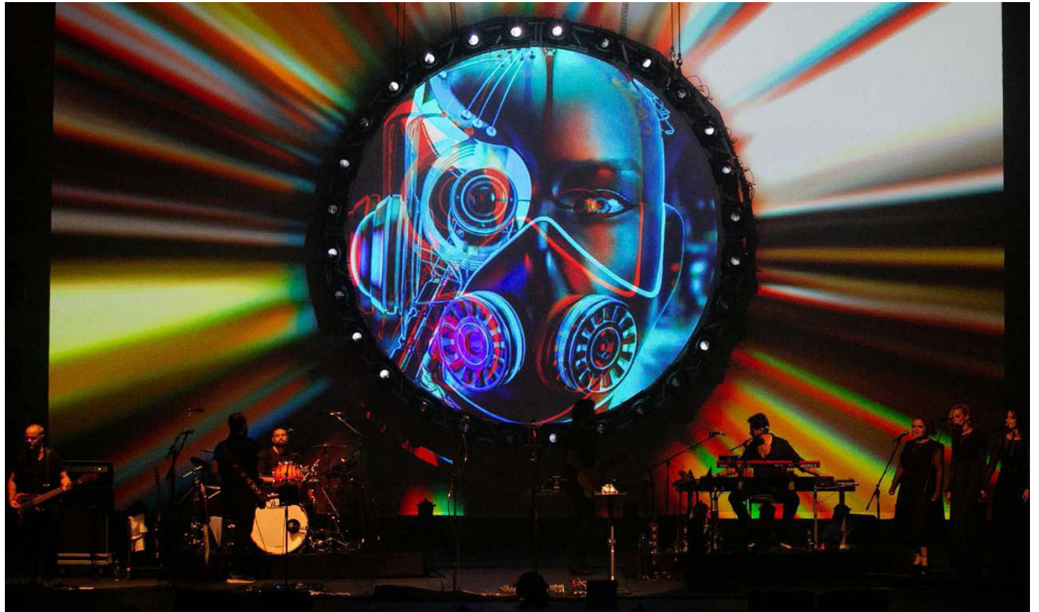
ESPETÁCULO da banda ATOM Pink Floyd conta com repertório da famosa banda britânica e belas imagens em 3D

Norepertório, obras primas de pura arte, musicalidade,