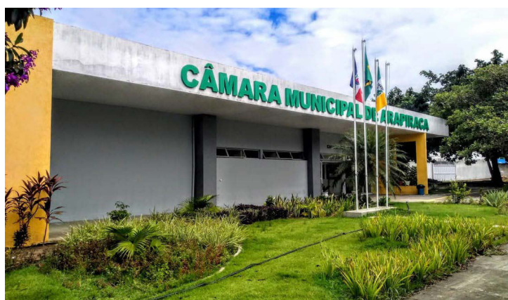
CÂMARA DE ARAPIRACA vive dias intensos já no começo do ano

O nome que aparece no contrato seria da esposa de um dos vereadores que