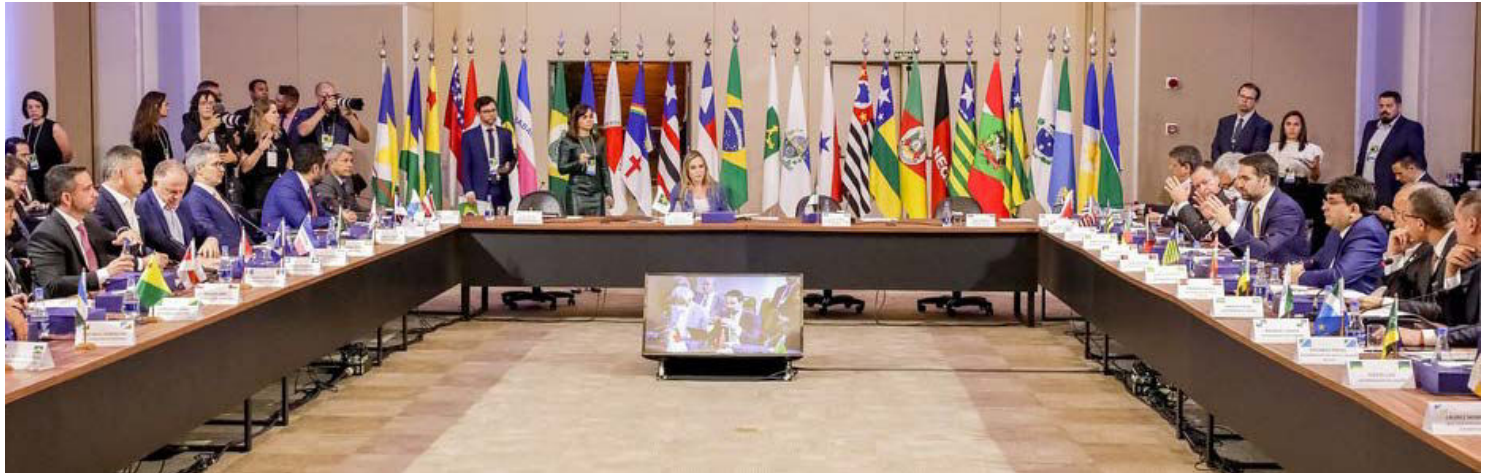
GOVERNADORES participaram de uma nova reunião de trabalho com o presidente Lula em Brasília

Na quinta-feira passada, em evento preparatório, o Fórum de Governadores se reuniu em um hotel da capital federal para definir as demandas que levariam ao governo federal. O principal assunto foi a perda de arrecadação com a redução das alíquotas do Imposto sobre Circulação de Mercadorias e Serviços (ICMS), um tributo estadual, sobre combustíveis e outros serviços essenciais.