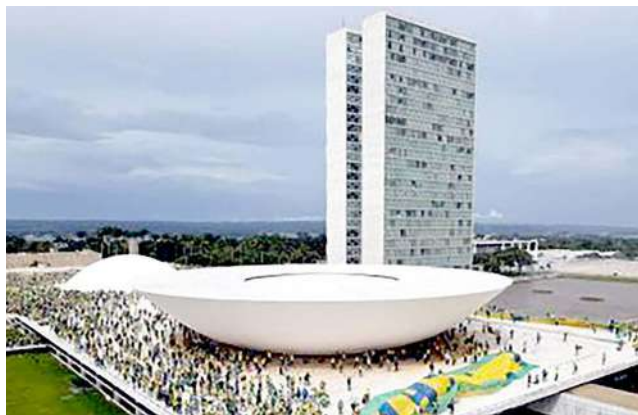
QUEBRADEIRA de 8 de janeiro devem mesmo ganhar uma CPMI

O vice-líder do governo no Congresso, o deputado Lindbergh Farias (PT-RJ), confirmou que o partido