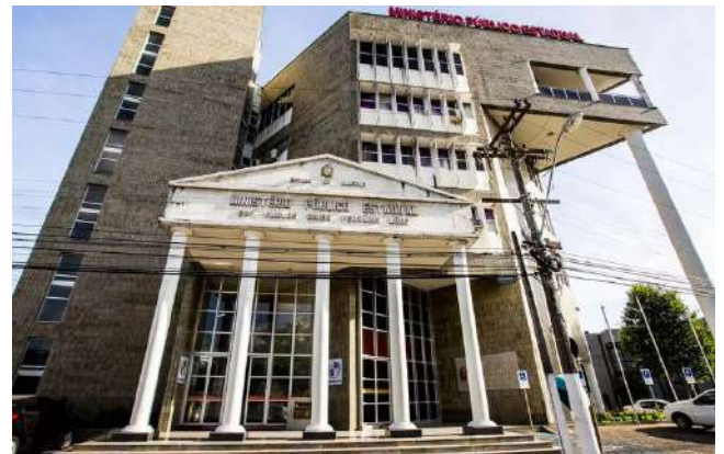
MPE quer que o caso seja devidamente apurado

Ela foi socorrida pelo motorista e levada para uma Unidade de Pronto Atendimento (UPA), onde foi constatado, por meio de