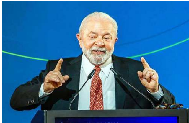
UM DOS SETORES que Lula quer dar ênfase são as energias renováveis

Segundo ele, além das 14 mil obras que estão paralisadas e que devem ser retomadas no país, o governo está apostando na indústria de hidrogênio verde no Nordeste do país e na perspectiva de estabelecer parcerias com o mundo todo na construção de usinas eólicas, de biomassa e energia solar. “O Brasil quer construir,