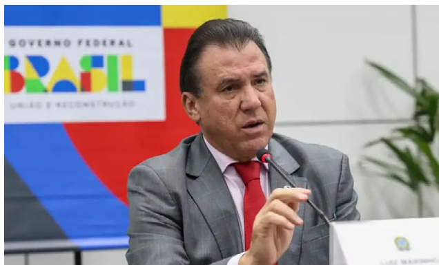
MINISTRO destaca que empresas ainda podem enviar dados

Segundo o ministério, das cerca de 50 mil empresas que se enquadram na lei, menos de 300 receberam autorização para omitir os dados. “Estamos falando de um número insignificante do ponto de vista de quantitativo”, disse, enaltecendo