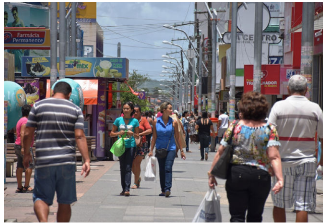
ALIANÇA COMERCIAL informou que lojas do Centro estarão fechadas

O Tribunal de Justiça funcionará em regime de plantão, assim como