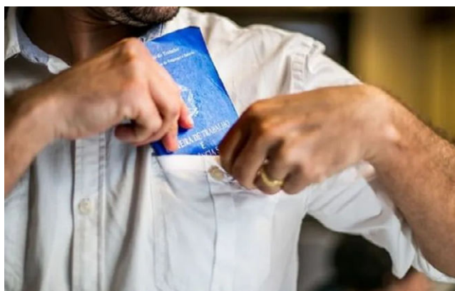
VAGAS DE EMPREGO estão em queda em todo o Brasil

A população fora da força de trabalho (66,9 milhões) cresceu 0,9% (mais 607 mil pessoas) no trimestre e ficou estável no ano. A população desalentada (3,6 milhões) não variou significativamente ante o trimestre anterior e recuou 7,1% (menos 275 mil pessoas) no ano. O número de empre-