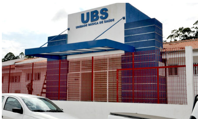
MACEÍO deve receber duas novas unidades básicas de saúde

Segundo Felipe Proença, secretário de Atenção Primária, 500 propostas já foram formalizadas, enquanto outros 1.048 pedidos de construção de UBS estão em processo de aprova-