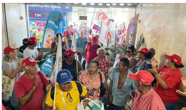
INTEGRANTES DO MST durante invasão ao prédio do Incra em Maceió