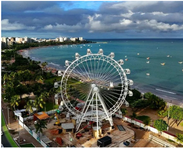
ENTORNO DA RODA-GIGANTE precisa obedecer sentença judicial

A procuradora da República Niedja Kaspary conduziu o encontro, que contou com representantes da Prefeitura e do Instituto de Planejamento Urbano de Maceió (Iplam). Na ocasião, a equipe técnica municipal apresentou os equipamentos instalados nas proximidades da roda-gigante, com destaque para 2 quiosques que geraram