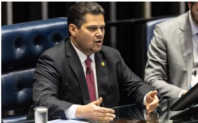
ALCOLUMBRE aumenta o tom e quer independência para decisão

Ele criticou o fato de a indicação ainda não ter sido formalizada pelo Planalto. Embora Lula já tenha escolhido Messias, o envio da mensagem presidencial ao Congresso, etapa necessária para que o Senado possa analisar oficialmente o nome, ainda não ocorreu.