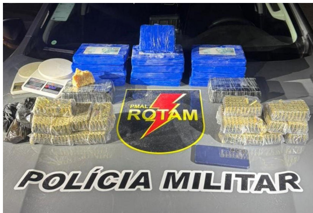
APREENSÕES foram feitas na Vila Brejal, em Maceió

Ação teve início durante patrulhamento de rotina, quando as equipes receberam denúncia anônima de que um indivíduo praticava tráfico de entorpecentes em frente a uma residência. Ao