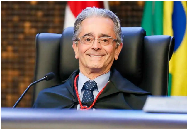
FÁBIO BITTENCOURT assume o governo interinamente pela 2ª vez

A cerimônia de transmissão do cargo está marcada para as 9h30, no auditório Aqualtune do Palácio República dos Palmares, sede do Executivo estadual. O ato será conduzido pelo próprio governador Paulo Dantas,