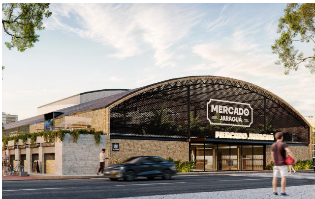
MERCADO deve atrair turistas e devolver autoestima ao maceioense

Restaurantes serão instalados em estruturas no