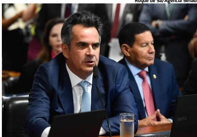
CIRO NOGUEIRA é o autor da emenda polêmica

Pelas regras aprovadas pela CCJ, apenas prefeitos eleitos em 2024 que não estavam no cargo anteriormente poderiam tentar a reeleição em 2028. A emenda de Ciro, porém, amplia essa autorização para todos os prefeitos, inclusive para aqueles que já estão no segundo mandato. Na prática, isso permitiria que prefeitos que governam desde 2021 - e foram reeleitos em 2024 - permaneçam no cargo até 2034, caso vençam novamente em 2028. O novo mandato, no período de transição, teria seis anos, elevando para 14 anos o tempo total no comando do Executivo municipal. A medida poderia beneficiar