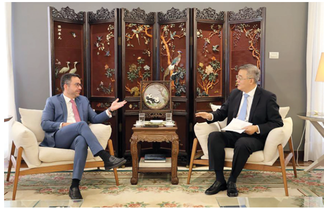
GOVERNADOR DE AL tem extensa agenda de reuniões na China

vai se reunir com representantes da ZTT – que já investe no Estado – que é uma das maiores produtoras de cabos de fibra óptica. Atualmente, a empresa