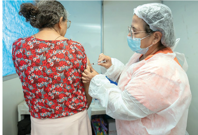
VACINAÇÃO com outros imunizantes continua sendo realizada

Após haver a reposição dessas doses pelo Ministério, as equipes voltarão a aplicar o imunizante nos pontos de vacinação da capital. A vacinação com a Pfizer Baby,