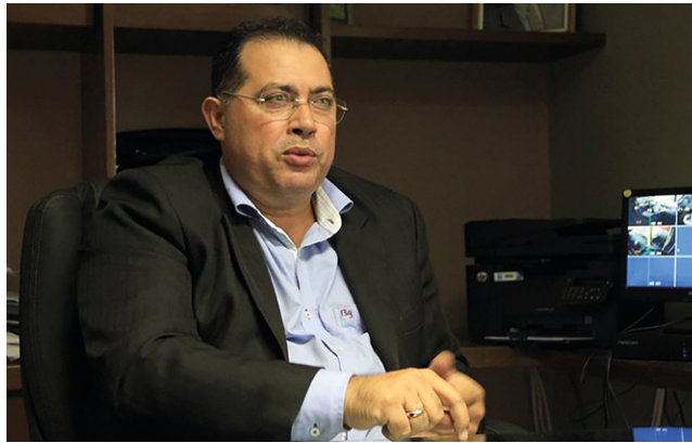
BEZERRA destaca que a Constituição delimita quantidade de vereadores

Campo Alegre, Ibateguara e Anadia tiveram uma queda acentuada no