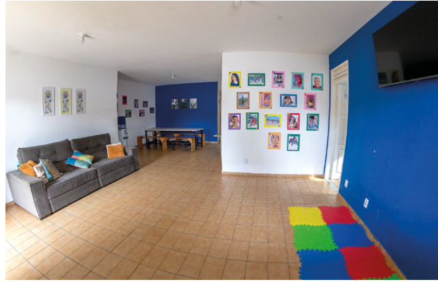
UNIDADES DE ACOLHIMENTO recebem crianças e adolescentes

Há também, duas unidades de acolhimento voltadas para a população em situação de rua, que são a Casa de Passagem Serviço de Acolhi-