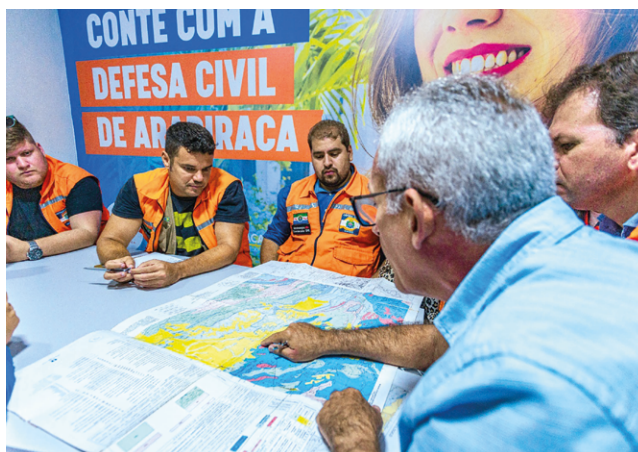
DEFESA CIVIL investiga causas e se fissuras resultaram dos tremores

das em Arapiraca foram três abalos sísmicos, sendo o último no dia 28 de agosto. O primeiro foi de 1.5 na Escala Richter. O 2º chegou a 2.1 e o 3º ficou em 1.8.