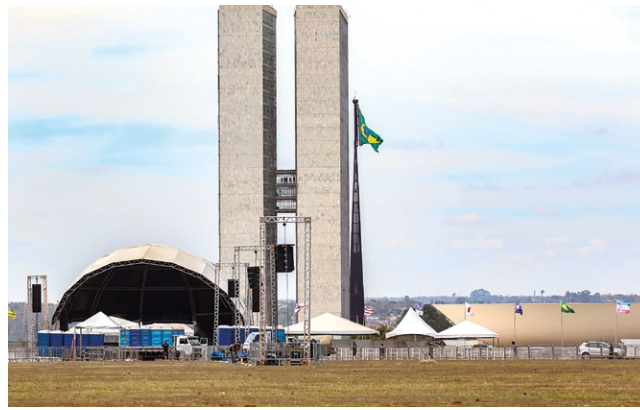
GRUPO especial quer traçar estratégias e garantir segurança na capital

dora explica que o gabinete criado será uma espécie de centro integrado de informações e que já enviou convite para o governo federal, para a participação de todos os órgãos “que acharem importante se fazerem presentes”.