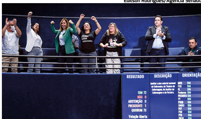
PISO NACIONAL aumenta vencimentos dos profissionais de enfermagem

O STF havia suspenso a aplicação da lei, logo depois da sua aprovação, por meio de liminar do ministro Roberto Barroso. No início de julho, o Plenário da corte revogou a liminar, mas estabeleceu restrições para o cumprimento da lei. O pedido da Advosf é pelo