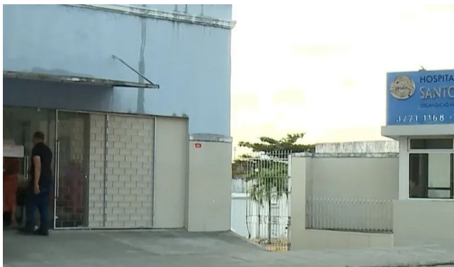
MATERNIDADE afirma que fez todas as manobras de suporte de vida

O caso ganhou repercussão após a divulgação de um vídeo gravado pela família, no qual a adoles-