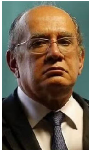
GILMAR MENDES irritou Davi Alcolumbre com regras para impeachment