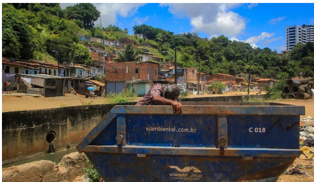
POBREZA ainda é um grave problema social em Alagoas

Entre 2022 e 2024, a taxa caiu 13 pontos percentuais, de 53,9% para 40,9%. Em termos absolutos, 416 mil pessoas deixaram a condição de pobreza nesse intervalo.