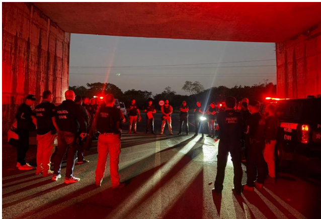
POLICIAIS CIVIS cumpriram 13 mandados judiciais