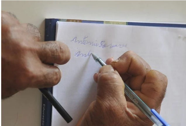
QUANTIDADE DE ANALFABETOS em AL é superior à média do Nordeste

O percentual alagoano permaneceu praticamente estável em relação a 2023, quando era de 14,1%. No mesmo período, tanto o Brasil quanto o Nordeste registraram leve redução em