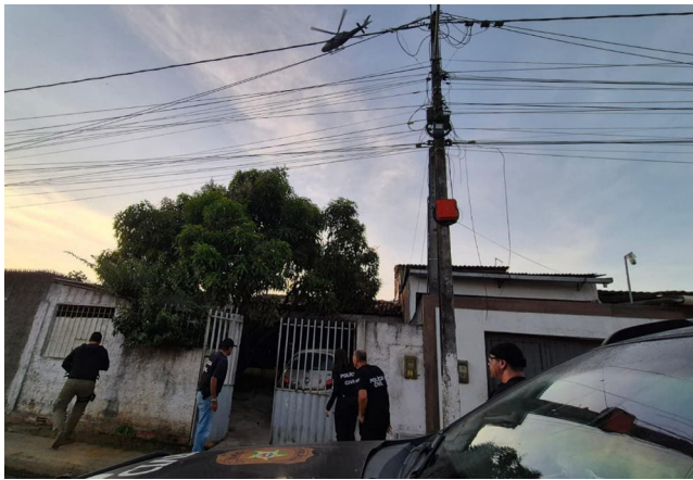
POLÍCIA CIVIL desarticula esquema de estelionato e lavagem de dinheiro

O esquema funcionava com criminosos se passando por proprietários de casas lotéricas, enganando funcionários para que pagassem boletos fraudulentos. Os