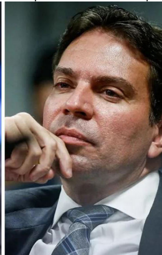
ALEXANDRE RAMAGEM E ANDERSON TORRES foram condenados pelo STF