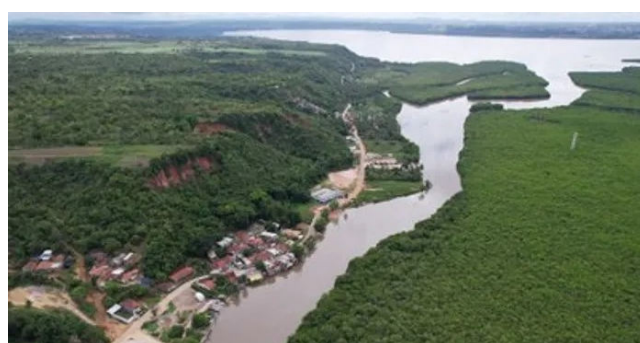
DENÚNCIAS dizem respeito a edificações no Povoado Cadoz

Em reunião realizada no dia 18 de novembro, representantes da prefeitura de Coqueiro Seco