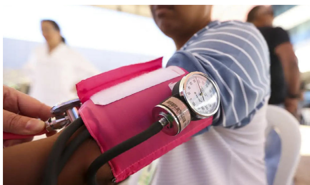
BRASIL tem quase 8 milhões de beneficiário de planos individuais

Isso significa que o custo dos planos leva em consideração o aumento ou queda da frequência de uso do plano de saúde e os custos dos serviços médicos e dos insumos, como