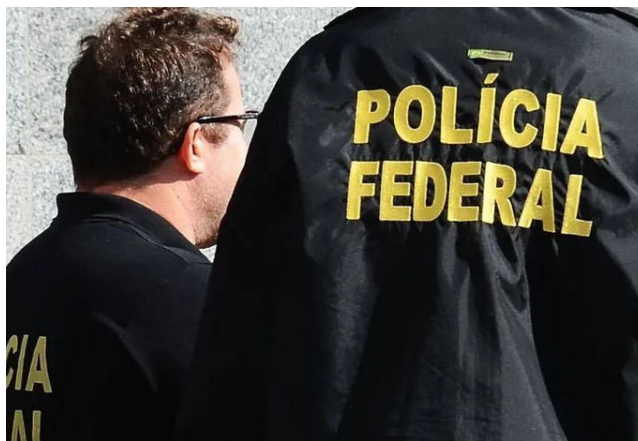
POLÍCIA FEDERAL conseguiu interceptar a 'encomenda' em Campinas

O suspeito foi identificado, mas não teve a identidade revelada. De acordo com a Polícia Federal, ele