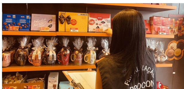
CELEBRAÇÃO é uma das que mais movimentam o comércio

Entre as sugestões para os casais, uma boa opção são as diárias em hotéis, com preços que variam entre R$ 249,00 a R$1,8 mil. Já aqueles casais que não abrem mão de comemorar a