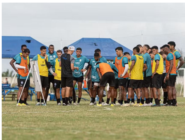
AZULÃO vai ter que reforçar estratégias com ausência de 2 titulares

Segundo o treinador, quando o CSA empatou o jogo aos 38 do 2º tempo, dava sinais de que poderia