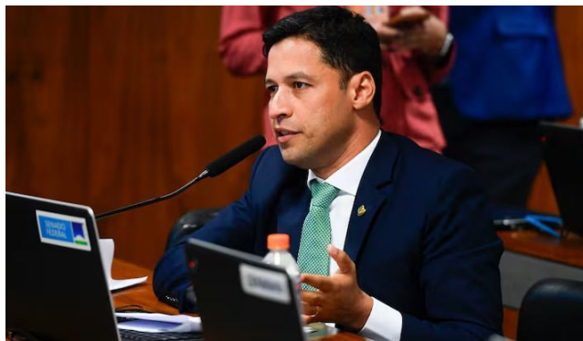
RODRIGO CUNHA classifica o trecho como artimanha parlamentar

O projeto de lei do Mover foi elaborado pelo governo federal, e durante a tramitação do texto na Câmara dos Deputados foi incluído um artigo para tornar obrigatório o pagamento de imposto de