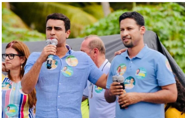
JHC pretende ter Cunha ao seu lado na busca pela reeleição na capital

JHC agora quer apenas reunir a equipe, incluindo os secretários que são indicados pelo União Brasil e pelo Progressistas, para comunicar a decisão e – desta forma – indagar se a “aliança” segue, mesmo diante de sua escolha, ou se o rompimento