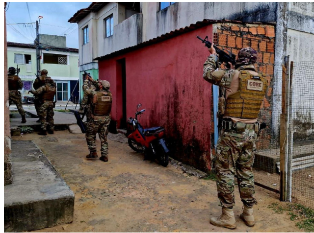
TRABALHO de cumprimento de mandados contra criminosos