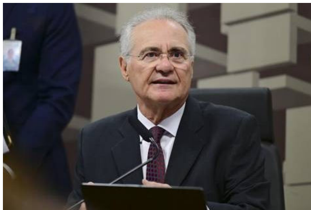
SENADOR rejeitou todas as 124 sugestões de mudanças apresentadas

Além disso, o projeto prevê – para compensar a renúncia fiscal – um “imposto mínimo” de até