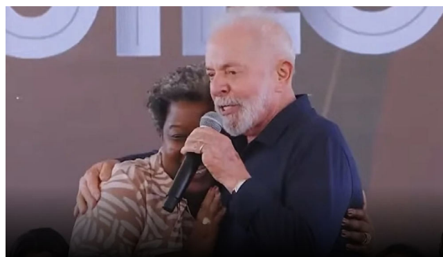
LULA teme que assistência acabe associando governo ao tráfico

Macaé Evaristo visitou na manhã da última quinta-feira (30/10) o Complexo