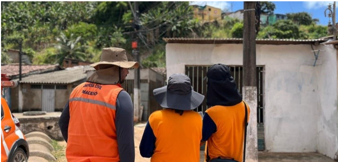
TÉCNICOS DA DEFESA CIVIL percorrem ruas do Feitosa e do Vale do Reginaldo