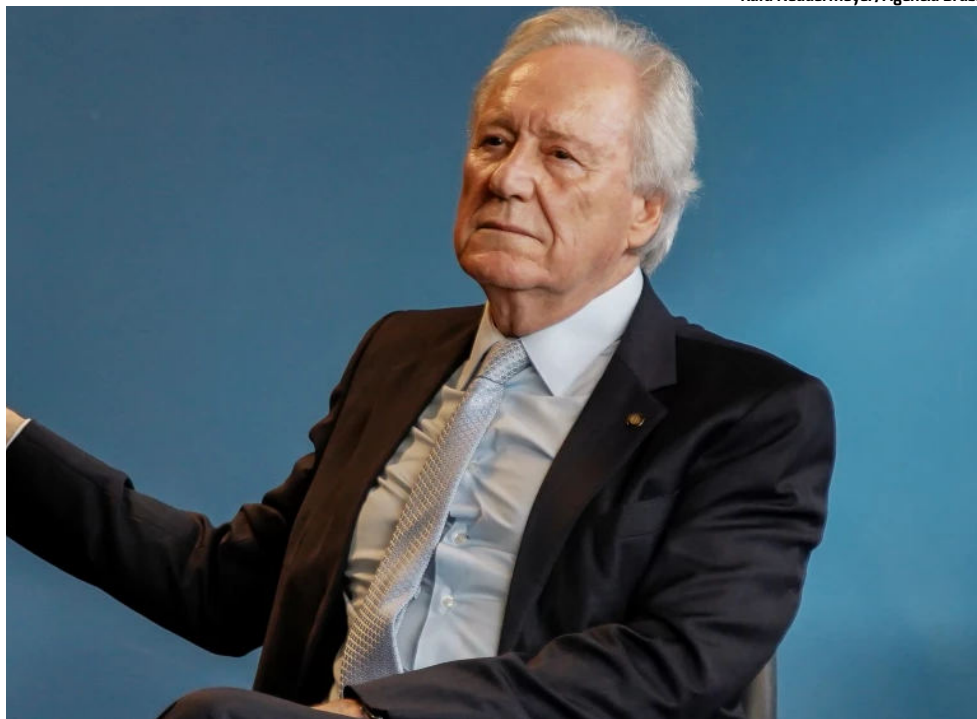
LEWANDOWSKI garante que não recebeu solicitação formal do governo do Rio de Janeiro

Lewandowski afirmou que não recebeu solicitação formal do governo estadual, enquanto o diretor-geral da PF, Andrei