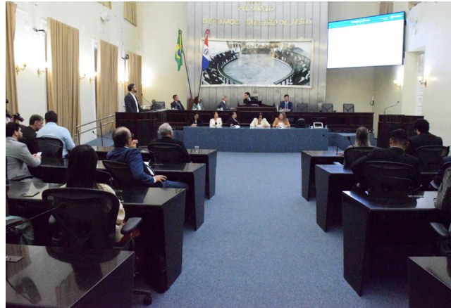
ALE abriu as portas para discutir orçamento do ano que vem