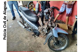
Polícia Civil de Alagoas

Cinco adultos foram presos e um adolescente de 15 anos foi apreendido suspeitos de envolvimento em diversos roubos e desmanche de veículos em Igreja Nova. A Polícia Civil flagrou uma oficina na cidade que recebia os veículos roubados.