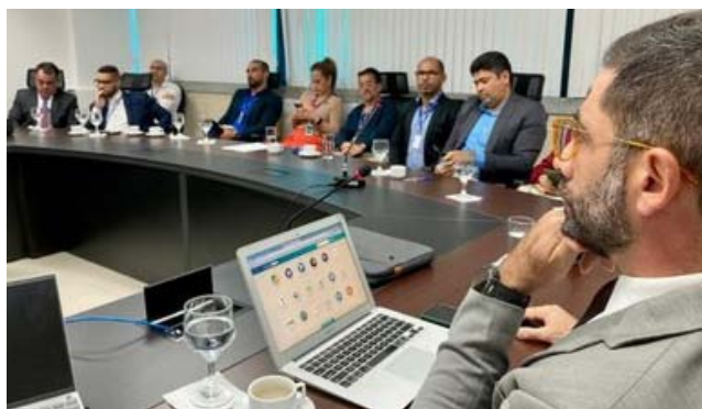
MPF reuniu-se com a Semurb para tratar da operação da CTRM

A Orizon sucedeu a antiga empresa responsável, que era a V2 Ambiental. A Prefeitura de Maceió explicou que a emissão da licença de operação foi publicada no Diário Oficial do Município de Maceió no dia 4 de julho e incluiu uma série de condições, restrições e recomendações, autorizando apenas o