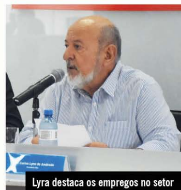
Lyra destaca os empregos no setor

“É essa a realidade que queremos ampliar, melhorando a expectativa do empresariado quanto ao desempenho