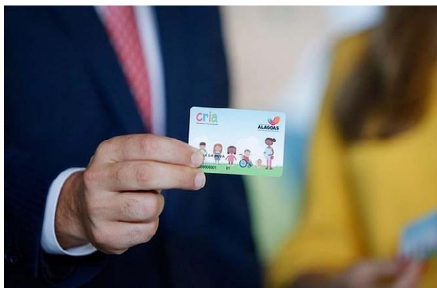
PROGRAMAS como o Cria são prioridade para o governo de Alagoas