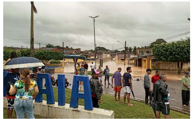
MORADORES DE ATALAIÁ sofrem maus bocados com as chuvas

As regiões mais afetadas foram o Centro da cidade e as localidades de São Sebastião, Buraco do Jacaré, Parque do Futuro e Paraíso, que ficam na parte alta da cidade. Durante todo o dia, o poder público municipal encaminhou máquinas para tentar retirar barro e lama