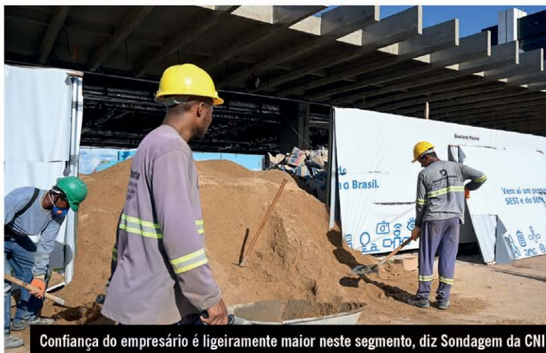
Confiança do empresário é ligeiramente maior neste segmento, diz Sondagem da CNI

O Índice de Confiança do Empresário (ICEI) da Indústria da Construção subiu 0,3 ponto em junho de 2023, passando de 51,9 pontos para 52,2 pontos. A avaliação é da Confederação Nacional da Indústria (CNI) que, por meio da Sondagem da Indústria da Construção, entende que a confiança