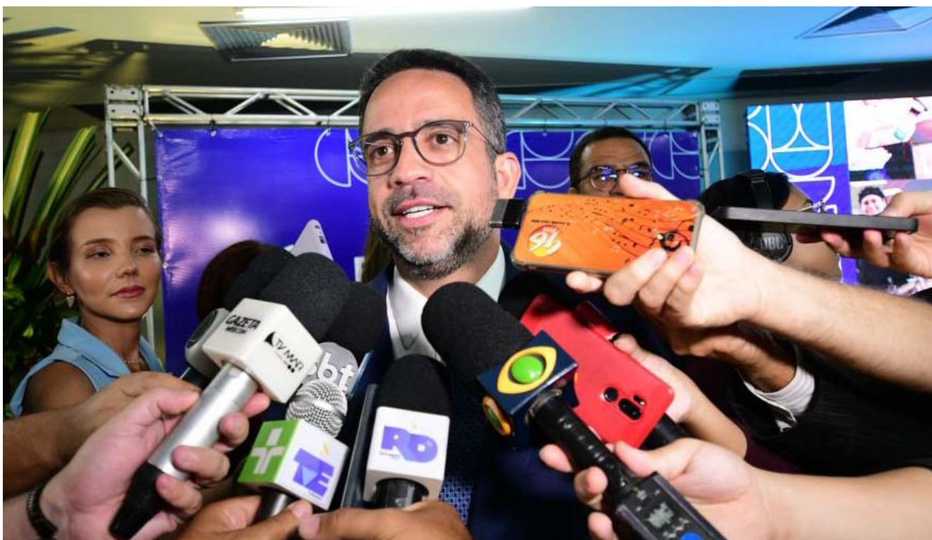
GOVERNADOR PAULO DANTAS estabeleceu como prioridade cumprir a Lei de Responsabilidade Fiscal e conta com a Sefaz para organizar finanças

A secretaria considera que a queda da inflação e da taxa de juros são elementos necessários para impulsionar o crescimento econômico e aumento de arrecadação. “Uma vez instaladas as bases de estabilidade de preços e avanço econômico, seus efeitos vão sendo gradual e sistematicamente sentidos na economia real, em particular no mercado de trabalho aumentando a massa de rendimentos, o consumo das famílias