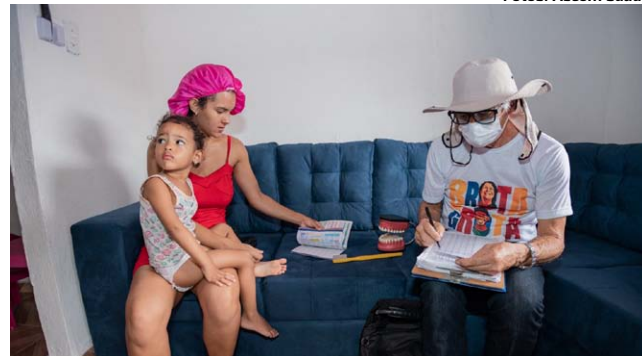
FAMÍLIAS que moram em áreas de difícil acesso estão sendo atendidas pelas equipes da prefeitura através do Brota na Grota