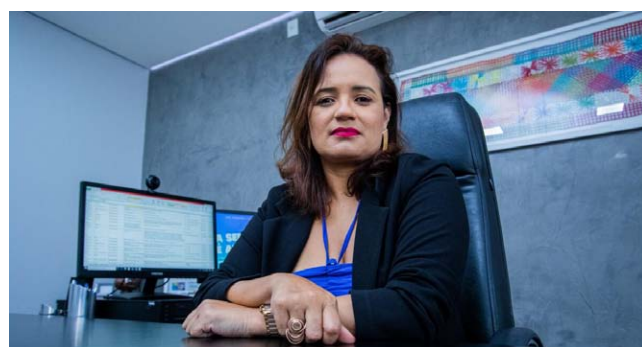
SECRETÁRIA destaca o aumento do espaço fiscal para investimentos

Quanto à dívida contratada junto ao Banco do Brasil, a secretaria disse que o impacto é mais curto. “Assim amortizamos mais no início justamente para evitar o acúmulo de juros. Estima-se um pagamento de R$160 milhões no primeiro ano, o que seria ainda menor do que o espaço gerado pela