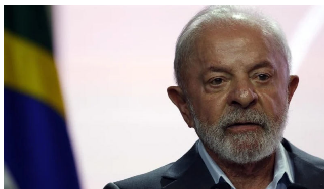
Lei sancionada por Lula reforça mecanismos de proteção às vítimas

Outra mudança importante é o endurecimento para quem descumpre ordens judiciais relacionadas a esses crimes, que agora pode receber até 5