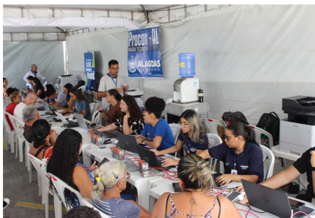
SERVIÇOS GRATUITOS E ORIENTAÇÕES estão disponíveis das 9h às 15h

Durante os 4 dias, o Procon/AL disponibilizará: atendimento especializado a pessoas em situação de superendividamento, por meio do Núcleo de Atendimento ao Superendividado (NAS); registro de reclamações; orientações sobre direitos do consumidor; fiscalização in loco; ações educativas voltadas ao consumo consciente.