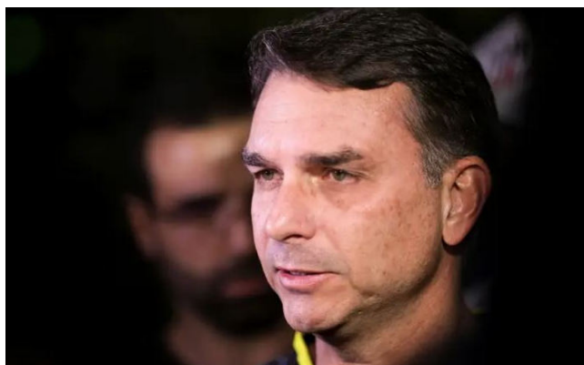
SENADOR garante que sua candidatura à Presidência é irreversível

As declarações foram dadas após visita ao pai, Jair Bolsonaro, preso na Superintendência da PF em Brasília. Flávio relatou que o ex-presidente “ficou muito feliz” com o impacto