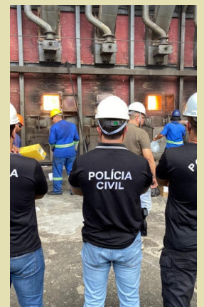
MATERIAL foi levado pela Polícia aos fornos da Usina Santa Clotilde