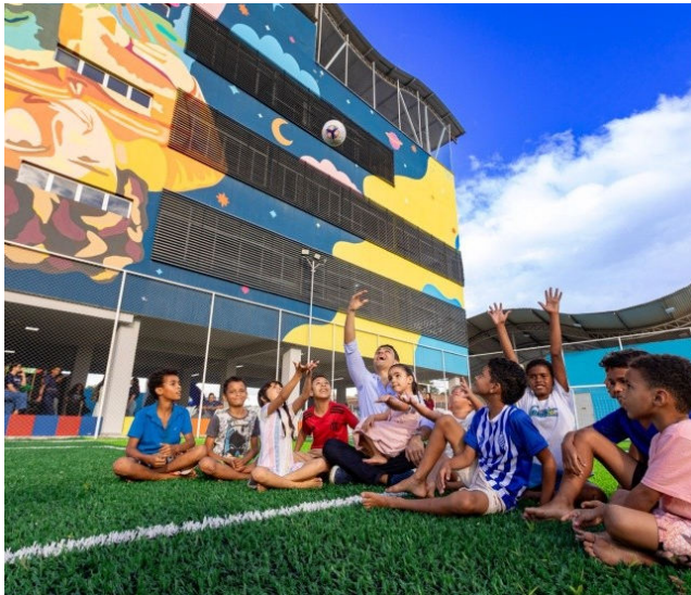
UNIDADES DE EDUCAÇÃO reforçam o combate ao analfabetismo

Entre as ações citadas para a diminuição estão investimentos na Educação de Jovens, Adultos e Idosos (Ejai), incluindo a adesão ao Pacto Nacional pela Superação do Analfabetismo e Qualificação na Ejai; oferta do Programa Brasil Alfabetizado; abertura de turmas em espaços alter-