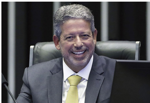
ARTHUR LIRA quer se fortalecer para disputar vaga no Senado

A cúpula nacional da nova entidade reunirá nomes de peso: o ex-presidente da Câmara Arthur Lira (PP-AL), o governador goiano e pré-candidato ao