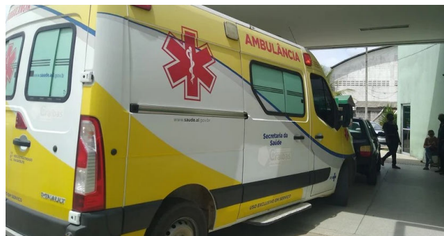
VÍTIMAS foram de cidades do Agreste, Sertão e Baixo São Francisco

O feriadão também teve ocorrências envolvendo animais: 5 mordidas de cachorro, 19 picadas de escorpião, 1 por inseto, 2 por abelhas e 4 relacionadas a queda de animal. Sete pessoas sofreram acidentes