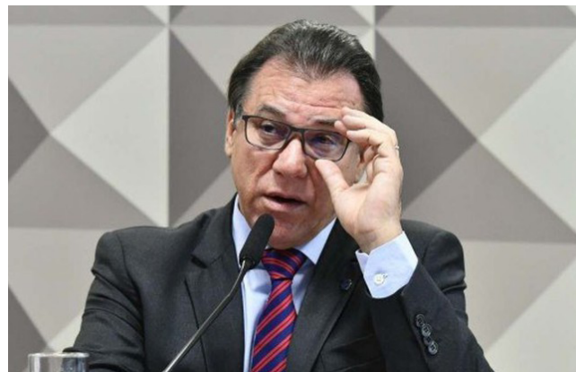
MARINHO afirma que economia brasileira suportaria redução da jornada

Marinho informou que ainda não conversou sobre o assunto com o presidente Luiz Inácio Lula da Silva (PT) e avaliou que o tema não poderia ser tratado isoladamente pelo governo, pontuando que sociedade e parlamento precisam entrar em um consenso.