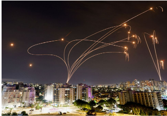
CONFLITO NO ORIENTE MÉDIO é preocupação para o governo do Brasil

Foram reservadas seis aeronaves para a retirada dos brasileiros. O 2º avião da Força Aérea Brasileira (FAB) deixou a Base Aérea de Brasília na 2ª feira passada.