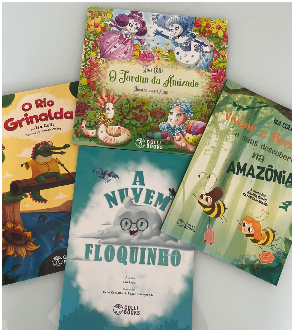
VOLTADO PARA O PÚBLICO INFANTIL, catálogo traz livros com personagens engajados nas questões ambientais