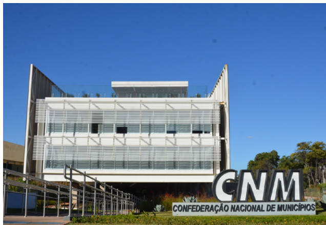
CNM revelou ontem que FPM vem com 13,28% menor

O primeiro decênio sofreu a influência da arrecadação do mês anterior, uma vez que a base de cálculo se