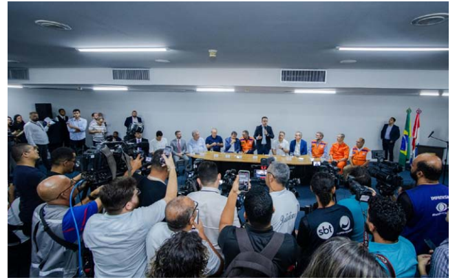
MINISTROS mostraram preocupação do governo Lula com Alagoas