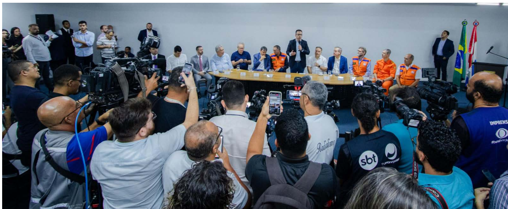
MINISTROS estiveram ontem em Alagoas, avaliaram a destruição causada pelas chuvas e anunciaram ações de socorro aos municípios afetados

CHUVAS, Governo federal vai liberar Bolsa Família e pagar R$ 800,00 de ajuda por afetado