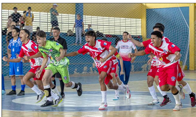
COMPETIÇÕES acontecem do sábado até o dia 26 de julho

O Jeal é organizado por meio de uma parceria tripla entre as secretarias de Estado da Educação; Esporte, Lazer e Juventude (Selaj) e Federação Alagoana de Esportes Colegiais (Faec). Serão disputadas 23 modalidades, sendo 19 individuais e quatro coletivas.