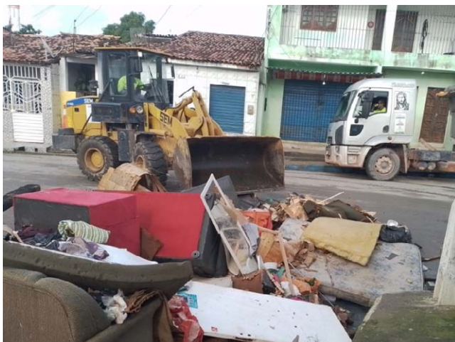
ALURB recolheu lixo para evitar novos transtornos na capital

Com os 105 milímetros de chuvas, registrados pela Defesa Civil, nas 24h em que choveu mais forte na capital, diversos itens descartados de forma irregular ou arrastados das residências dos cidadãos pelas águas pluviais, como sofás, colchões, cama e recicláveis foram parar nas ruas. Por isso, com ajuda de máquinas, a Alurb segue fazendo o recolhimento para amenizar os transtornos causados aos