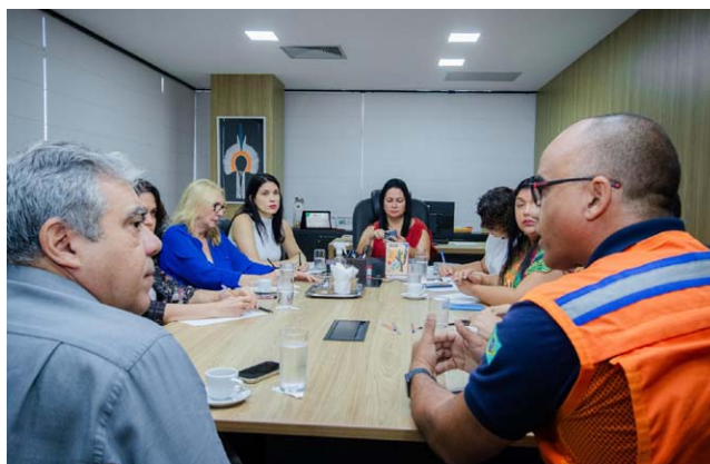
REUNIÃO de ontem sobre o socorro às famílias afetadas pelas chuvas

Ele ressaltou que para garantir uma assistência adequada é fundamental que os municípios encaminhem seus Planos de Detalhe de Resposta à Defesa Civil Nacional de Defesa Civil, com o número o mais exato possível das famílias desabrigadas e desalojadas. Nas enchentes de 2022, de acordo