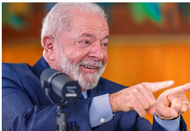
LULA: "O governo pode cobrar menos e arrecadar mais"

construir, reduzindo a capacidade de pagamento de imposto, mas aumentando a quantidade de pessoas que vão pagar. O governo pode cobrar menos e arrecadar mais porque tem mais gente pagando. A gente então inibe a sonegação", disse o presidente.