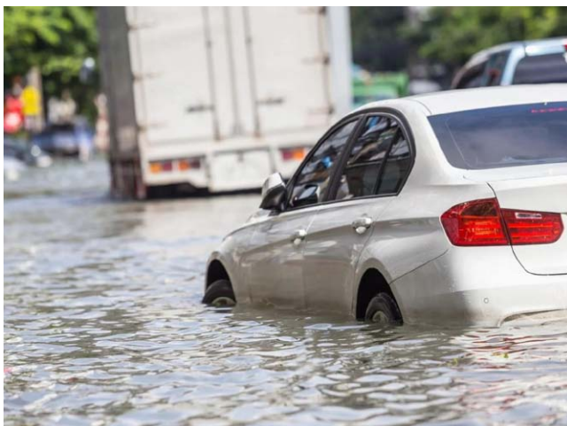
TEMPORAIS causaram prejuízos em vários municípios alagoanos

pessoas se encontram desabrigadas e outras 3.959 estão desalojadas. Conforme a Defesa Civil, a redução do número se dá em razão do período de estiagem, já que houve