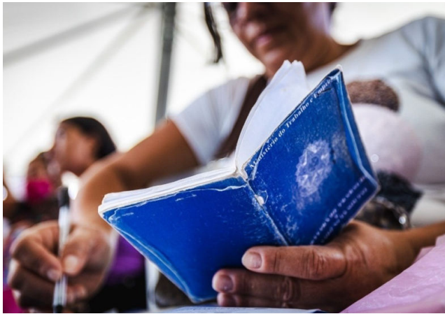
EM MACEIÓ, 462 mil pessoas estão trabalhando

Um dos principais setores responsáveis por esse crescimento é o Turismo, que vem se fortalecendo na capital, tornando Maceió cada vez mais destaque no