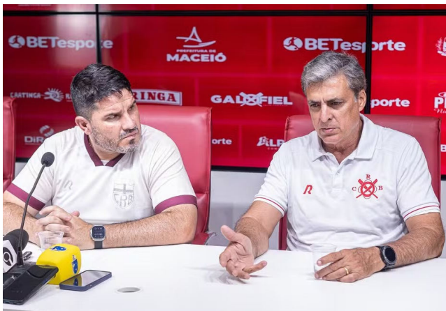
BARROCA E MARROQUIM buscam entrar num entendimento

“Vejo o CRB num crescimento bastante acentuado na parte estrutural, na vontade de fazer as coisas certas, na vontade de investir em capital humano, de