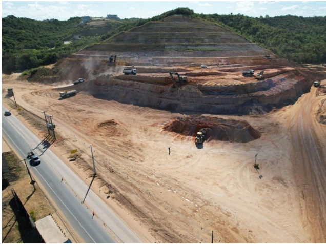
OBRAS ESTRUTURANTES estão incluídas neste pacote do governo