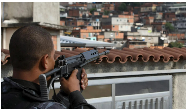
BRASIL está no grupo de 66 nações de alta periculosidade

Apesar da piora no nível de criminalidade, o país apresentou leve avanço na chamada “resiliência ao crime”, subindo da 94ª para a 86ª posição. Ainda assim, o