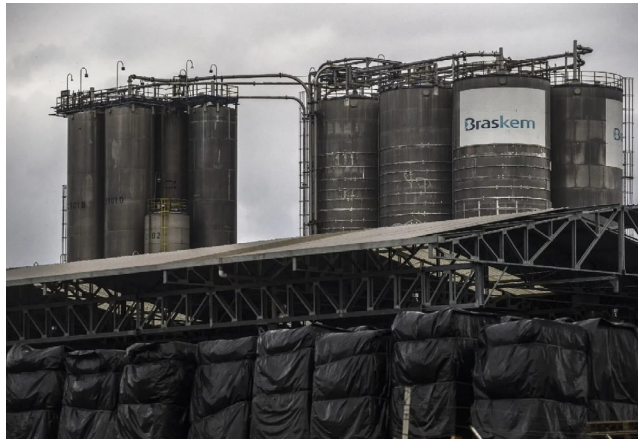
EMPRESA PETROQUÍMICA já teria pago R$ 139 milhões

Em outubro deste ano, a Braskem ainda anunciou um investimento de R$ 4,2 bilhões para aumentar a capacidade de produção de eteno em sua central petroquímica do Rio de Janeiro,