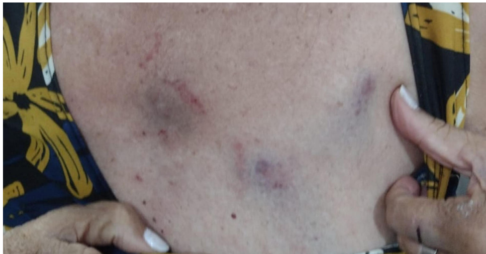
IDOSA apresentava diversos hematomas em várias partes do corpo

médica foi autuada, elas teriam agredido a idosa por conta dela ter se recusado a fornecer a senha do Wi-Fi.