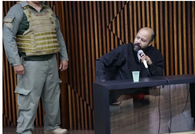
ALBINO É APONTADO como autor de 18 homicídios em Maceió

Em depoimento, o réu ainda tentou alegar que a vítima tinha envolvimento com o tráfico de drogas, o que também tentou fazer nos outros casos em que foi condenado. Porém, essa informação foi descartada pela Polícia Civil de Alagoas,