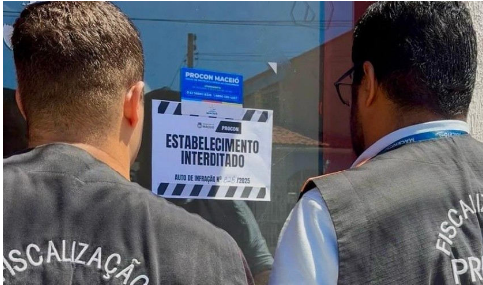
FISCALIZAÇÃO foi realizada pela equipe da Vigilância Sanitária na manhã de ontem

Além disso, o responsável não apresentou o Alvará