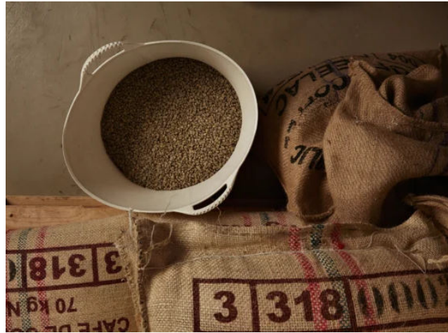
TARIFA DE 50% dos EUA reduz embarques de café pela metade