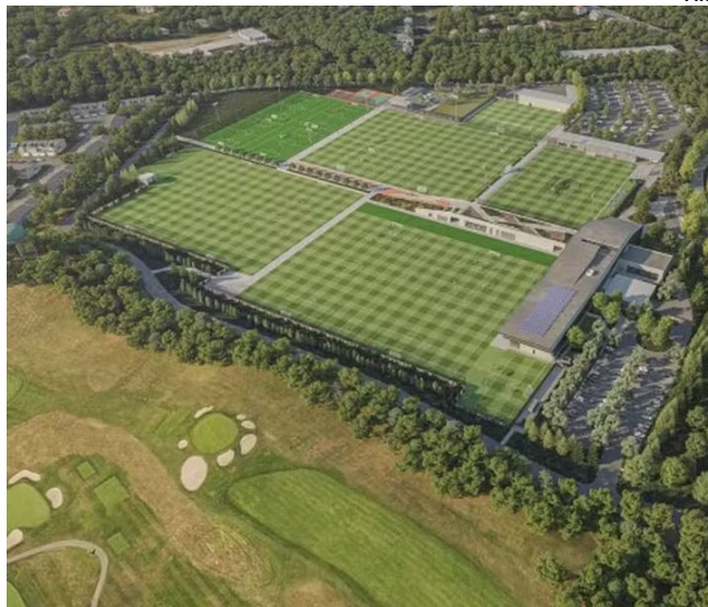
COLUMBIA PARK TRAINING FACILITY foi o escolhido pela Seleção

“Creio que fizemos a melhor escolha dentro das