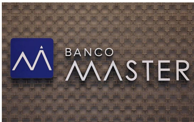
FRAUDES envolvendo o Banco Master tem sido investigadas pela PF

Por decisão do ministro Dias Toffoli, do Supremo Tribunal Federal (STF), foram cumpridos 42 mandados de busca e apreensão, além do sequestro