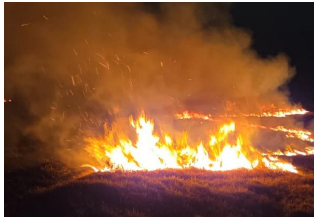
SOMENTE NESTE ANO , foram atendidos 70 casos de fogo em vegetação

Diante do aumento no número de ocorrências, o CBMAL reforça o alerta para que a população evite