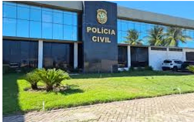
Polícia Civil conseguiu decreto de prisão preventiva para o acusado

investigado foi possível por meio da análise de imagens de câmeras de segurança, extratos bancários e diligências