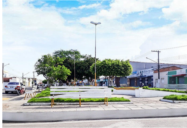
CAMPO GRANDE , no Agreste alagoano, é alvo da apuração

Além das deficiências operacionais, o relatório destacou a ausência do Plano