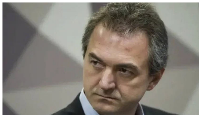
GRUPO DE JOESLEY BATISTA tem operações em território venezuelano

Apesar de não ocupar cargo público nem exercer função diplomática formal, Joesley atua de maneira ativa nos bastidores. De acordo com a CNN, ele mantém o governo brasileiro, comandado pelo presidente Luiz Inácio Lula da Silva (PT), informado sobre suas movimentações em Caracas.