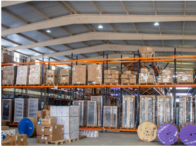
EMPREENDEDORISMO se manteve em alta no estado em 2025

Os rankings anuais, que abrangem os 102 municípios alagoanos, revelam não apenas as posições atuais, mas também a variação em relação a 2024 e o total de registros efetuados em