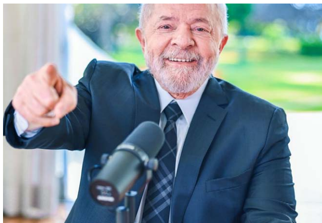
LULA: “Não temos inflação de demanda, o povo não está comprando”

Em abril, o FMI reduziu a previsão de crescimento da economia brasileira para 0,9% este ano, abaixo da média mundial e da média dos países da América Latina e Caribe. No relatório anterior, de janeiro, a previsão era maior, de 1,2%.