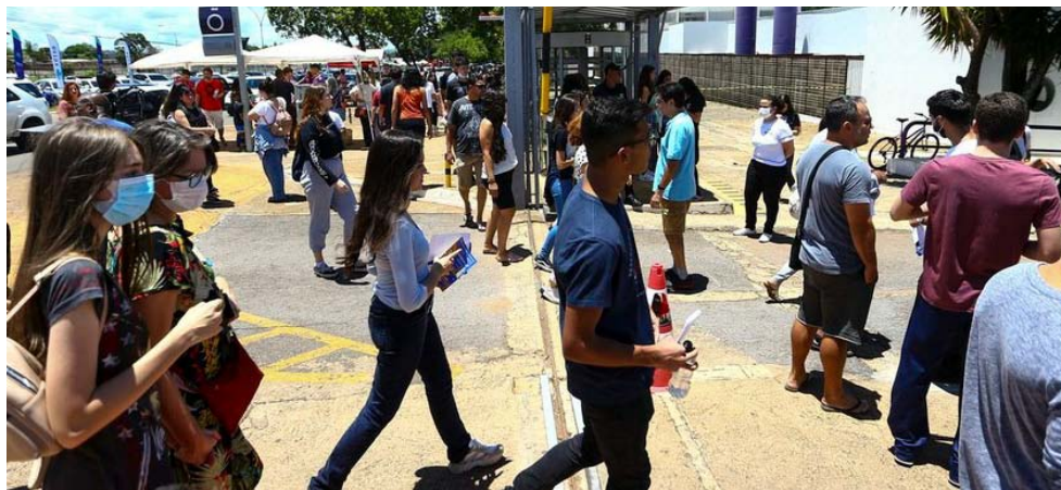
PROVAS serão realizadas nos dias 5 e 12 de novembro; resultados são divulgados em 16 de janeiro

A publicação do Instituto Nacional de Estudos e Pesquisas Anísio Teixeira (Inep) traz também critérios para correção das provas e procedimentos para pessoas que precisam de cuidados especiais durante