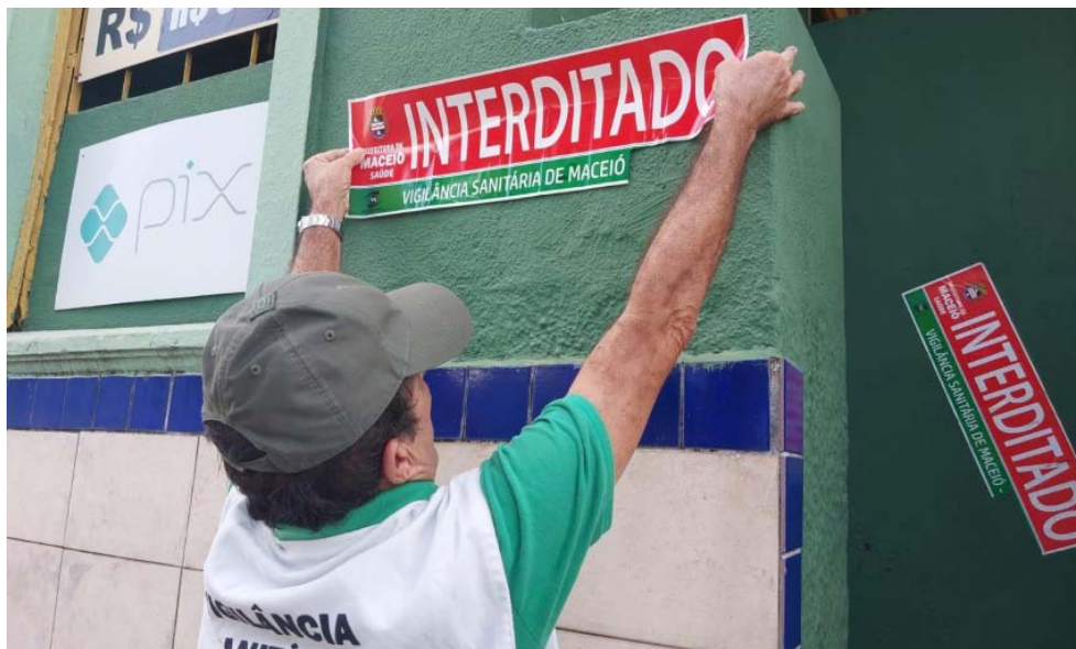
MOTEL foi interditado após uma fiscalização que detectou diversas irregularidades

“Ao chegarmos no local, nos deparamos com um ambiente insalubre e totalmente fora dos padrões sanitários. Nosso dever é assegurar a saúde da população, e um local nesse estado pode causar riscos à saúde de quem frequenta o estabelecimento. Por isso