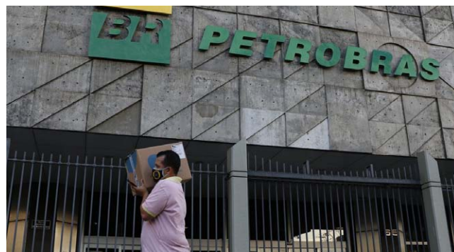
PETROBRAS vai passar a cobrar R$ 2,66 por litro do combustível

De acordo com o comunicado, “a redução do preço da Petrobras tem como objetivos principais a manutenção da competitividade dos preços da companhia frente às principais alternativas de suprimento dos seus