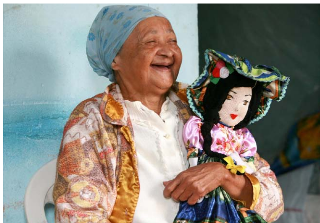
MESTRES devem comprovar atividades culturais em Alagoas

Os candidatos interessados podem se inscrever preenchendo o formulário disponível no portal da Secult e entregá-lo no setor de Protocolo da Secretaria, na Praça Marechal Floriano Peixoto, Centro