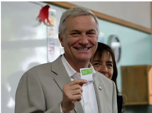
KAST teve cerca de 58% dos votos válidos

Estas são as primeiras eleições presidenciais no Chile em que o voto é obrigatório. Kast parece ter capitalizado a transferência de votos de candidatos de direita derrotados no 1º turno, tendo garantido o apoio do libertário Johannes Kaiser e de Evelyn Matthei, representantes da direita