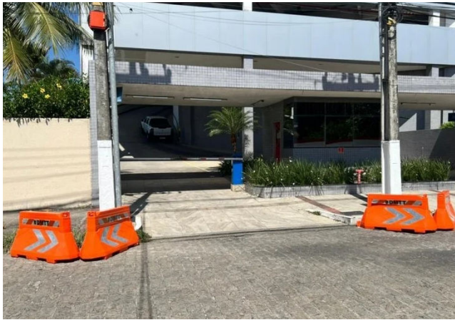
BARREIRAS PLÁSTICAS devem obedecer diretrizes da DMTT

“Recebemos várias denúncias de veículos estacionados de forma perigosa, às vezes até além do limite das entradas das garagens em condomínios e outros imóveis, o que dificulta a manobra e coloca em risco a segurança dos motoristas, pois em algumas situações, a visão de quem está diri-