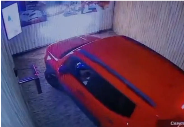
MATERIAL APREENDIDO foi levado para a Central de Flagrantes

De acordo com as autoridades, o militar invadiu o quarto onde a vítima se encontrava acompanhada da esposa do policial e efetuou disparos de arma