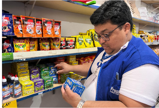
ITENS DA CESTA BÁSICA tiveram os preços rigorosamente conferidos

Segundo a Secretaria de Estado da Fazenda (Sefaz), o recuo em Maceió foi impulsionado principalmente pela redução nos